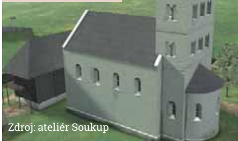
Zdroj: ateliér Soukup

Drslaviců (ti pak přesídlili na hrad Litice). Měla patrně mohutnou věž nad presbytářem a její panská tribuna byla spojená lávkou s nedalekým obydlím kastelána hradu. Dalšími již neexistujícími kostely byly dole ve městě kostel sv. Martina (z něho se při výzkumu v ulici Sv. Čecha z r. 2012 odkrýval pouze hřbitov) a pak kostel sv. Václava. Pravděpodobně to byly prosté jednolodní stavby. Poslední již neexistující stavbou je