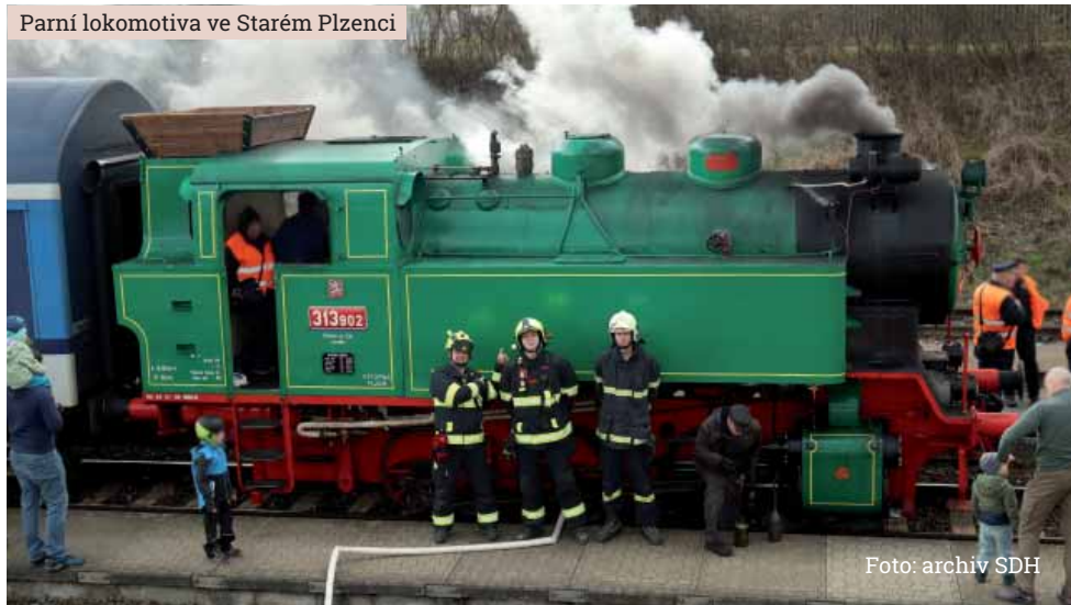
Parní lokomotiva ve Starém Plzenci