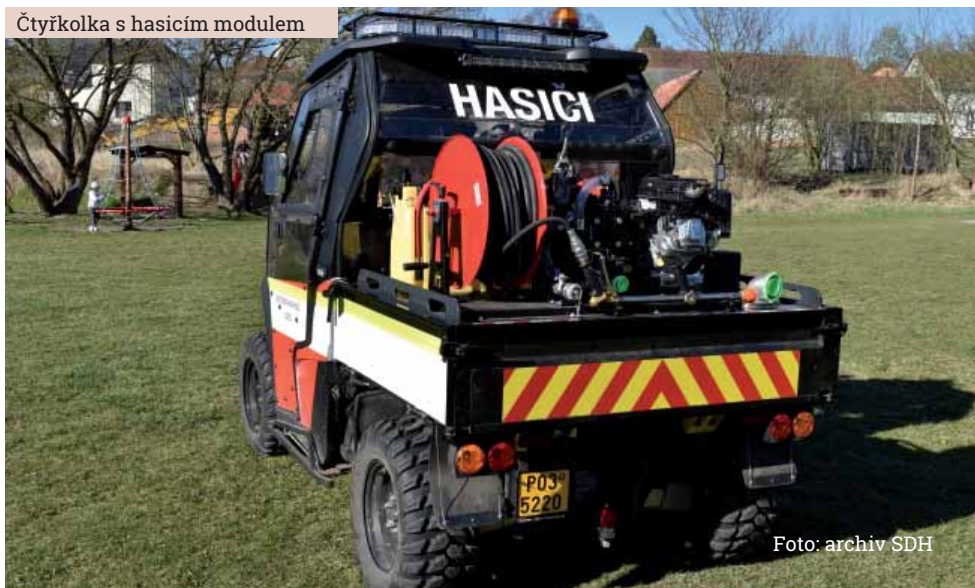
Čtyřkolka s hasicím modulem

pěnotvorné zařízení Pro-pak, které lze připojit na D program pro hašení lesních požárů,“ uzavírá Radek Matas. AN