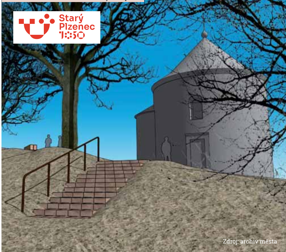
Pohled na terénní schodiště od cesty ze západu