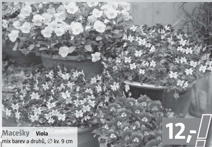
Macešky Viola mix barev a druhů, Ø kv. 9 cm