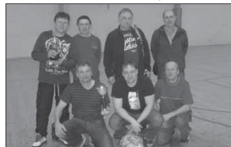
Vítězné mužstvo Horažďovice s cenami.