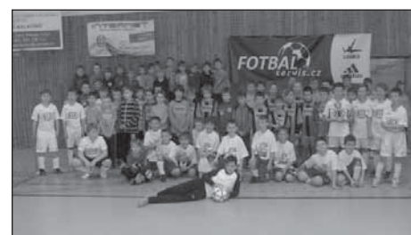
Mužstva při slavnostním vyhlášení výsledků.