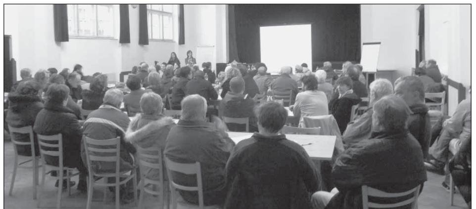
Veřejné setkání občanů k Programu rozvoje města se uskutečnilo 11.2.2016 v Lidovém domě.