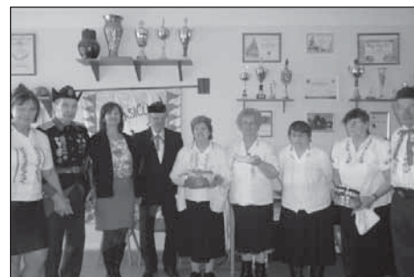
Baráčníci s paní starostkou na výroční členské schůzi.