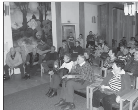
Posluchači se zájmem naslouchali informacím o architektonickém vývoji i o památkách Plzně.