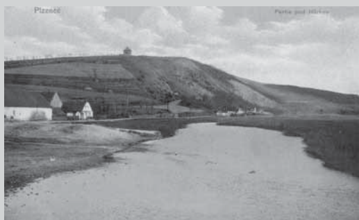
Výstava potrvá do 8. září 2016.