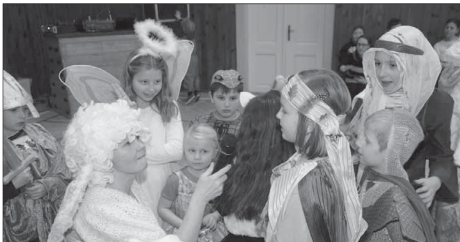
Andělský maškarní rej.