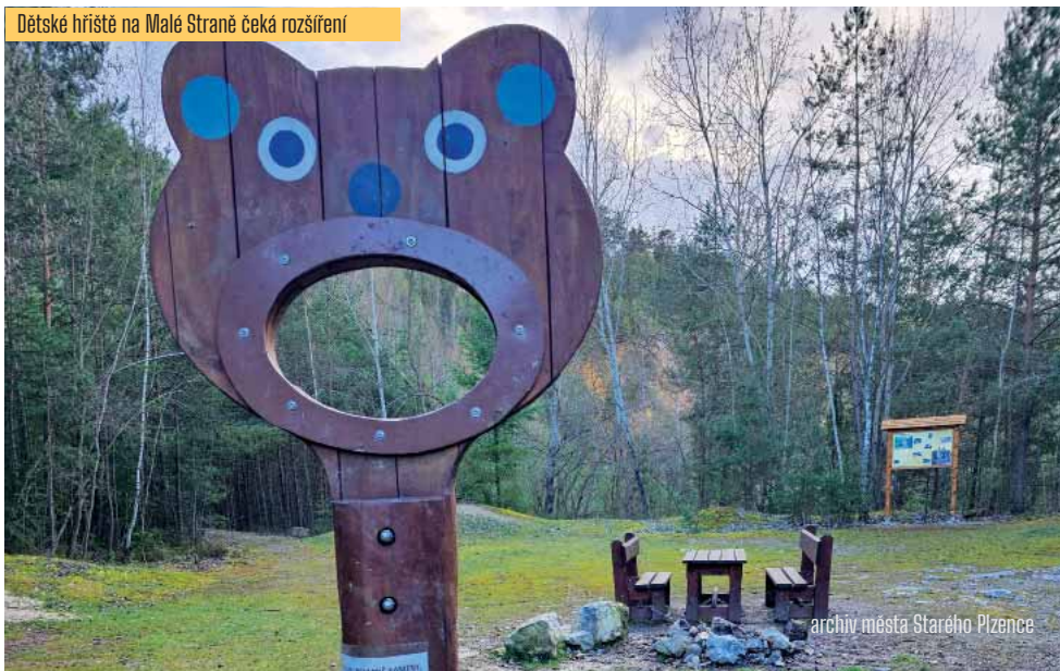
Dětské hřiště na Malé Straně čeká rozšíření

zejména místním dětem a jeho podoba se bude vyvíjet dle jejich potřeb. Posledním projektem je zhotovení informačních tabulí a odpočinkového místa na Radyni. Vzhledem k nejvyššímu počtu záporných hlasů jsme se rozhodli tento projekt realizovat až po zohlednění námitek zejména k podobě a umístění infotabulí.