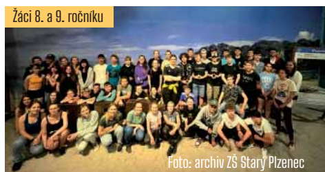
Žáci 8. a 9. ročníku

do areálu Tepfactoru. Ve staré tovární hale je zde vybudována jeskyně s 29 herními místnostmi po vzoru oblíbené televizní