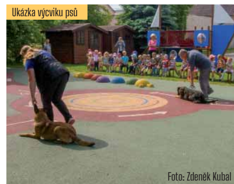
Ukázka výcviku psů

se naši detektivové ze čtvrté a páté třídy vypravili na poslední detektivní výpravu. Tentokrát nám detektiv Fousek připravil