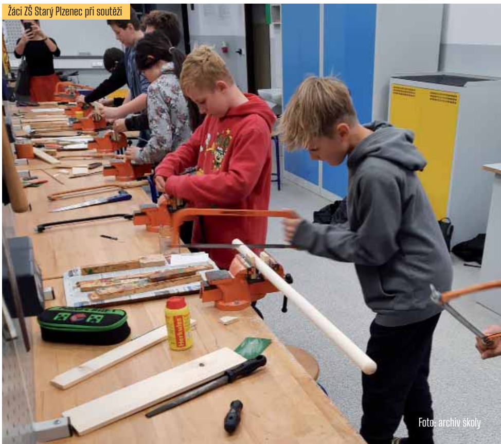
Žáci ZŠ Starý Plzenec při soutěži