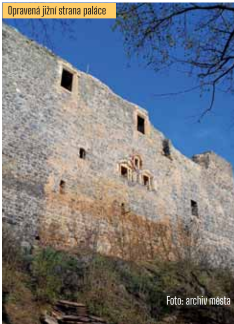
Opravená jižní strana paláce

Opravy hradu Radyně jsou pro letošní rok hotovy, lešení je odvezené a návštěvníci se mohou opět nějaký čas těšit nerušeným výhledem na jižní stranu paláce. Práce na samotném zdivu víceméně naplnily předpokládaný rozsah z projektu. Jen