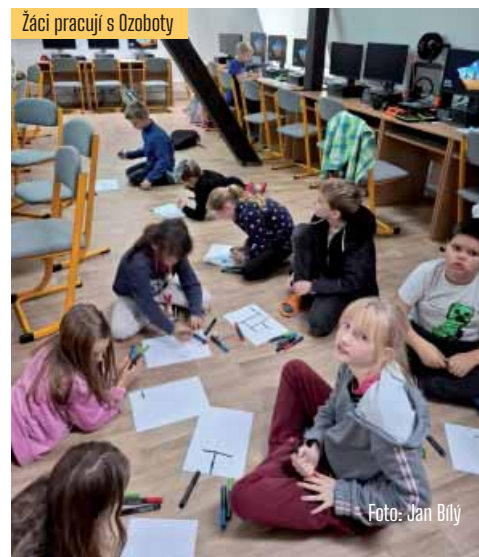
Žáci pracují s Ozoboty