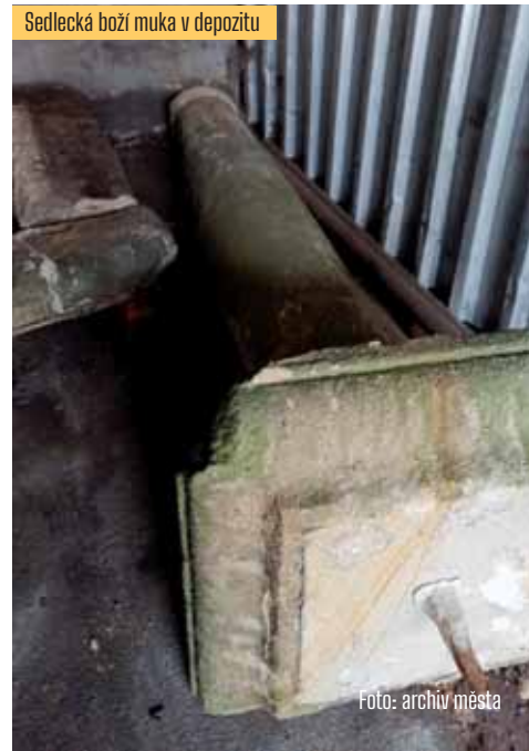
Sedlecká boží muka v depozitu