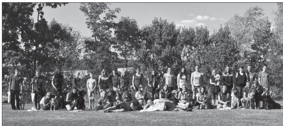
Účastníci tábora se svými miláčky.

Když v roce 1979 připravovali plzeňští kynologové tábor pro mládež z celé České republiky, netušili, že se stane nedílnou součástí sportovní kynologie a tradicí spojenou se Starým Plzencem.