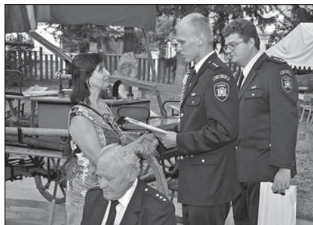
Předání pamětního listu starostce města.

v soutěži se představili hasiči ze Zdemyslic, kteří předvedli sekyrkové cvičení, a přijeli i hasiči záchranného sboru z Plzně – Slovan, kteří představili svoji techniku. Po skončení soutěže v požárním útoku si mohli zájemci vyzkoušet