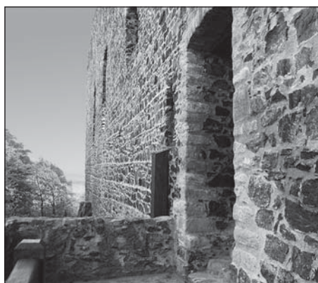
Vchod do hradního paláce Radyně.

Již několik let jde krajem plzeňským zvěst mírně zábavná o tom, co se na hradě Radyňi mělo přihodit 15. října 2003 při návštěvě tehdejší hlavy státu. Prezident prý přijel