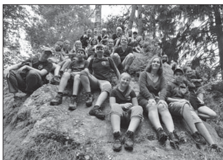
U rozhledny Útvina

Cílovou stanicí našeho letošního putovního tábora bylo Vrbno pod Pradědem, kde jsme byli ubytováni v kempu Dolina. Z tohoto stanoviště jsme podnikali rozmanité výlety. Naším prvním cílem, můžeme říci i nejdůležitějším, byl Praděd, nejvyšší hora Jeseníků. Na něj jsme stoupali z Karlovo Studánky, kdy jsme ochutnali zdejší osvěžující železitý pramen. Stoupání nebylo lehké, bylo velké teplo a slunce hřálo, až v posledním úseku stoupání se zatáhla obloha a začalo hřmít. Na Pradědu jsme vydatně posvačili a nabrali sílu na sestup. Chtěli jsme ještě zajít na Petrovi kameny, bohužel nám to ale překazilo počasí, a tak