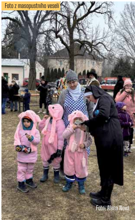
Foto z masopustního veselí

Trasa masopustu vedla celkem k devíti hostitelským rodinám, které maškary bo-