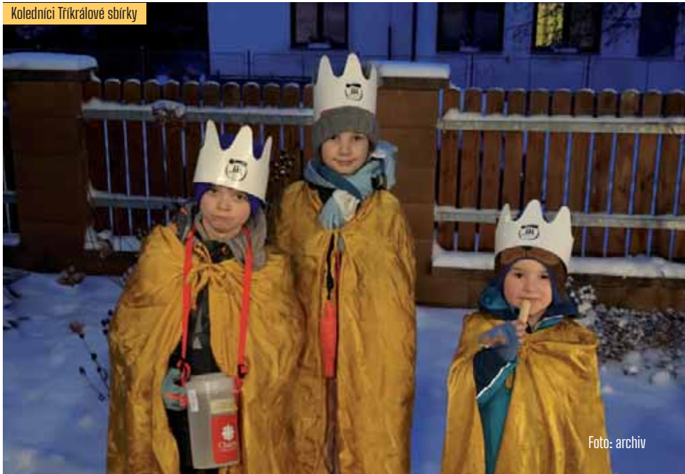
Koledníci Tříkrálové sbírky

Pro mne osobně je ale důležitější, že každý rok se objevují nové tváře nadše-