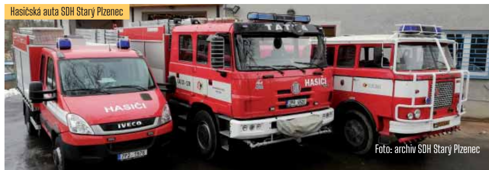
Hasičská auta SDH Starý Plzenec

bere na vědomí – informace o zásazích IZS na území města v souvislosti s bleskovými povodněmi dne 2. 6. 2024, včetně informací o monitorování a průběhu odstraňování škod vzniklých v souvislosti s uvedenými událostmi, ukládá informovat o možnostech věcné a finanční pomoci ze strany města a Římskokatolické farnosti Starý Plzenec, ukládá zpracovat formulář žádosti o dotaci a související administrativní náležitosti pro poskytnutí finanční pomoci občanům z krizového fondu města, vyjadřuje poděkování zasahujícím členům JSDH Starý Plzenec, JSDH Sedlec, všem složkám IZS a dobrovolníkům, kteří se podíleli na odstraňování vzniklých škod