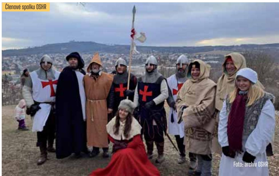
Členové spolku OSHR