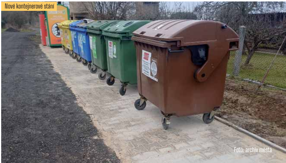
Nové kontejnerové stání

V uplynulém roce se v oblasti odpadového hospodářství událo několik poměrně zásadních změn. Tou nejdůležitější bylo zahájení třídění a svozu bioodpadu, a to jednak do kontejnerů instalovaných na vybraná stání, jednak ve sběrném dvoře, kde byla zavedena evidence likvidované biomasy. Tímto opatřením se mimo jiné navyšuje poměr vytríděného odpadu v souladu s požadavky zákona o odpadech. Pro rok 2026 budeme nadále vyhodnocovat potřebu BIO kontejnerů a jejich počty přizpůsobovat poptávce.