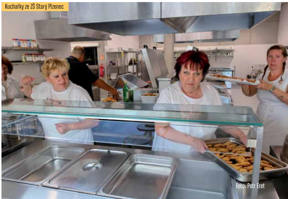
Kuchařky ze ZŠ Starý Plzeňec

Stejnou povinnost tak má Starý Plzeňec, který na to potřebuje zhruba sedm milionů korun. „Za to by se se udělaly ve městě dvě nebo tři významné investiční akce, třeba opravené ulice,“ upozorňuje starosta Jan Eret. „A nejde jen o nepedagogické pracovníky, ale budeme nově školám platit i ostatní neinvestiční výdaje,“ doplňuje starosta. Dodává, že mezi radou města a školskými zařízeními panuje úzký vztah a že nové a nákladné financování bude kontrolováno společně nastavenými kontrolními mechanismy. AN