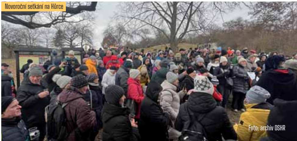
Novoroční setkání na Hůrce

1050 let Starého Plzence v proluce ve Smetanově ulici 13. června, na kterých se budou prezentovat staroplzenecké spolky, místní školka, základní školy a základní umělecká škola. A účast na nich přislíbil i náš rodák a nejlepší házenkář světa Filip Jícha, který Starý Plzenec už léta reprezentuje v České republice a po celém světě. Tento den oslav uzavře koncert známé renesančně folkové kapely Klíč, která na české hudební scéně působí již úctyhodných 43 let. Následující den by se měl konat další koncert barokní hudby nazvaný Barok gala v kostele Narození Panny Marie, který bude výjimečný jak svým repertoárem, tak účinkujícími umělci.