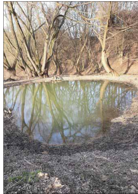
Horní tůň pod Blažejem