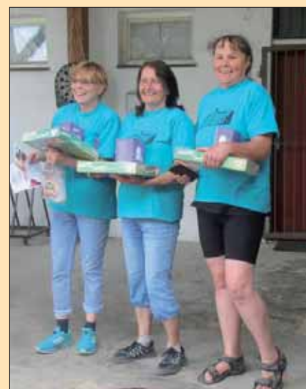
„Školáci“ vítězné družstvo