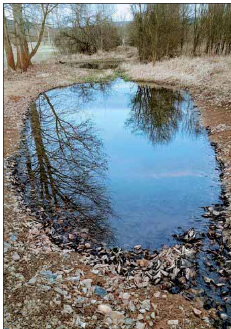
Dolní tůň pod Blažejem