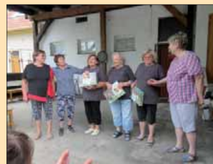
„Kopretiny“ ČSŽ organizátoři turnaje