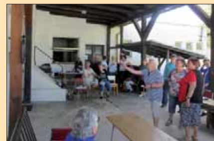
„Invalidky“ při házení šipek