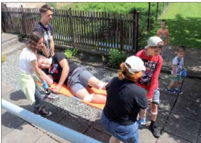
Ošetřování zraněného během kurzu první pomoci

Během English Campu se děti pod dohledem početného týmu z Ameriky zdokonalovaly v angličtině. Učily se o lidském těle, zpívaly písničky a hrály karetní, sportovní i konverzační hry. Také se dozvěděly