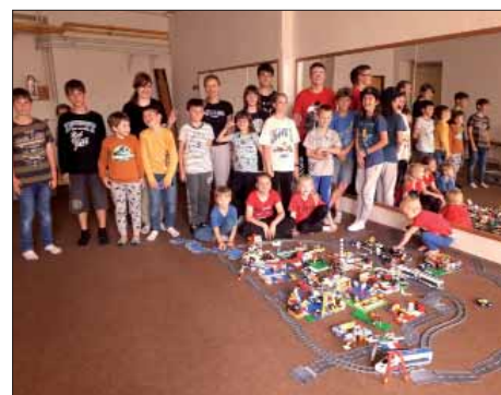
Dokončené město na Lego párty

Druhé polovině června dominovala lego párty a následný English Camp. Dětská misie Pokračování na str. 15