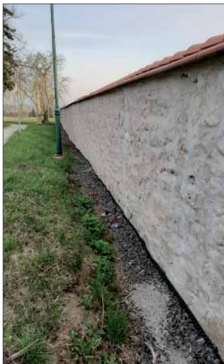
Opravená hřbitovní zeď