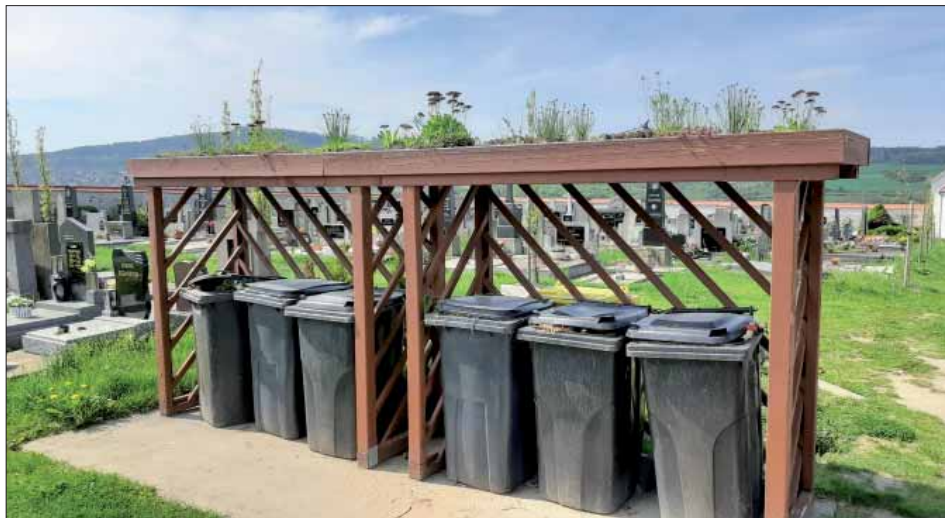
Nové stání na odpady se zelenou střechou

Polorozpadlá hřbitovní zeď, nevhledné túje poškozující náhrobky. O revitalizaci starého hřbitova nad farou jsem Vám již psala v březnových Radyňských listech. A co „nový hřbitov“? Plzeňský hřbitov o rozloze 10 141 m 2 byl založen, vybudován a osázen v roce 1929 dle návrhu Karla Štiky, plzeňského mistra zednického a majitele stavební firmy. Od té doby nedoznal hřbitov téměř žádných změn. Původní ohradní kamenná zeď byla narušována kořenovými systémy náletových dřevin z vnější strany ze sousedních pozemků a z vnitřní strany kořeny nevhodně, těsně při zdi vysázených dřevin u jednotlivých hrobů. Koruna zdi se rozpadala. Podobný osud potkal i vysázené dřeviny, k některým hrobům byl obtížný přístup, jiná hřbitovní zařízení a pomníky byly deformovány kořeny stromů. Proto jsme nechali již v r. 2015 připravit projektovou dokumentaci na stavební a sadovnické úpravy hřbitova. Chtěli jsme, aby se hřbitov stal místem zastavení, vzpomínek i klidného zamyšlení. V prosinci 2015 bylo provedeno dendrologické posouzení a navrženo ke kácení 46 tují, 2 jalovce a část břečťanu. Projekt byl rozdělen na několik etap a úpravy realizovány postupně. Nejvýznamnější částku tvořila oprava hřbitovní zdi, celkem 1.630 tis. Kč, z toho činila dotace