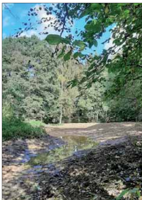
Tůň pod benzínovou čerpací stanicí