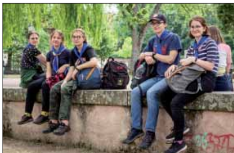
Družina Medvěďů poblíž francouzského areálu Ecomusée d'Alsace, kde se konal Intercamp.

Začátkem června se družina Medvěďů pod dohledem vedoucí Ély vypravila až do