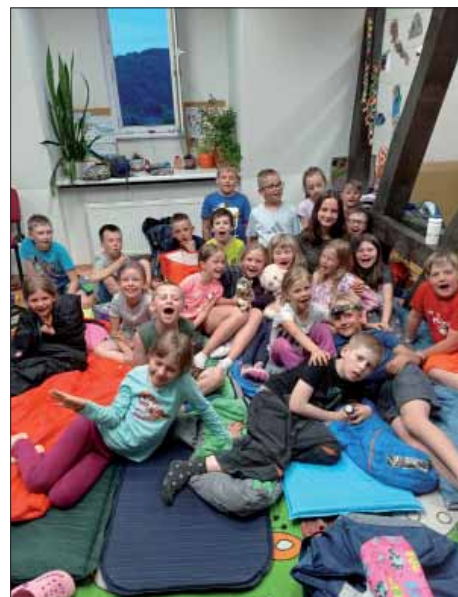
Děti z oddělení Soviček a Motýlků