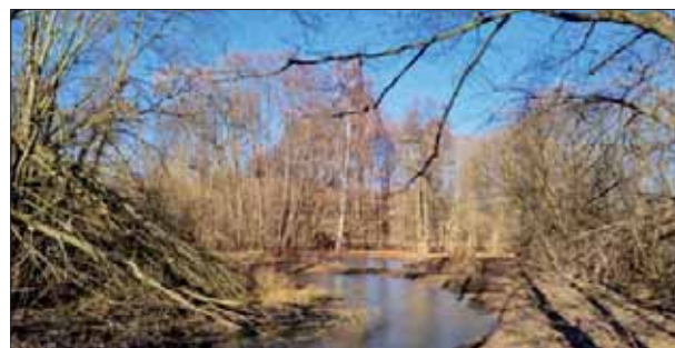
Tůň pod benzínovou čerpací stanicí

zaplatilo 137 tis. Kč, z toho 125 tis. Kč pokryla dotace z Ministerstva životního prostředí.