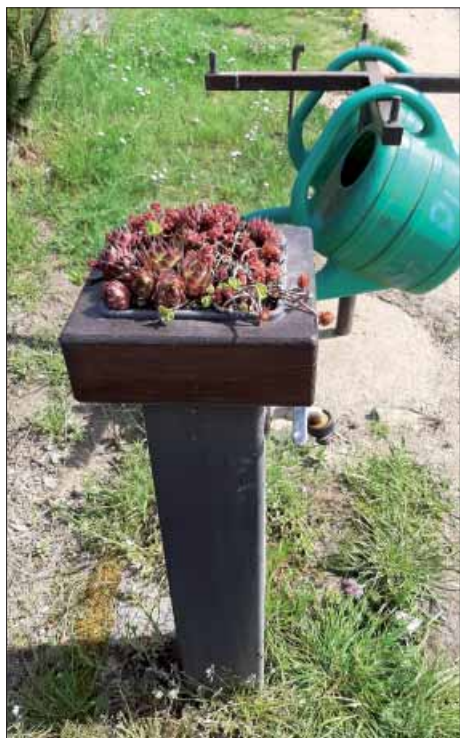
Nový stojánek na vodu