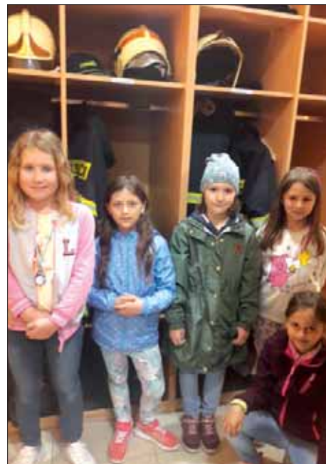
Návštěva u hasičů

Ve středu 25. 5. se všechny děti ze ŠD vydaly do hasičské zbrojnice. Děti byly rozděleny na 2 party. Na stanici nám ochotní dobrovolní hasiči ukázali vybavení pro likvi-