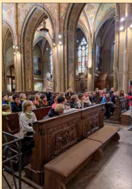
V bazilice sv. Petra a Pavla na Vyšehradě