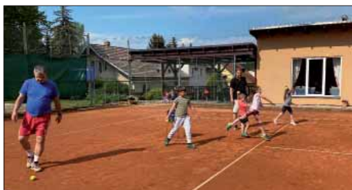
Tenisová škola pro děti

Program kempu je sestaven tak, aby si děti zdokonalily své tenisové dovednosti, poznaly okolí Starého Plzně a seznámily se s historií bílého sportu. Detailní informace získáte od předsedy Tenisového oddílu.