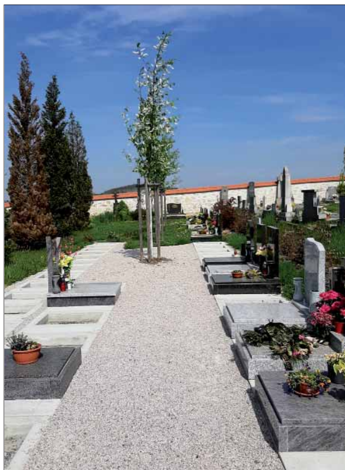
Nová urnová místa