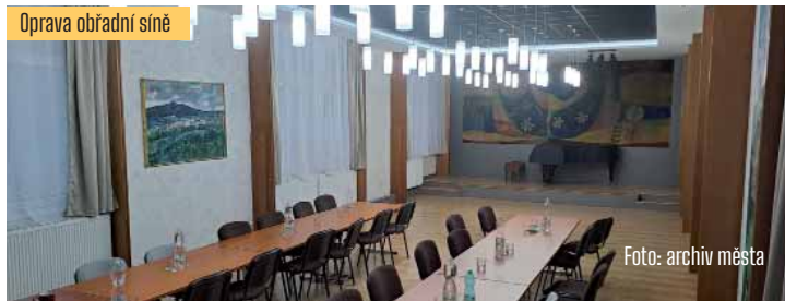
Oprava obřadní síně