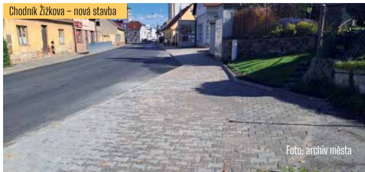
Chodník Žižkova – nová stavba