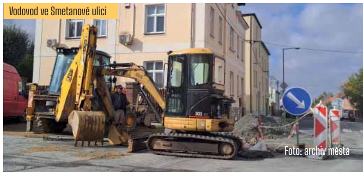
Vodovod ve Smetanově ulici