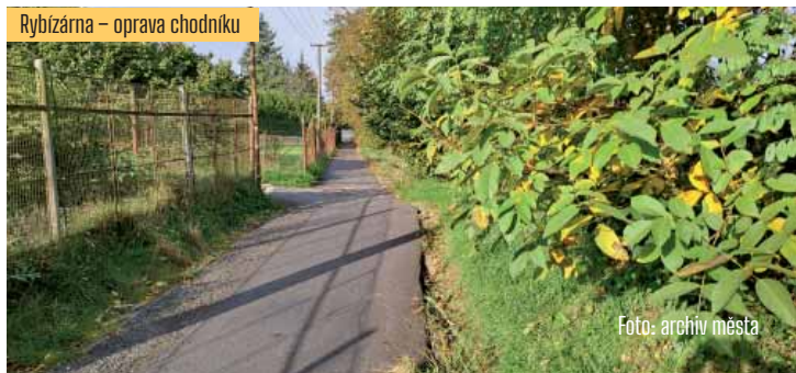
Rybízárna – oprava chodníku