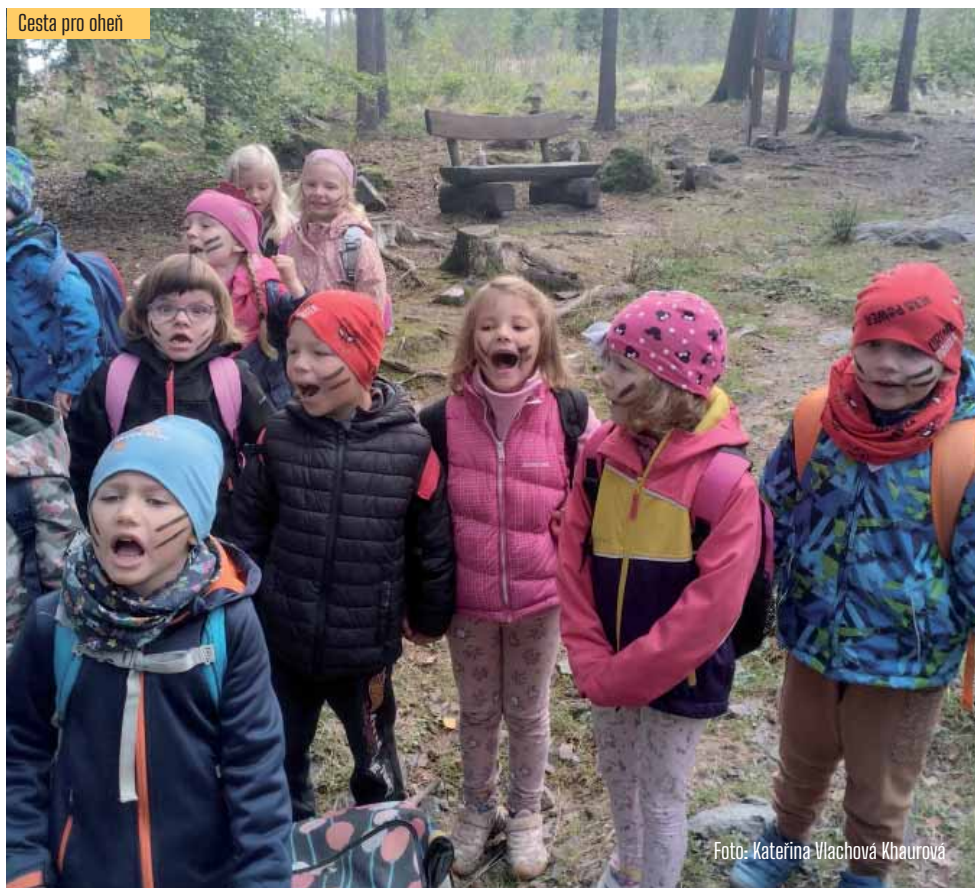
Cesta pro oheň