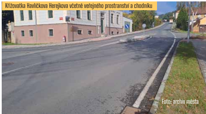
Křižovatka Havlíčkova Herejkova včetně veřejného prostranství a chodníku