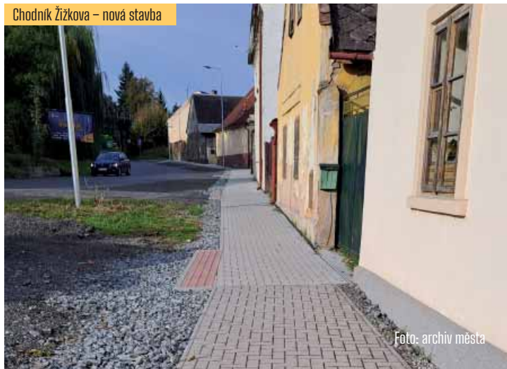
Chodník Žižkova – nová stavba