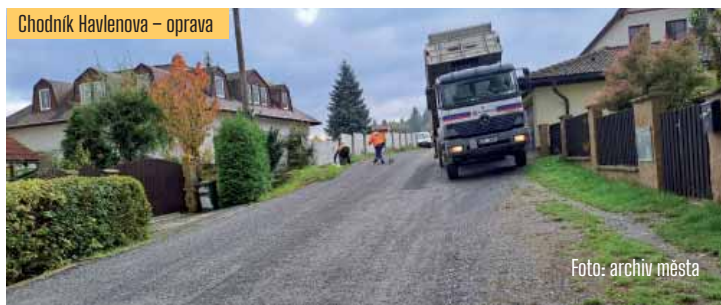
Chodník Havlenova – oprava