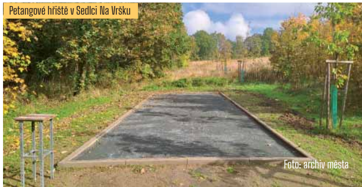
Petangové hřiště v Sedlci Na Vršku