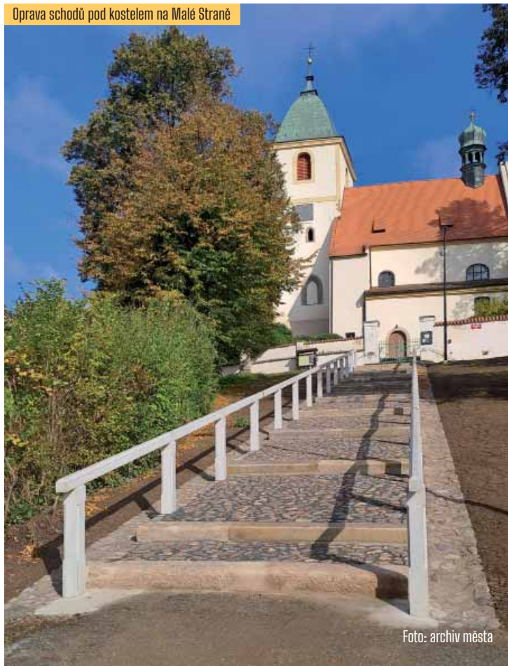
Oprava schodů pod kostelem na Malé Straně