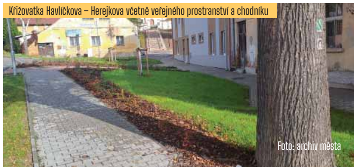
Křižovatka Havlíčkova – Herejkova včetně veřejného prostranství a chodníku