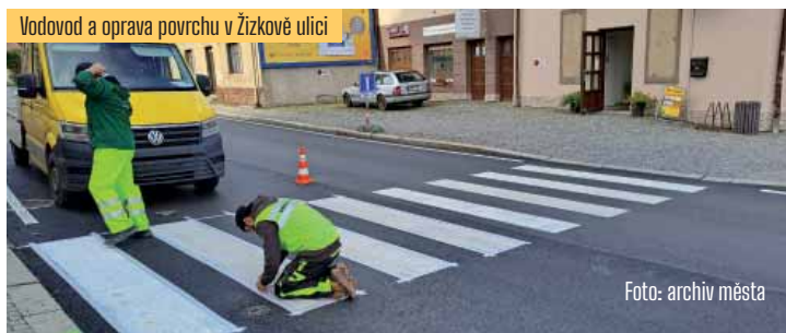
Vodovod a oprava povrchu v Žižkově ulici