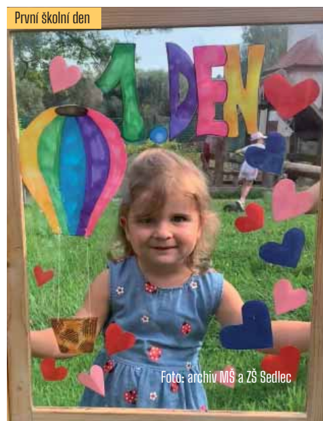
První školní den