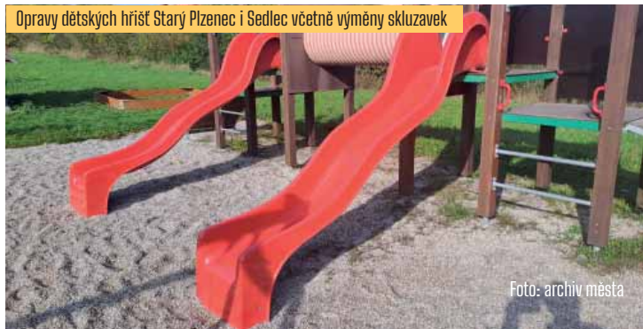
Opravy dětských hřišť Starý Plzeňec i Sedlec včetně výměny skluzavek