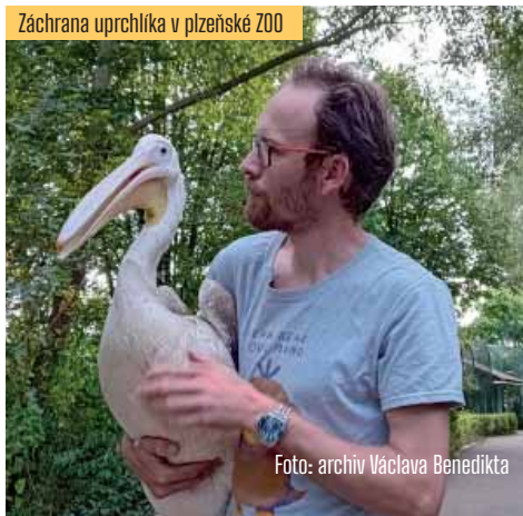
Záchrana uprchlíka v plzeňské ZOO

bezúplatně převede. Toto rozhodnutí umožní městu i nadále udržovat a rozvíjet významný krajinný prvek Ostrá Hůrka a zachovat jeho přírodní hodnoty pro další generace. Mám ale radost i z probíhajících oprav Radyně. Jsou spolufinancované z Programu záchran architektického dědictví Ministerstva kultury ČR. Pro město je klíčové, že Radyně je v tomto projektu zařazena, protože práce na ní jsou v zásadě nikdy nekončící. Obnažené zdivo podléhá zkáze nesmírně rychle, ani důkladná oprava a chemické ošetření koruny zdiva proti zatékající vodě nedokážou zabránit pokračující erozi a destrukci. Chceme-li Radyni zachovat alespoň v nynější podobě, musíme počítat s pravidelnou cyklickou údržbou zdiva. Kromě zmíněných oprav jsme letos díky spolupráci s OSHR nastartovali postupnou proměnu prostoru v bezprostředním okolí paláce. Je to už dokončená oprava schodů a zábradlí vedoucích k cisterně pod západní věží. A pak plánovaná instalace zábradlí kolem celého prostoru tzv. purkrabství, který je nyní ve fázi projednávání s památkáři a stavebním úřadem.