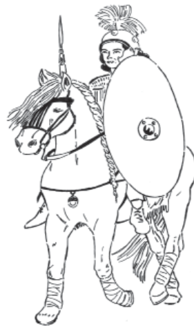
autor: Václav Engler

■ 16. listopadu 2024 Svatý Martin na Radyni Podzimní tvoření v CST Místo: předhradí hradu Radyně a Centrum služeb pro turisty Čas: 13:00 – 16:00 h