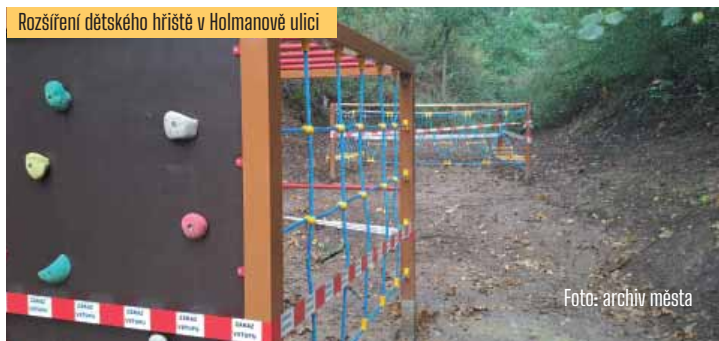
Rozšíření dětského hřiště v Holmanově ulici