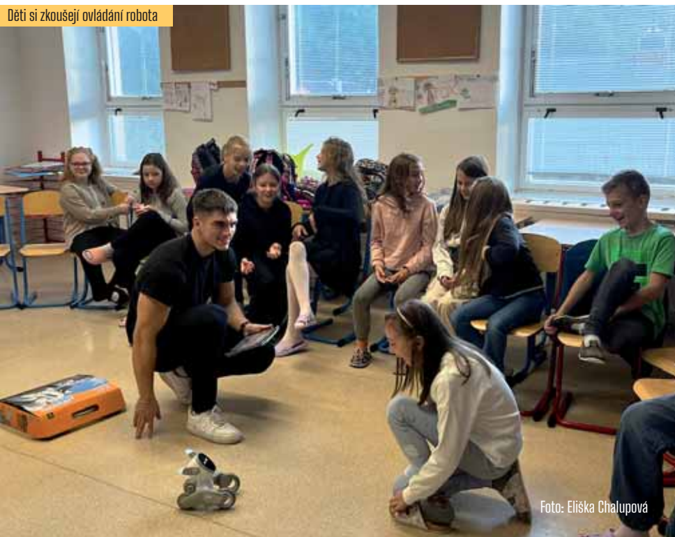
Děti si zkoušejí ovládání robota