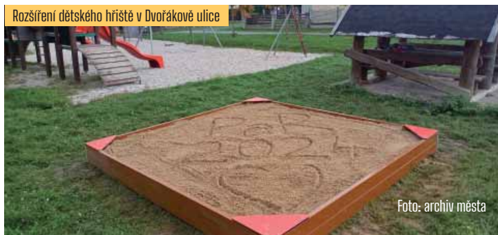
Rozšíření dětského hřiště v Dvořakově ulici