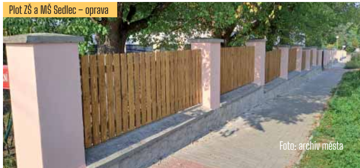
Plot ZŠ a MŠ Sedlec – oprava