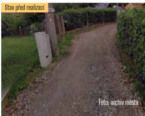
Stav před realizací