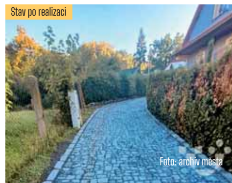
Stav po realizaci