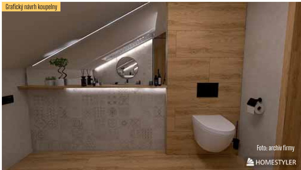
Grafický návrh koupelny

Petr Brejcha říká, že za existenci firmy vybavili desítky tisíc koupelen a dalších prostor. „Moc si vážíme toho, že máme už třetí generaci zákazníků a na nezáměr si rozhodně nemůžeme stěžovat. Loňský rok byl, co se obrátu týká, rekordní a letos to vypadá také dobře,“ uvádí s tím, že se snaží vyjít zákazníkům vstříc a příznivé mají i ceny. „Troufnu si říci, že máme některé ceny příznivější než velké obchodní řetězce nebo e-shopy. Můžeme jim směle konkurovat. Dokážeme materiál nejen dodat, ten, co je na skladě v podstatě okamžitě, a co je na objednávku zhruba do 14 dnů, ale i zajistit kompletní práce. Neděláme to my, ale máme spolupracující firmy, které například koupelnu udělají z našeho materiálu na klíč. Navíc vytvoříme zákazníkovi návrhy přesně podle jeho představ, a to bezplatně, nikoli jako některé firmy udělají první návrh a pár změn a pak už za každou chtějí zaplatit. Grafické návrhy v 3D děláme tak dlouho, dokud není zákazník naprosto spokojený. Pro nás je klíčový osobní přístup ke každému,