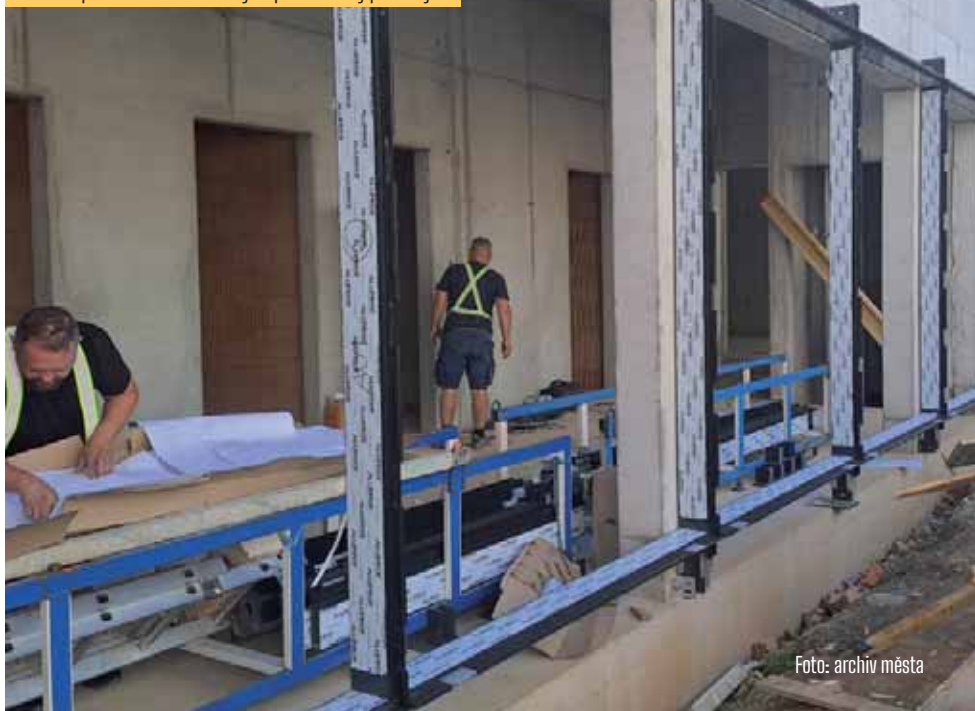
Stavební práce na dostavbě školy a sportovní haly pokračují