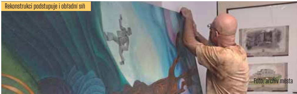
Rekonstrukci podstupuje i obřadní síň

Opravovala se i Mateřská škola ve Vrch- lického ulici. „Ve druhém nadzemním podlaží se dělaly nové elektroinstalace, podlahy, malby. Jedná se o rekonstrukci na- vazující na práce proběhlé v minulém roce, děti tak budou mít nově opravené prostory,“ říká Iva Brož Mračková. AN