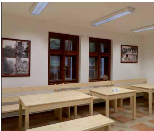
Interiér po rekonstrukci