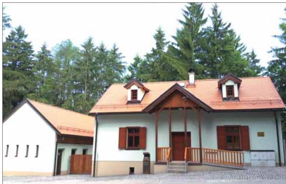
Hájovna po rekonstrukci a nové zázemí místo stodoly