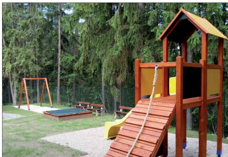
Zahrada s herními prvky pro děti