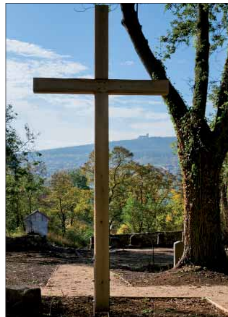
Nový stav - po revitalizaci