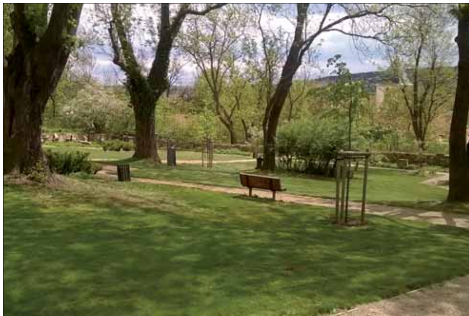
Nový stav - po revitalizaci