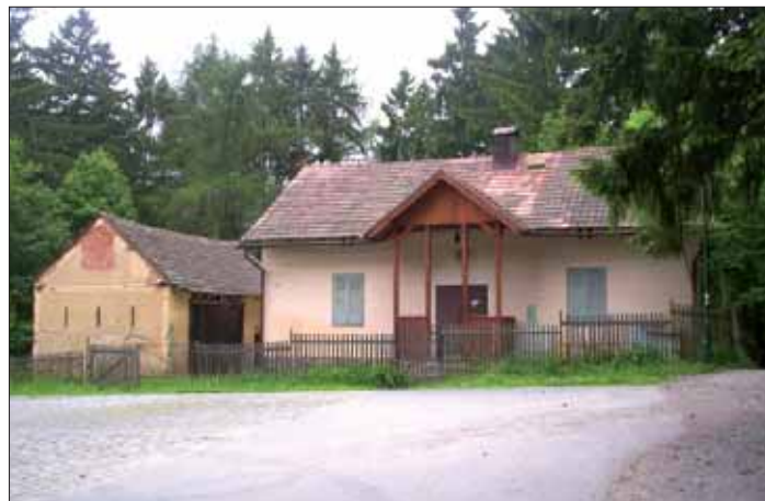
Hájovna s původní stodolou