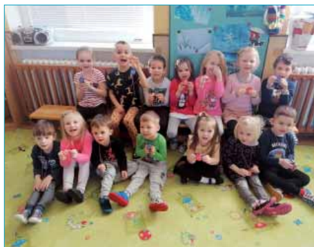
Zimní olympiáda a medaile

cesty nám měsíc „Ledna“ poděkoval a odměnil nás ledovou pochoutkou nejen pro nás, ale i pro zvířátka. Ostatním dětem jsme pak vyprávěli zážitky a zahráli jim i divadlo. Čas utíká jako voda a najednou tu byly jar-