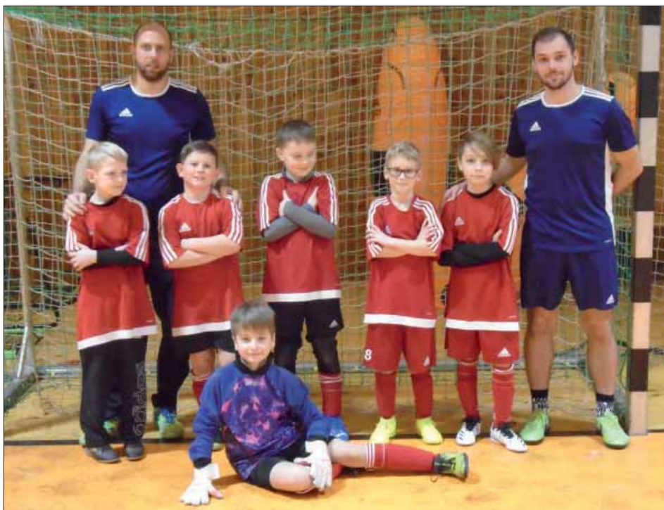
Domácí team minižáků SK Starý Plzenec