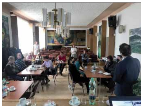
Foto ze setkání

Archeoplán je studií stavu a možností rozvoje lokality Hradu Stará Plzeň, která se připravuje s odborníky na historii, archeologii, cestovní ruch a marketing. Aktuálně byla dokončena jeho Analytická část, ze které