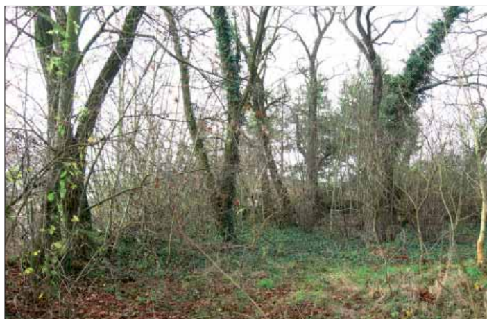
Původní stav - zarostlý prostor