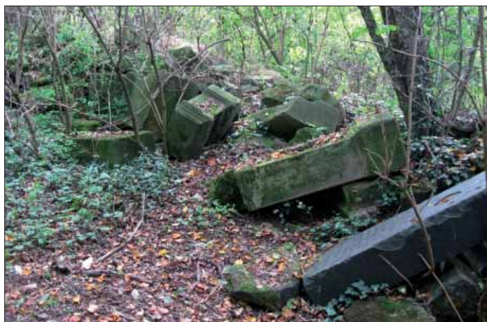
Původní stav - poházené náhrobky