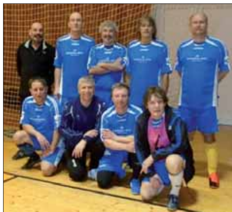
Mužstvo SK Starý Plzenec obsadilo na turnaji třetí místo

Zdeněk Suchý Strojní a elektrotechnická výroba Starý Plzenec Bezručova 389 332 02 Starý Plzenec mobil: 602 161 939 e-mail: suchyzd@seznam.cz