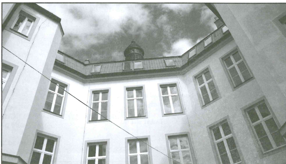
Před nástupem dětí do školy byla dokončena výměna 45 velkých oken v hlavní budově.

tech, zejména v roce 2015, do školy vložily. Hlavně díky iniciativám pana místostarosty Bc. Václava Vajshajtla máme nové plynové kotle, v současné době se dokončuje instalace nové termoregulace. Těsně před nástupem dětí do školy byla dokončena výměna 45 velkých oken v hlavní budově. Věřím, že jen za topení tak ušetříme nema-