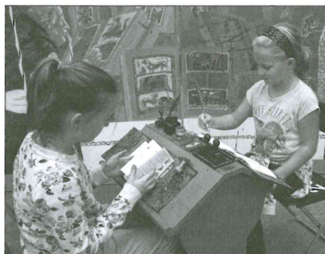
Písařská dílna ve středověku.

Vycházku jsme zakončili v hasičce Sedlec, kde věkově smíšená družstva poznávala dopravní značky a plnila kvíz z dopravní výchovy. Druhý den jsme vyhodnotili všechny soutěžící a první místo získalo