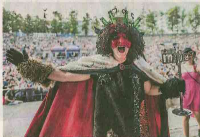
PEKELNÝ STUDENT přebíral korunu a žezlo.

Hlasy podle všeho nasbírala hlavně díky volebnímu programu, v němž nechybí body jako padesátiprocentní skupinová sleva na drinky ve studentských barech, zrušení nočního klidu, vytvoření odpočinkových zón a půjčování vodních dýmek a piknikových košů, polstrované židle do učeben