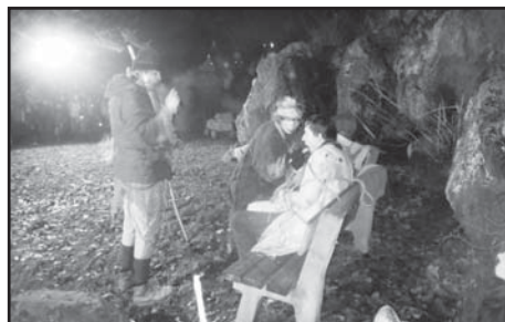
Loupežníci Stáňa a Milan okrádají chuděho pocestného.

V pátek 15. listopadu 2013 se ve Starém Plzenci na konečné busu č. 51 rozblikalo snad 100 krásných lampiónků. Ve velkém a táhlém průvodu oživovaly cestu k lomu a potom zpět ke Skalce. Každé malé i větší dítě se snažilo objevit stezku, po které se proběhl svatý Martin na bílém koni a cestou sypal sníh ze svého dřavého svatomartinského pytle. Veliké zářící vločky sněhu se občas zachytaly na větvích stromů. Ty, které dopadly na zem, bohužel roztály. Tak