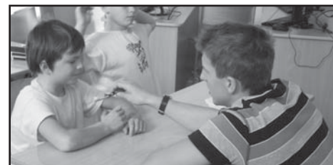
Praktická ukázka čištění zubů.