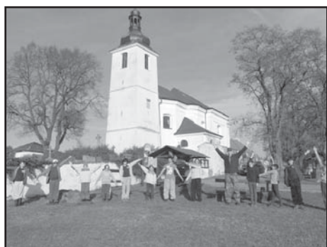
Trénování šifry semafor.

Konec října jsme s dětmi strávili na vršku u kostela v Prusinách. Celou dobu nám