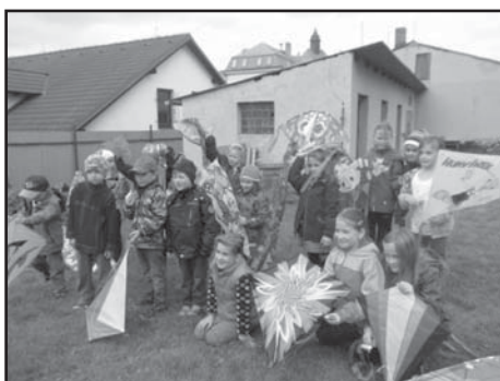
Děti ze školní družiny ve Starém Plzenci oslavily podzim pouštěním draků.