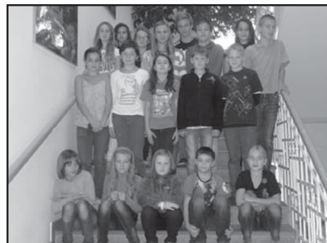
Úspěšní sportovci naší školy.

Sotva začal nový školní rok, už jsme se v hodinách TV začali připravovat na boje o