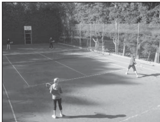
Souboje mladých tenistů.