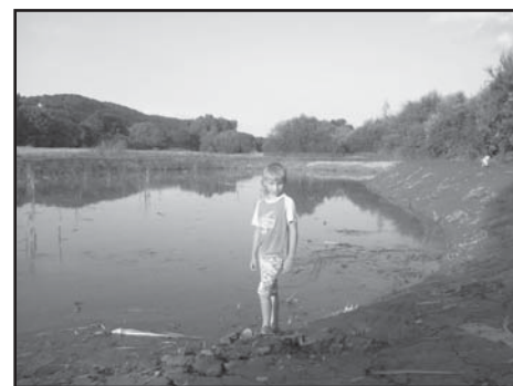
Rybník Plivátko ve Starém Plzenci je dokončen.