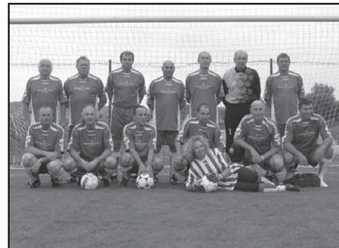
Garda na turnaji ve Zdemyslicích v roce 2012.