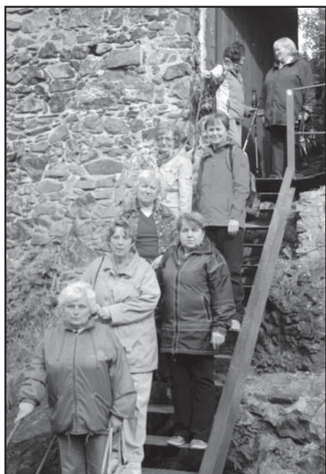
Ženy na Vlčtejně.