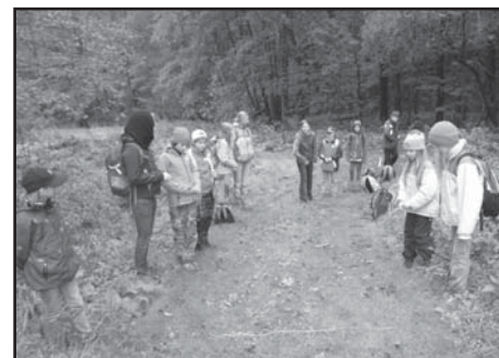
Hraní čáry.

nou komplikací, kdy nám najednou cestu zkřížila voda, takže jsme se museli vracet. Zpáteční vlak jsme ale stihli a hlavně jsme úspěšně poskládali kouzelné heslo, kterým jsme odemkli poklad. Ten neobsahoval ani žabí stehýnka, ani lektvar z babského ucha, ale předměty určené k mlsání, které jsme ovšem nemilosrdně snědli ještě dřív, než jsme dojeli zpět do našeho sídelního města. Byla to sladká tečka za vydařeným výletem do přírody a já se těším na další (sladké tečky) i výlety.