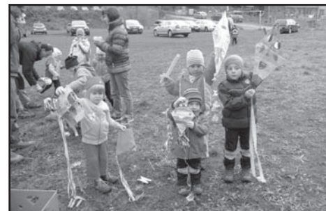
Doma vyrobení dráčeki.