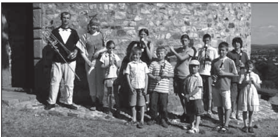
Setkání mladých flétnistů na Hůrce u rotundy sv. Petra a Pavla