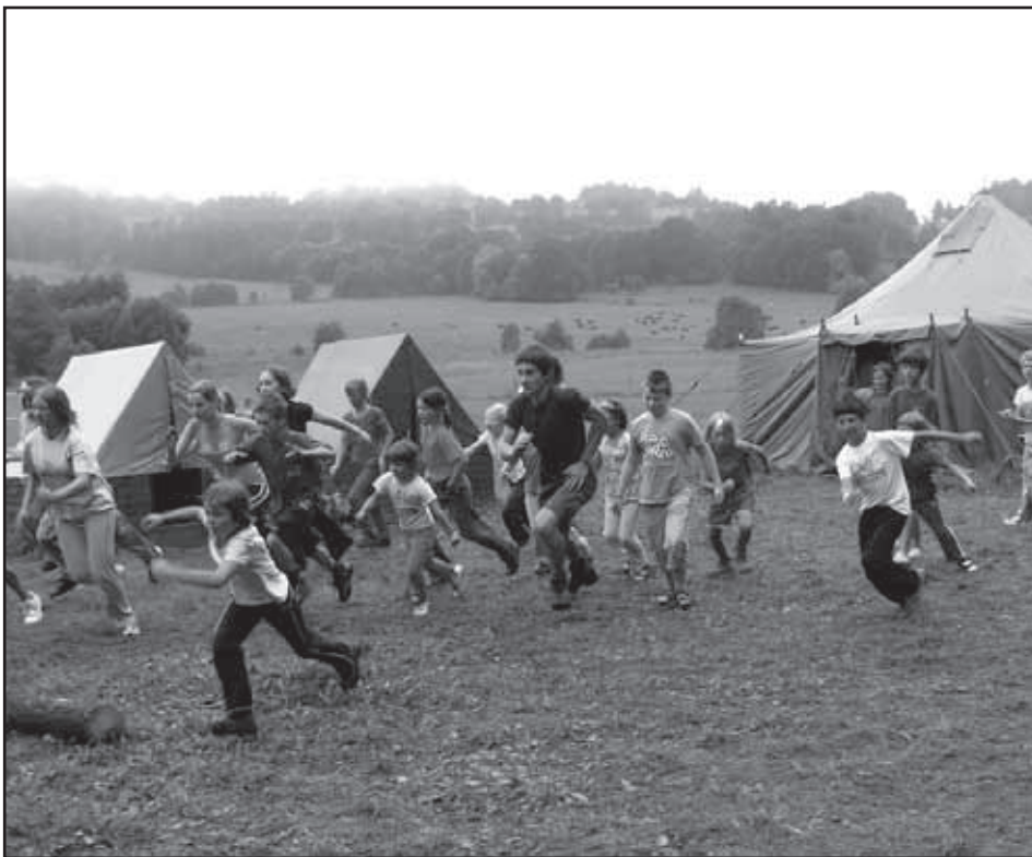
Při rozvíčce.

Rádi bychom touto cestou poděkovali všem rodičům, kteří překonali nepřízeň počasí a pomáhali nám se sklizením tábořiště.