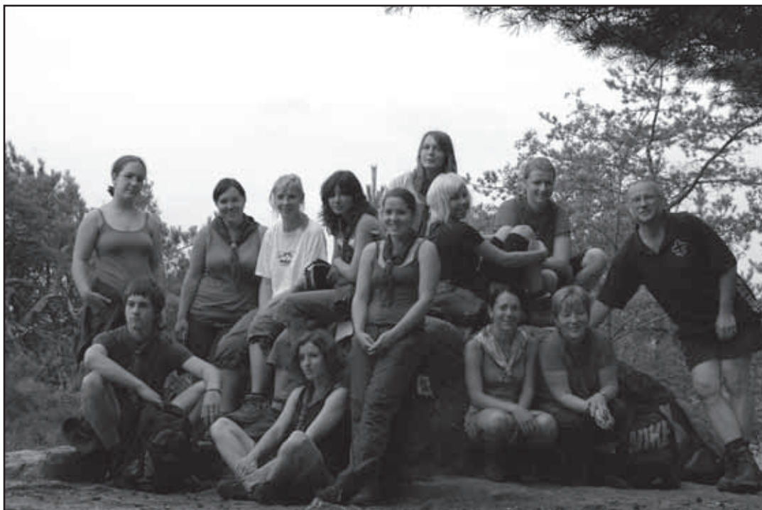
Výhlídka Ptačí kámen.