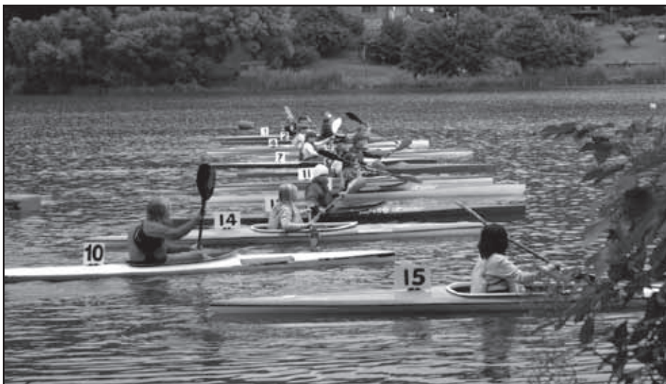
Sedlecká 500.

Jelikož Berounku jezdíme často, rozhodli jsme se letos jet i Úslavu, a to už z loďnice a pokračovat dál na Berounku. Úslava měla stav tak akorát na splutí, ale fyzicky byla náročná. Jeli jsme ji poprvé a musím uznat, že je to hezká řeka meandrující už od Sedlce až do Božkova. První přespání bylo pod Dolanským mostem, druhý den jsme se dovezli po proudu do Liblína, další noc ve Zvíkovci a konec v naší oblíbené