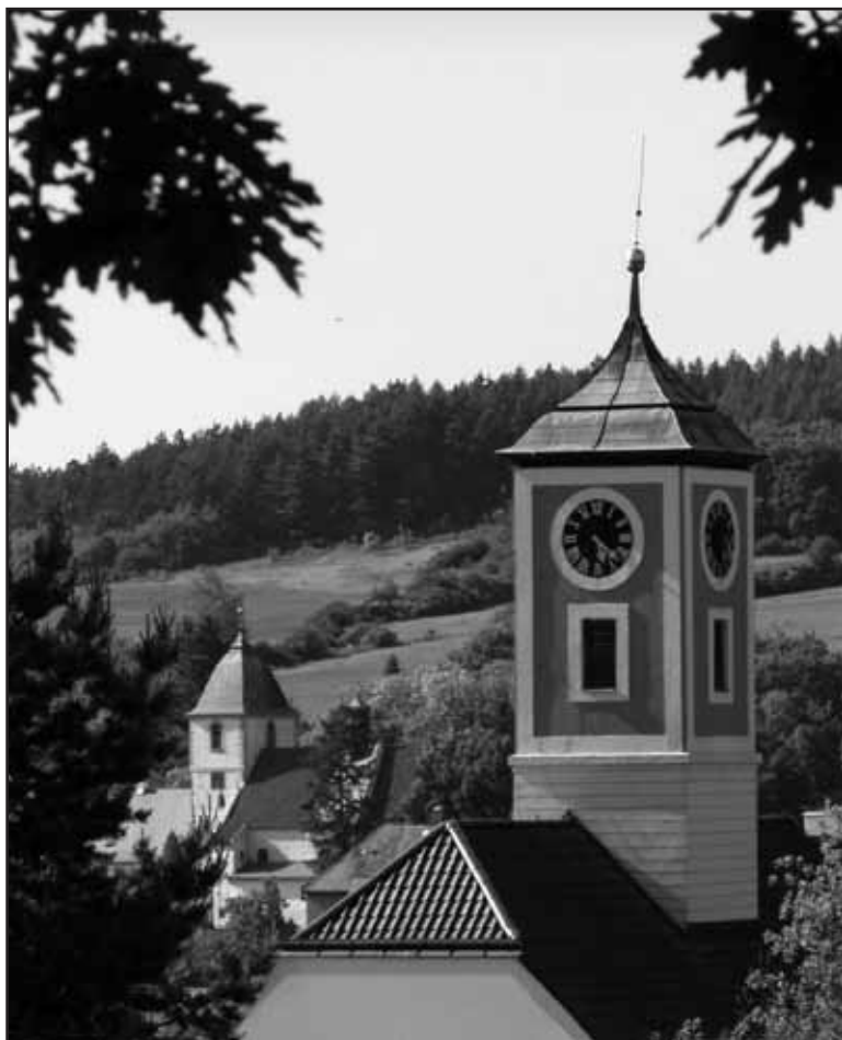
Věž radnice a kostela na Malé Straně.

☐ souhlasilo s prodejem pozemků parc. č. st. 140/10 o výměře 9 m 2 a parc. č. st. 2157 o výměře 25 m 2 v k. ú. Starý Plzenec společnosti PRONAP, s. r. o. za cenu 1.500 Kč/m 2 .