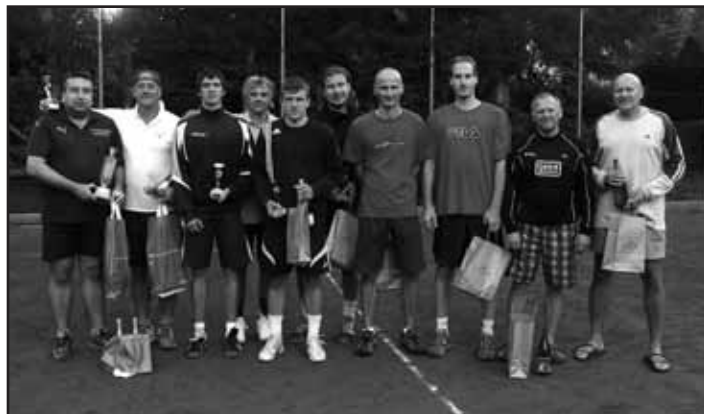
Vítězná dvojice – zleva od 1. do 5. místa.

Již páté vítězství v řadě získali tenisté z SK SPORTteam DOLI Starý Plzenec v okresní soutěži družstev Davis Cup Plzeň – jih.