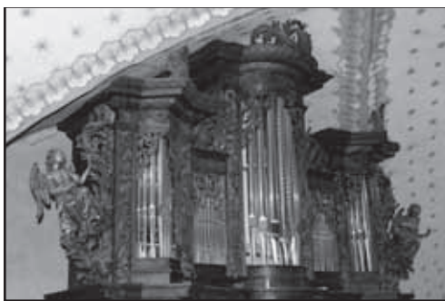
Varhany v kostele Narození Panny Marie na Malé Straně ve Starém Plzenci.

Obě umělkyně se musely při výběru repertoáru koncertu vypořádat se základním problémem – nástroj zatím totiž zůstává zvukově nedokončen. Přes velkou snahu zejména paní poslankyně Ivany