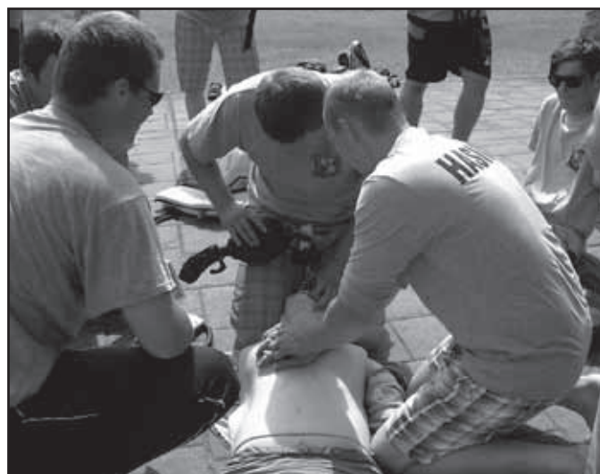
Návěk poskytnutí první pomoci.

Text: Luboš Lenc velitel jednotky SDH Starý Plzenec tel. 725 042 547