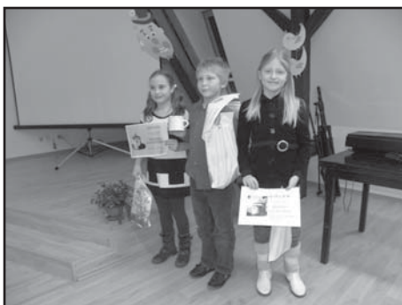
Vítězové II. kategorie.