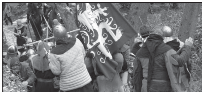
Dobývání hradu Radyně.