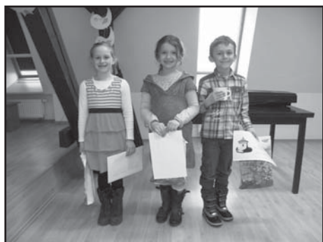
Trojice nejlepších recitátorů I. kategorie.