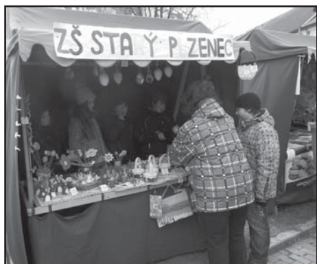
Stánek ZŠ St. Plzenec.