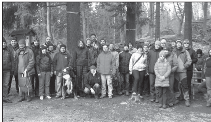
Účastníci akce CITO Radyně 2013.