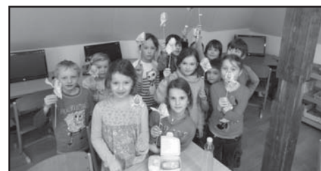
První třída se svými výrobky.