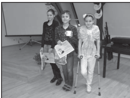
Vítězové III. kategorie.