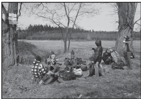
Přestávka nedaleko Svojšína.

Jak už nám název výletu napovídá, vyrazili jsme sem za strašidly. A to hlavně za účelem jim pomoci. Je to k nevíře, ale pravých nefalšovaných strašidel ubývá. Proto jsme jim vyrazili na pomoc a přišli právě