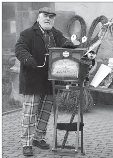
Flašinetář naladil atmosféru jarmarku na správnou notu.

Přes nepřízeň počasí se hrstka nadšenců v 8 h ráno pustila do stavění dobových stánků. Postupně se začali sjíždět prodejci a od 10 h se začalo prodávat. V sortimentu bylo pletené zboží, punčocháče, keramika, bižuterie, dřevěné výrobky, ale také výrobky dětí ze ZUŠ Starý Plzeňec, ZŠ Starý Plzeňec a OS Dráček. Ve stánku ZUŠ Starý Plzeňec malovala slečna Petra Eretová vajíčka voskem, ve stánku ZŠ Starý Plzeňec se střídaly děti po dvojicích a prodávaly