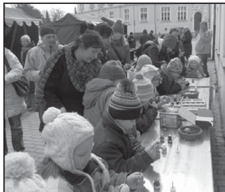
I přes chladné počasí děti rády soutěžily v malování vajíček.