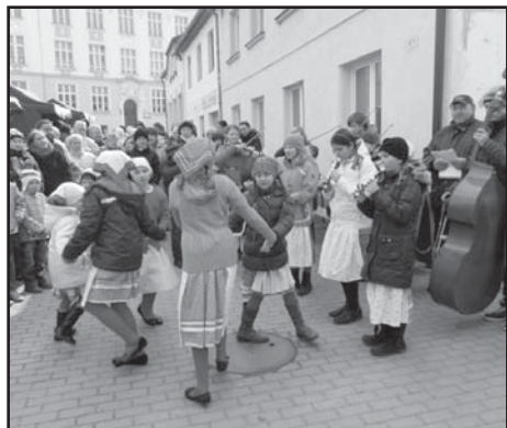
Vystoupení folklórního souboru Úslaváček.

Přes nepřízeň počasí se hrstka nadšenců v 8 h ráno pustila do stavění dobových stánků. Postupně se začali sjíždět prodejci a od 10 h se začalo prodávat. V sortimentu bylo pletené zboží, punčocháče, keramika, bižuterie, dřevěné výrobky, ale také výrobky dětí ze ZUŠ Starý Plzeňec, ZŠ Starý Plzeňec a OS Dráček. Ve stánku ZUŠ Starý Plzeňec malovala slečna Petra Eretová vajíčka voskem, ve stánku ZŠ Starý Plzeňec se střídaly děti po dvojicích a prodávaly