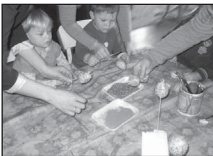
Zdobení vajíček na klubech.

V Rodinném centru Dráček jsme se na Velikonoce připravovali v rámci klubových dopolední – i ty nejmenší děti si odnesly domů vlastnoruční výrobek – polystyrenové vajíčko jako zápich mamince do květináče. Starší děti si ozdoby vyfouknuté vajíčko, které obalovaly i v obarvené rýži nebo koření, takže kromě pestrých barev vajíčka i navíc pěkně voněla. Pomlázku - malou sladkost - si každý našel pod obrázkem velikonočního zajíčka.