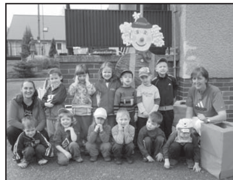
Děti s popleteným klaunem.

Již poněkolkáté navštívily Pomocné tlapky s asistenčními pejsky děti z naší mateřské školy. Cvičitel pejsků dětem ukázal, jak se pejsci k asistenci cvičí, k čemu jsou zapotřebí a jak se o taková zvířátka postarat. Děti moc dobře vědí, že postarat se o jednoho pejska není žádná legrace, natož když takových pejsků je mnohem více. Děti uspořádaly ve školce sbírku, při které vybraly neuvěřitelných 5.434 Kč a darova-