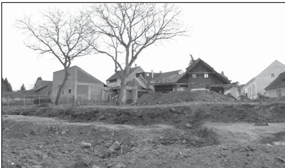
Snímek zachycuje bývalý Blochův statek v Husově ulici ve St. Plzeň. Informace o archeologickém výzkumu v lokalitě Blochova statku v Husově ulici a na místě za radnicí na Masarykově náměstí ve St. Plzeň přinesou další vydání Radyňských listů.

Přijímáme úvěrové poradce www.chceme-penize.cz