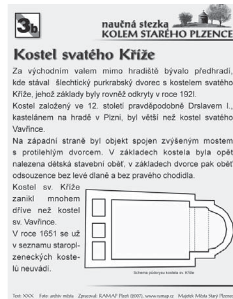
Kostel sv. Kříže – zastávka naučné stezky kolem Starého Plzence.