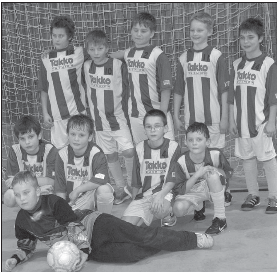
Mužstvo starší přípravy SK Starý Plzenec na turnaji v Rokycanech 17.2.2013.

Skupina B: Rokycany – Starý Plzenec 5 : 0, - Dobřív 0 : 0, - Strašice 0 : 0, Dobřív – Starý Plzenec 3 : 2, - Strašice 1 : 1, Starý Plzenec – Strašice 1 : 0.