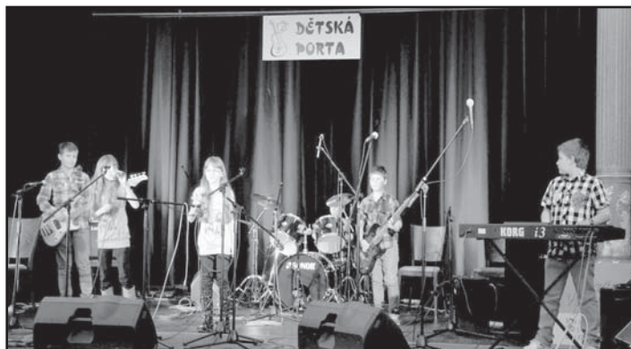
Kapela Bengál ze ZUŠ Starý Plzenec získala již podruhé na republikovém finále Dětské Porty Cenu diváka.

Ve dnech 1. a 2. února 2013 se konalo v Praze-Bohnicích „Divadlo za plotem“ již tradiční republikové finále soutěže Dětská Porta. Republikovému finále předcházela