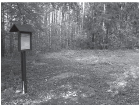
Místo na Hůrce ve Starém Plzenci, kde stával kostel sv. Kříže.

Kostel sv. Kříže byl nejmladším a největším (rozměry 12,45 m x 23,40 m) ze tří kostelů na Hůrce. S největší pravděpodobností jej dal vystavět správce (castellanus) hradiště Drslav I. (správcem hradiště byl v letech 1160-65), aby sloužil duchovním potřebám jeho rodiny. Zanikl však pravděpodobně nejdříve ze všech, už při vpádu Braniborů r. 1280. Nacházel se v předhra-