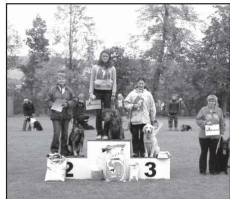
Vyhlášení vítězů kategorie ZZO.