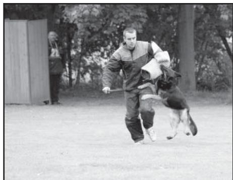
Obrana zadržení, zkouška IPO3.

Kynologická organizace ve Starém Plzenci pořádala dne 22.9.2012 další ročník Závodu pod Radyní, který má více jak 40letou tradici. Letošní ročník doprovázelo příjemné podzimní počasí a dobrá nálada. Závodu se zúčastnilo 24 závodníků ze 7 kynologických organizací – Plzeň-Bory, Křimice, Blovice, Hrádek u Rokycan, Toužim, Čechurov, Starý Plzenec. Z naší kynologické organizace jsme měli 12 zástupců. Soutěžilo se v pěti kategoriích dle národního zkušebního řádu – ZZO, ZM a ZVV1 a