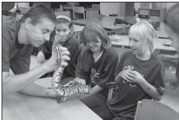
Děti si hrají s kobrou.

Každoročně se dne 4. října, na den svátku Svatého Františka z Assisi, patrona zvířat, slaví Světový den zvířat (World Animal Day). Svatý František z Assisi, světec,