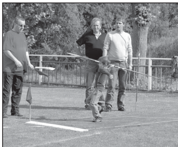
Jeden z nejmladších závodníků hází oštěpem pod dohledem Jana Železného.