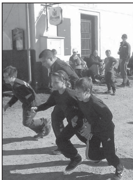
Starší žáci v soutěži vybojovali 5. místo.