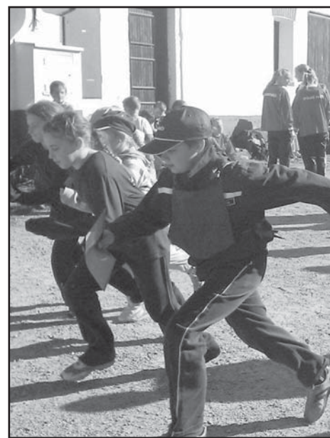
V silné konkurenci se neztratili ani mladší žáci.