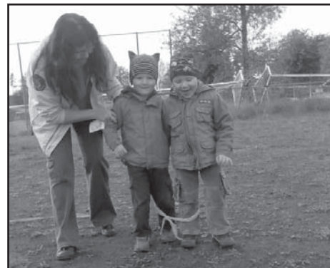
Děti na Drakiádě.