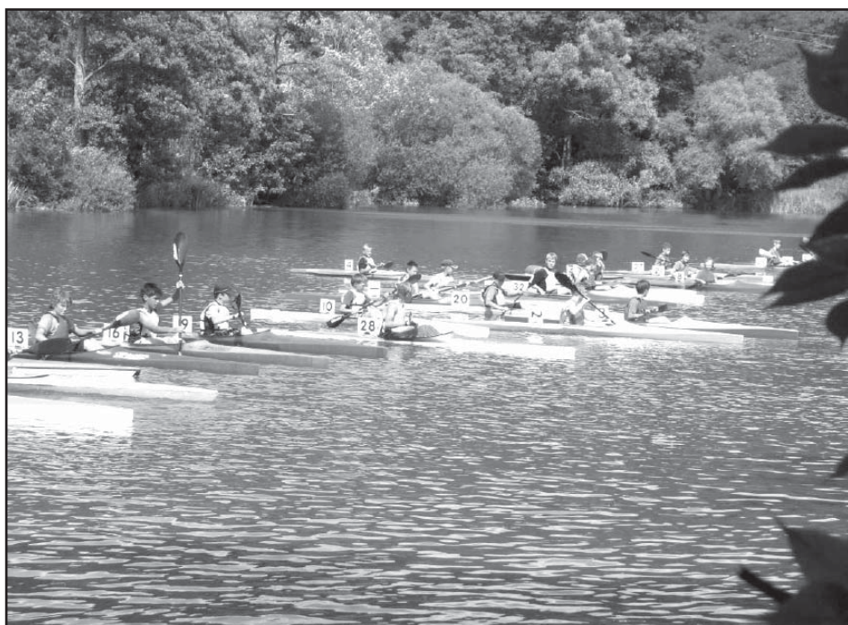
Sedlecká pětistovka – start benjamínků.

V našich akcích nás výrazně podporuje Plzeňský kraj a naše město Starý Plzenec. Tyto výsledky jsou důkazem, že investice do tohoto sportu se neztratí.