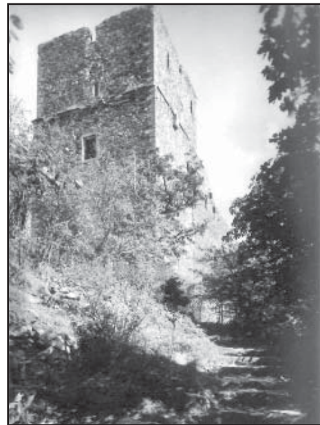
Věž hradního paláce (prvorepubliková fotografie).

6) Autor pověsti patrně nikdy na Radyni nebyl: ta totiž žádný hradní dvůr nemá a nikdy neměla – jen předhradí s hospodářskými budovami. Také je pravda, že hrad nikdy nebyl dobyt.