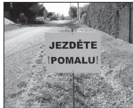
Tabule stály na svém místě jen několik dní...