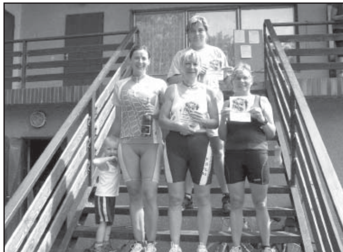
Účastnice duatlonového závodu v cíli.

Snad za rok nás bude víc, a i když nesoutěžíme o ceny, ale pro sebe, najde se pár