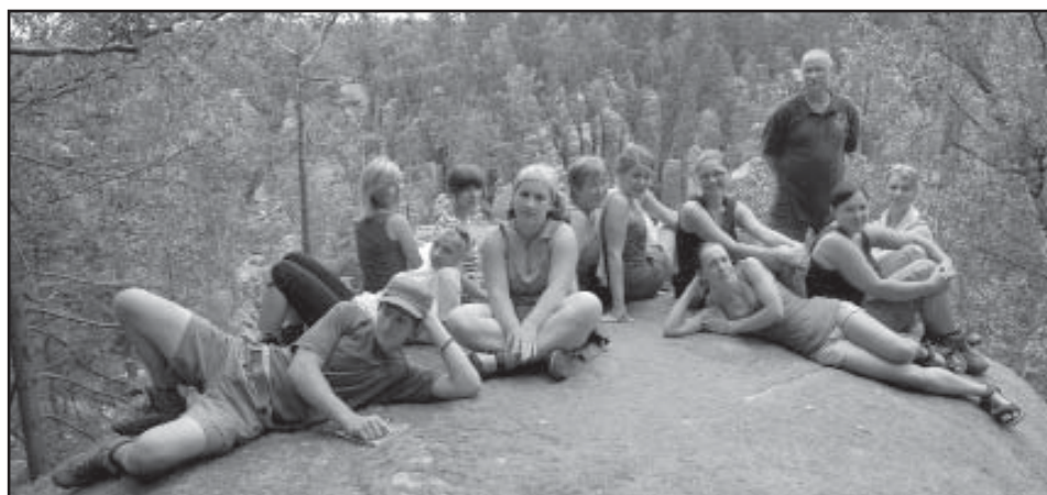
V Teplických skalách

Vážení rodiče, pokud chcete, aby i vaše dítě zažívalo nevšední zážitky a dobrodružství, přiveďte ho mezi nás. Schůzky máme každou středu mezi 16:00 h a 19:00 h nebo se podívejte na http://strela.skauting.cz/oddily .