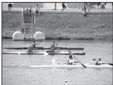
Boj o stříbro na MČR (naši č. 2).

Program závodů byl plný zajímavých soubojů o body do poháru. Od deseti hodin proběhl start každých 5 minut. Posledním, šedesátým čtvrtým startem byl nejnaplněnější závod nejmladších kajakářů. Sešlo