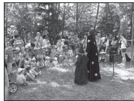
Slavnosti rodiny – vystoupení kouzelníka