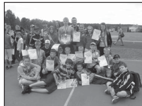
Účastníci atletických závodů.