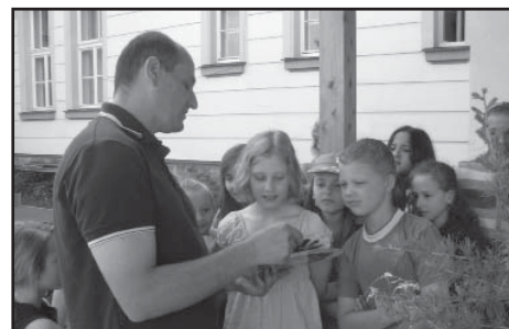
Děti ze 4. a 5. třídy v sekci garáž a zahrada pomyslného ekologického bytu.