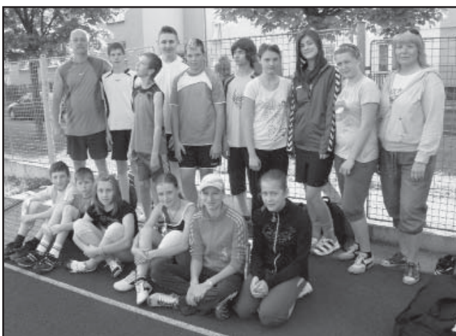
Družstvo atletek a atletů ze ZŠ Starý Plzenec.