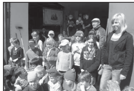
Snímkem se vracíme k návštěvě školní družiny ZŠ Starý Plzenec v Hasičském muzeu v Sedlci.