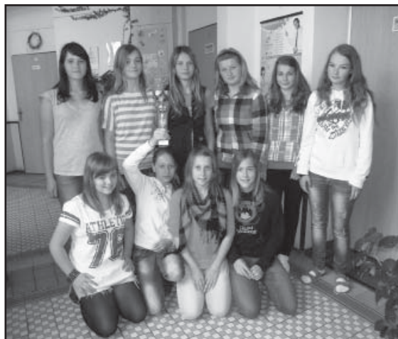
Úspěšné družstvo házenkářek.