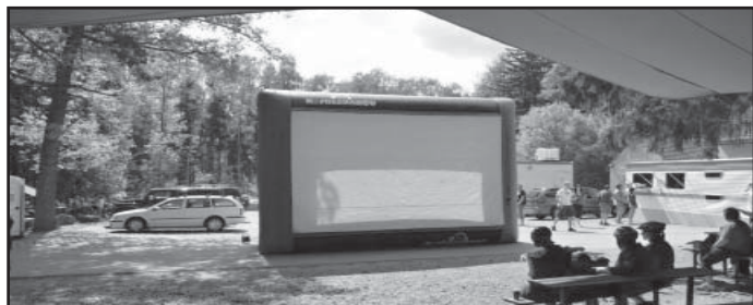
Přístřešek pro diváky s mobilním promítacím plátnem pod Radyní je připraven na Radyňský filmový festival.

Večery na Radyni budou od 1. června patřit filmu. Znamé snímky české i zahraniční produkce jako Mamma Mia, Kill Bill, Bobule nebo Vesničko má středisko-va či Vrchní prchni! má na programu letní kino pod zříceninou hradu Radyně. Diváky před nepřízní počasí ochrání přístřešek a do pozdních nočních hodin bude fungovat i občerstvení.