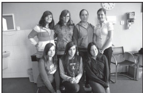
Volejbalistky obsadily v okresním kole 3. místo.