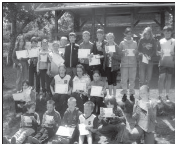
Na závěr všichni dostali diplom.