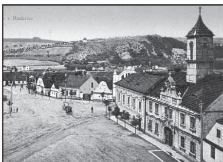
Plzeňské náměstí na historické pohlednici ze začátku 20. století

Významnou zajisté událost v dějinách svých oslavil v neděli dne 20. července 1902 starobylý Plzenec. Oslavoval povýšení své z městyse na město, událost, která má nejen pro obyvatelstvo plzeňské, ale i pro celé širé okolí velkou důležitost.