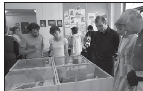
Snímkem se vracíme k vernisáži výstavy Jak se žilo ve Starém Plzenci před 110 lety.