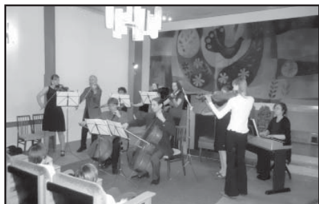
Na koncertu účinkoval také smyčcový soubor „L'estro arco“.

Dne 24. dubna 2012 se uskutečnil v obřadní síni staroplzenecké radnice další z koncertů 27. koncertní sezóny Kruhu přátel hudby. Účinkujícími byli studenti, učitelé a profesori, kteří žijí, studují či profesně působí ve Starém Plzenci. Skvělé umělecké výkony všech účinkujících odměnilo publikum bouřlivým potleskem.