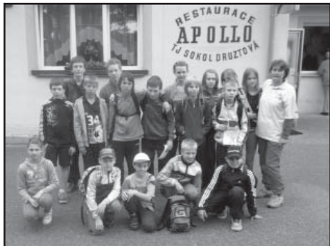
Účastníci Medvědí stezky.

Jako první proběhl koncem dubna turnaj v brännballe. Do obce Břasy se sjela celkem 4 družstva z okresů PJ, PS a RO. Naše děti nenašly přemožitele a všechny zápasy vyhrály. Tím si zajistily postup do republikového finále.