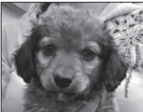
Štěňátko - pejsek – křížec zřejmě pudla a jezevčíka, stáří cca 8 týdnů.