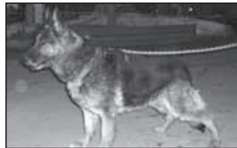
Starší fena německého ovčáka Rita – je vhodná ke hlídání.