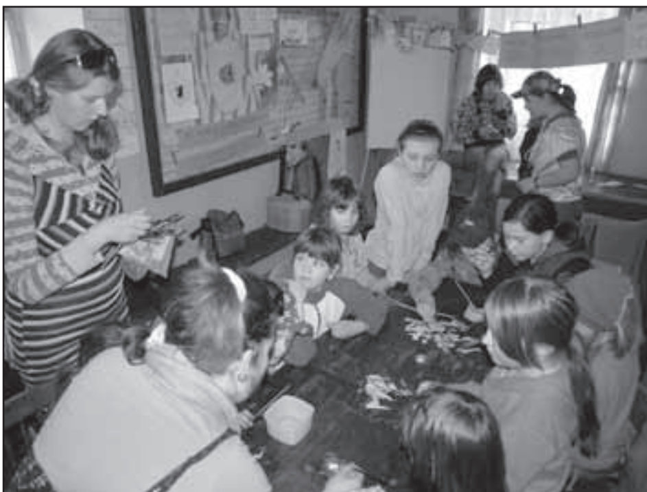
Tygřice vyrábí šperky.

O týden později jsme pro děti uspořádali dvě akce – jednu ryze pro dívky a druhou pro kluky. Holky Tygřice si užívaly zábavu při pořádání kadeřnického salonu, vyrábění šperků, tvorbě lahodného ovocného salátu, představování svých nejoblíbenějších knížek aj. Ve stejné době jsme s klučíci družinou Tygrů a s Jednapadesátkou (chlapecký oddíl z Plzně) vyrazili do lesů za Nepomukem. Při soutěžích jsme zkoušeli svůj odhad, orientaci v prostoru i schopnost udržet rovnováhu. Les se rázem proměnil v dějiště takzvaných bojovek, při kterých se zběsile běhá, kradou se vlajky,