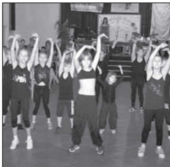
V rytmu zumby zatančily žákyně ZŠ Starý Plzenec.