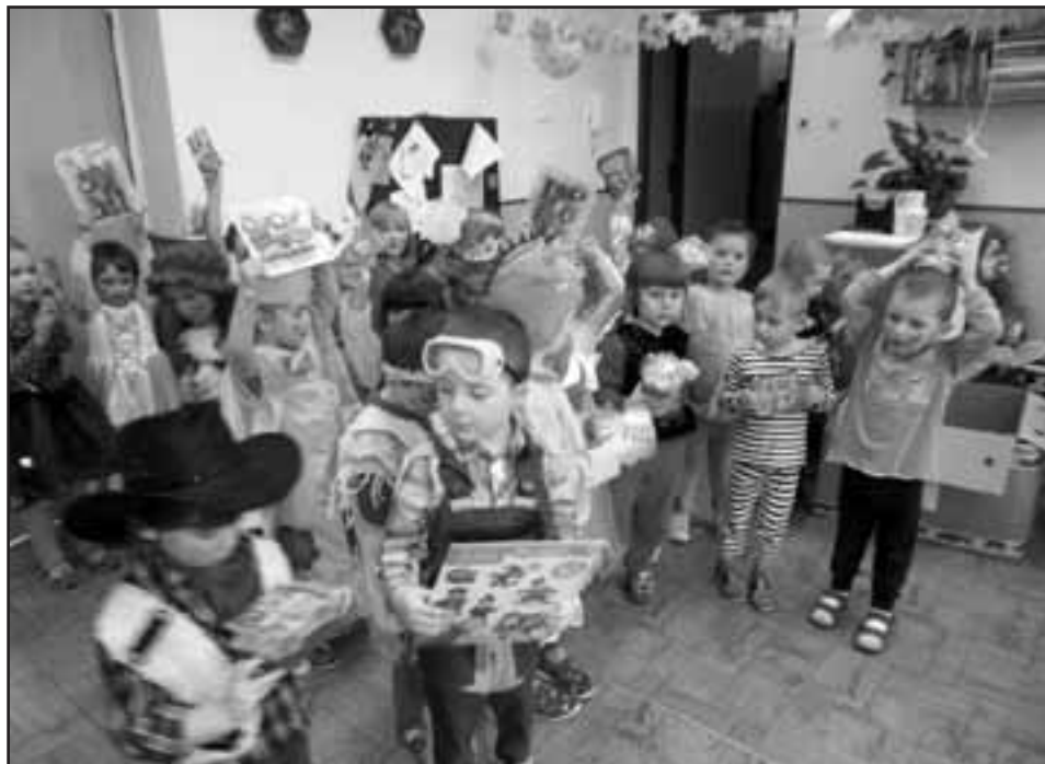
Vzpomínka na maškarní rej.