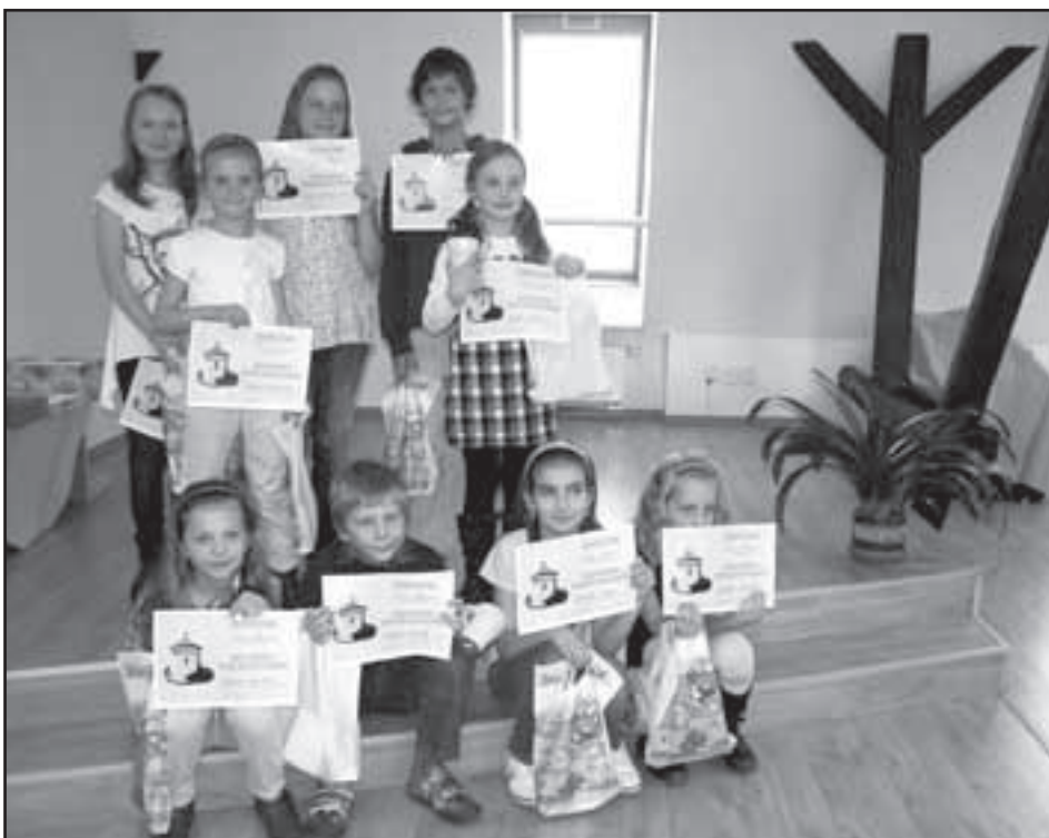
Všichni vítězové při závěrečném focení.