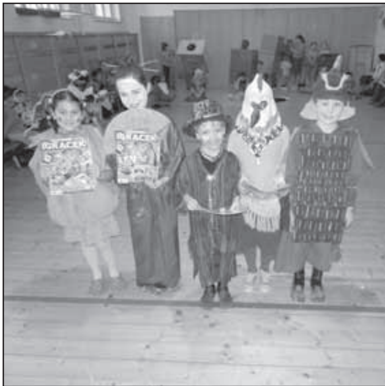
Vítězové karnevalu ZŠ Sedlec.