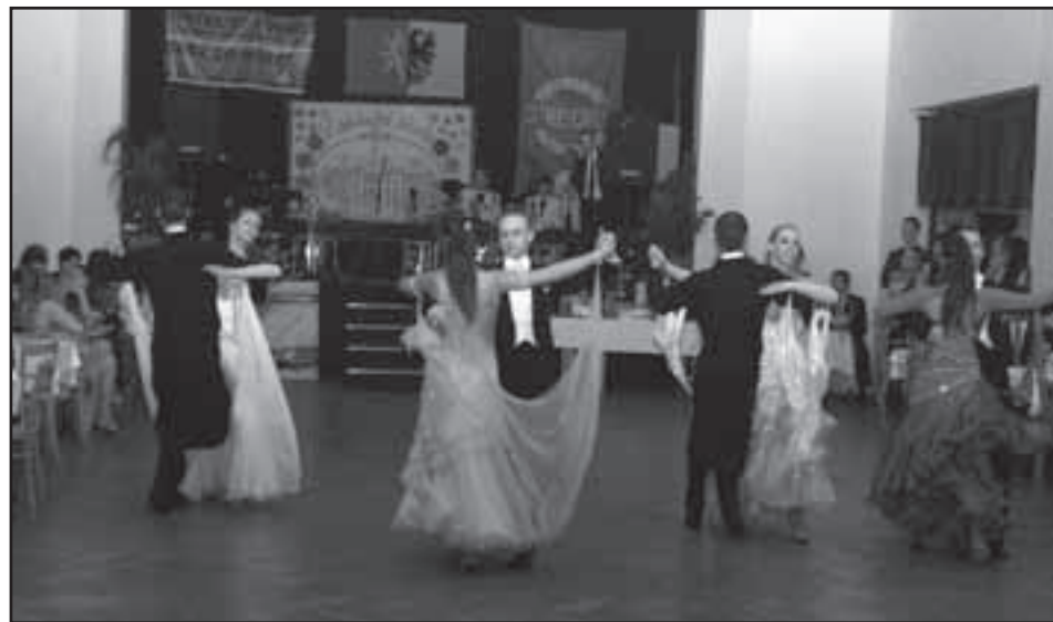
Ukázky standardních a latinskoamerických tanců předvedli členové Taneční školy Grogriades.

Michaela Šalomová, MAWI 3000, spol. s.r.o., Výtahy Plzeň – Elex, s.r.o., TOI TOI, sanitární systémy, s.r.o., Milan Jakl – výroba těstovin, STOCK Plzeň-Božkov, s.r.o., Pedikúra, masáže, neht. modeláž Alena Blažková, Karel Babka Wifi antény Elba Plzeň, Silnice Nepomuk s.r.o., Kadeřnictví Style Starý Plzenec.