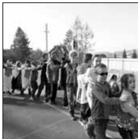
Odpoledne pokračoval karneval na zahradě školy pro děti ze školní družiny.