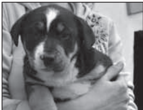
Štěňátko Kaydy a bernského salašnického psa – fenka, stáří 8 týdnů, vhodná pro někoho, kdo má velkou zahradu, vyroste z ní velký pes.