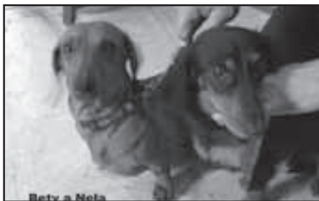
Jezevčice rezatá Bety a černá Nela.

Text a foto: Helena Šašková, odbor ŽP MěÚ