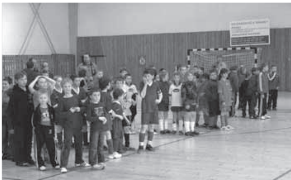
Nástup všech mužstev při vyhlášení konečných výsledků turnaje.

Házenkářská hala HK Rokycany byla 4.3.2012 dějištěm 11. ročníku Memoriálu V. Rejška ve fotbale. Turnaj byl určen žákovským starším přípravkám z Plzeňska a Rokycanska. 8 mužstev bojovalo ve dvou skupinách systémem každý s každým. Skupina „A“: Dobřív porazil Černice 1 : 0, Strašice 2 : 0 a remizoval se Starým Plzencem 0 : 0. Spolu s ním postoupily do semifinále Strašice, když porazily Černice 5 : 0 a 0 : 0 hrály se Starým Plzencem. Poslední duel skupiny mezi Starým Plzencem a Černicemi skončil 0 : 0. Skupina „B“: Štěnovice vyhrály 1 : 0 s Mýtem, 3 : 0 s Letnou a remizovaly 0 : 0 s Losinou. Mýto porazilo 1 : 0 Losinou a 2 : 0 Letnou a též postoupilo do semifinále. Losiná pak zvítězila 1 : 0 nad Letnou. V semifinále porazily Štěnovice Strašice 3 : 0 a Mýto Dobřív až na penalty (zápas skončil 0 : 0). V boji o 7. místo pak porazila Letná Černice 1 : 0. Pátá skončila Losiná, která po nerozhodném výsledku 0 : 0 se Starým Plzencem zvítězila