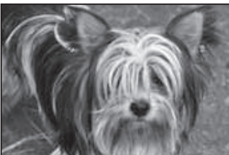
Křížec silkyteriéra Fido – je velice chytrý, veselý a roztomilý uličník.