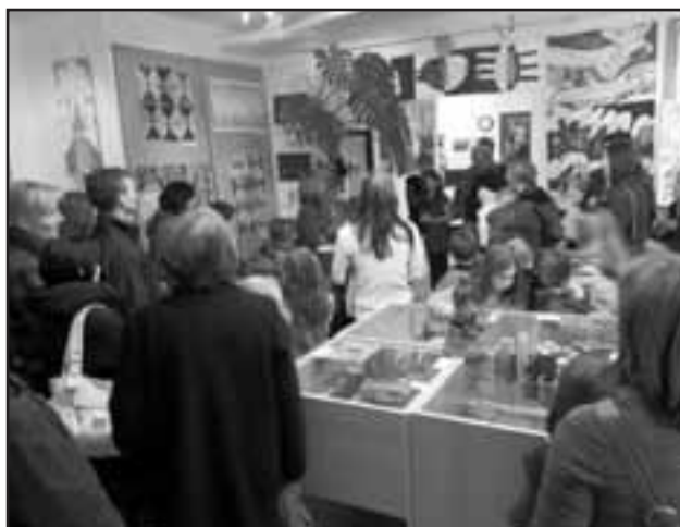
Snímek se vracíme k vernisáži výstavy výtvarných prací žáků Základní umělecké školy Starý Plzenec ve Staroplzenecké galerii.