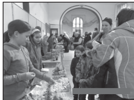
Vánoční trhy.