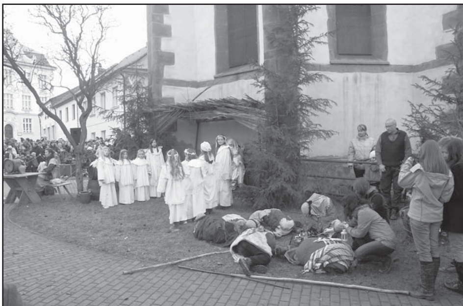
Letos se již po dvacáté konalo u kostela sv. Jana Křtitele divadelní představení Živý betlém.

Na Štědrý den odpoledne se již po dvacáté tradičně u kostela sv. Jana Křtitele na náměstí ve Starém Plzenci konalo představení Živý betlém. Příběh o narození Ježíška, který zahráli plzeňské děti a další dobrovolníci, zhlédla spousta diváků. Náměstím se rozléhaly koledy, které spolu s účinkujícími dětmi zpívali i ostatní lidé. Po skončení představení si odtud lidé do svých domovů odnášeli betlémské světlo.