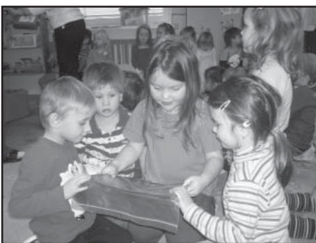
Vánoční nadílka potěšila všechny děti.

Po roce Vánoce, Vánoce přicházejí... Tak na tyto krásné vánoční písně si budeme muset zase nějaký ten čas počkat. Ale posuďte sami, další nezapomenutelné zážitky z nejkrásnějších svátků v roce stály za to. Předvánoční shon vystřídala klidná atmosféra Vánoc. Rozzářená dětská očička u vánočního stromčku byla snad tou největší odměnou pro rodiče. A nebylo tomu