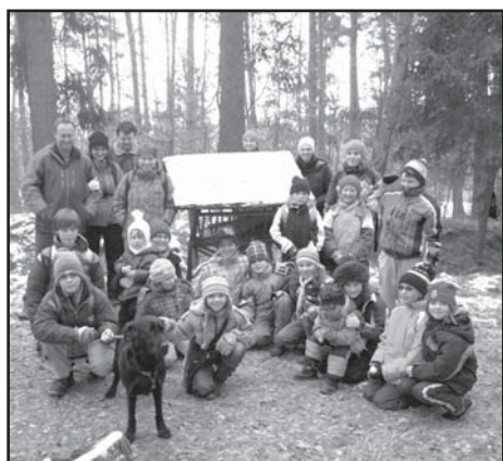
S rodiči u krmelce.