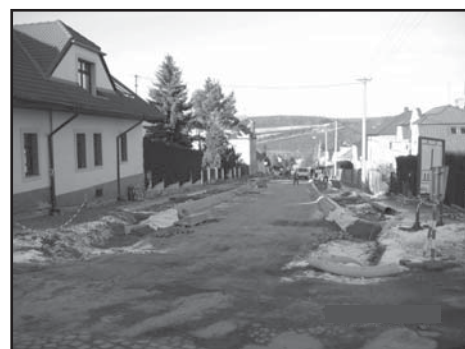
Rekonstrukce Radyňské ulice je v plném proudu.