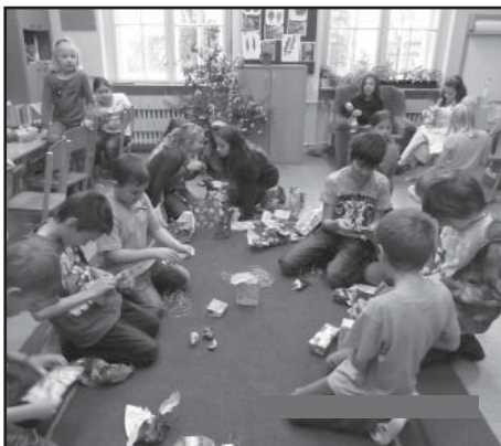
Nadílky ve třídách.