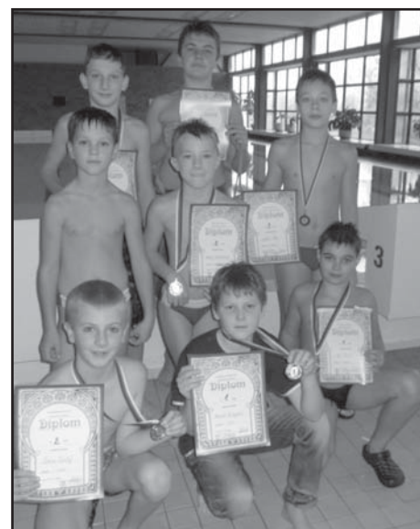
Účastníci závodu v plavání.