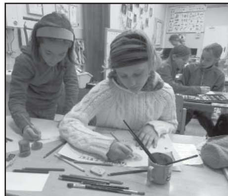
Vánoční tvoření.