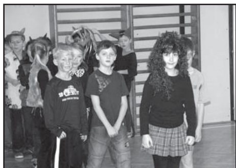
Skupina malých čertů ze 2.A.