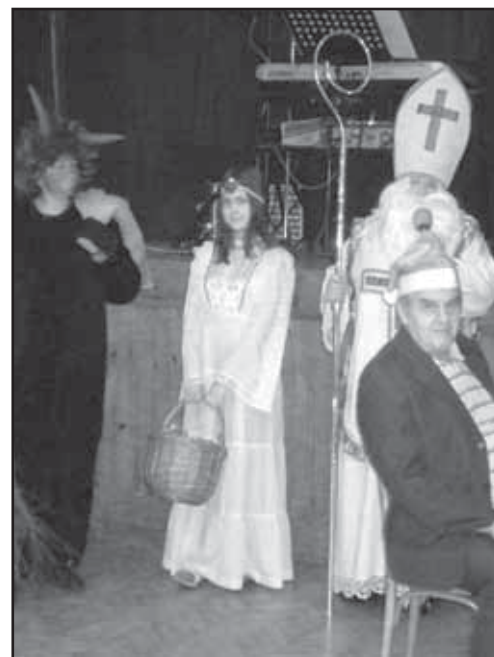
Mikulášská zábava ve Chválenicích se zdařila.

Za výbor OSZP Staroplzenecko Jaroslava Patočková