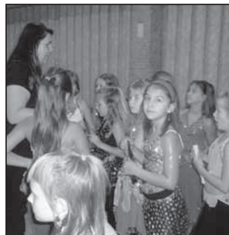
Bříšňi tanečnice ze Starého Plzece si na soutěži Orient Junior show vedly dobře.