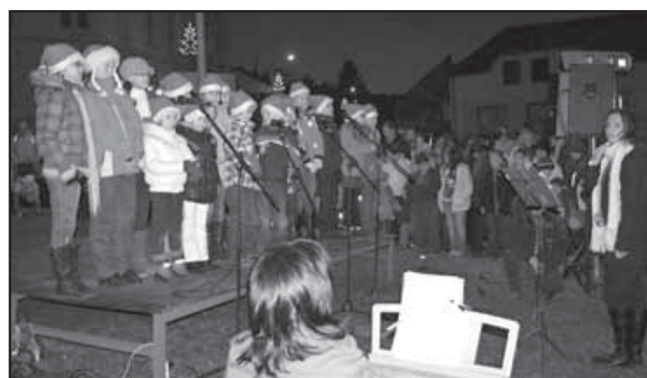
Pod vánočním stromem zazněly vánoční koledy a písně v podání dětského pěveckého sboru plzenecké ZUŠ.