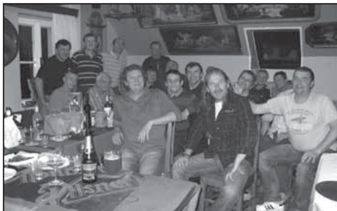
Stará garda plzeňských fotbalistů.