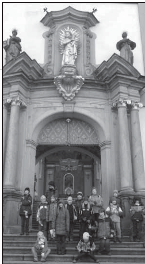
Na Svaté Hoře.