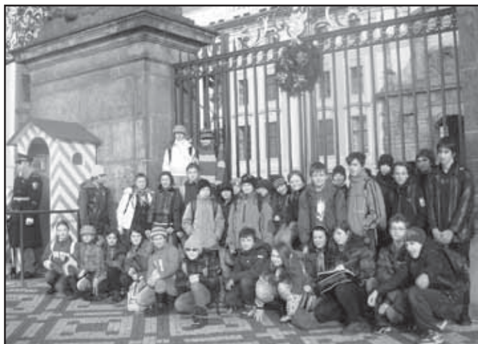
Před Pražským hradem.