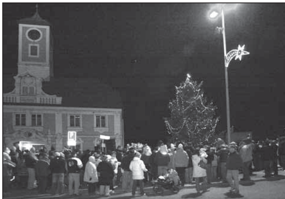
U vánočního stromu se sešly stovky lidí.