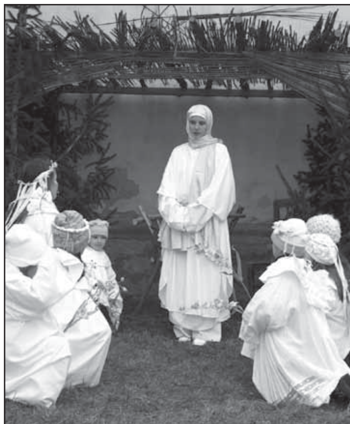
Příběh o narození Ježíška se odehrál tradičně na Štědrý den.