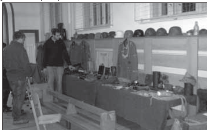
Snímek se vracíme k vojenské historické výstavě, která se uskutečnila ve školní tělocvičně ZŠ Sedlec.