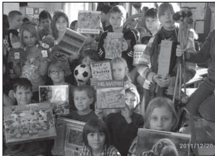
Děti se svými dárky.