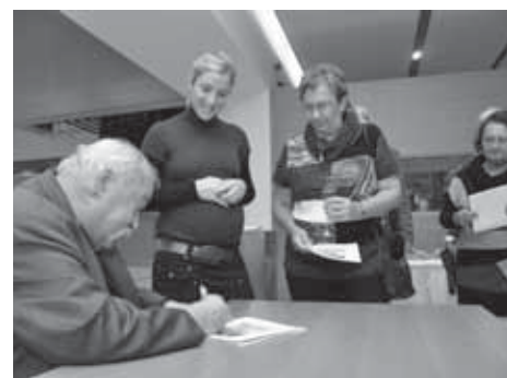
O podpis významného výtvarníka byl velký zájem.