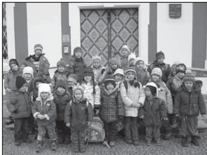
Děti ze sedlečské školky před Muzeem v Mariánské Týnici.

Hodně zdraví a štěstí všem v roce 2012 přejí děti a učitelé z MŠ Sedlec.