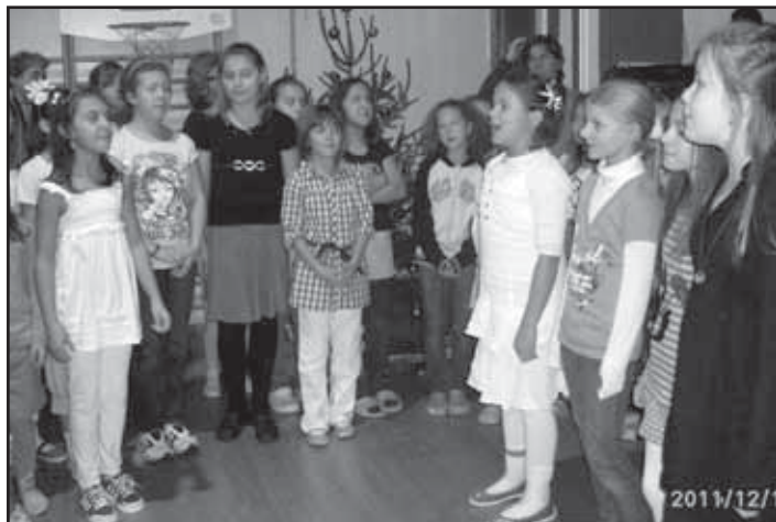
Závěrečné zpívání koled dětí ZŠ.

Ve středu 14.12. se v naší tělocvičně konal prodejní trh spojený s výstavkou domácího vánočního cukroví. Vývrcholem bylo pásmo koled, které jsme s dětmi pro rodiče navštívili. Děkujeme za