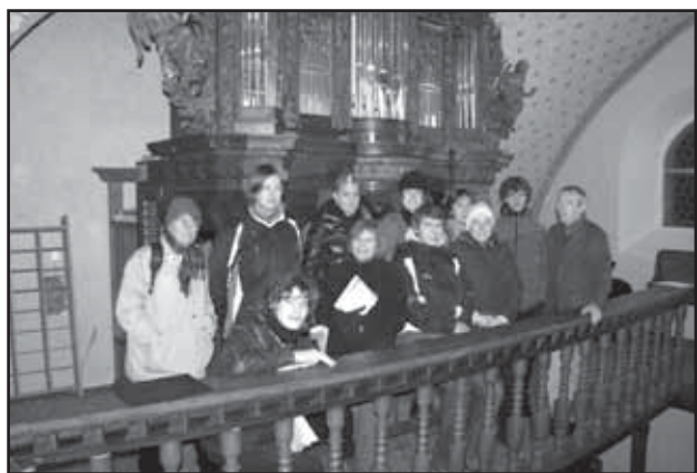
Žáci se svými učiteli před staroplnzeckými varhanami.

Milovníky varhanní hry jistě nepřekvapí skutečnost, že každé varhany jsou zcela originálním dílem. Jednotlivé nástroje se