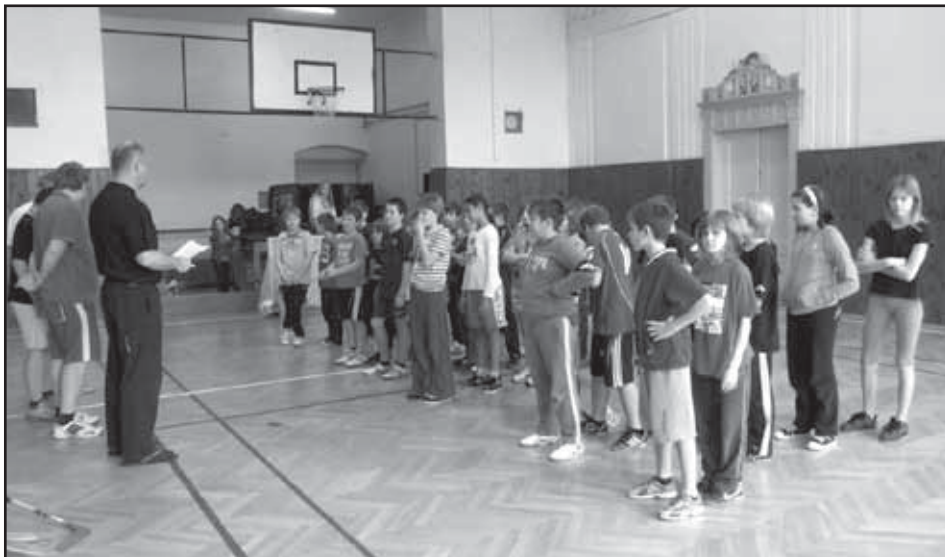
Účastníci školního turnaje ve florbalu.