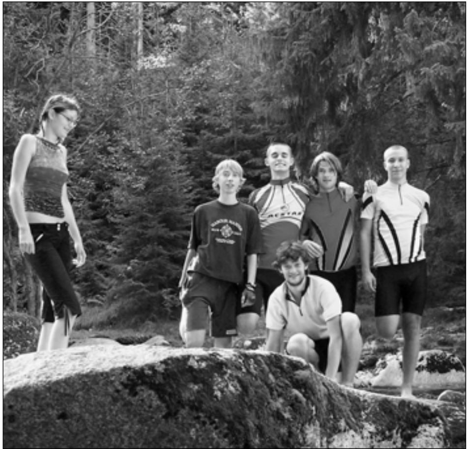
Výlet na Kašperk, Poledník nebo projížďky kolem Vydry byly nezapomenutelným zážitkem.