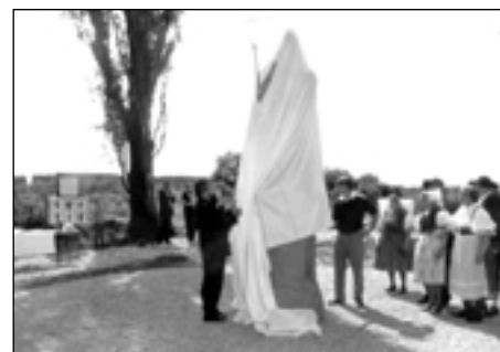
Slavnostní odhalení v květnu roku 2005.