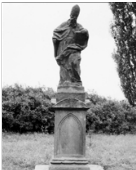
Socha sv. Blažej na místě bývalého kostela ve Starém Plzeňci po restaurování v roce 1976 ak. soch. Janem Bradnou.

Naším posledním zastavením na naučné stezce okolo Starého Plzeňce bude háj sv. Blažej, který se nachází v blízkosti železniční tratě Plzeň – České Budějovice. Socha sv. Blažej, která dnes stojí na místě původního kostela, je ukryta v kruhu několika mohutných topolů, takže místo je zároveň velice nápadné pro všechny, kteří přijíždějí do města vlakem od Plzně. Opticky tvoří sv. Blažej vrchol rovnoramenného trojúhelníku, jehož základnou jsou kostel sv. Jana Křtitele na náměstí a rotunda sv. Petra na Hůrce.