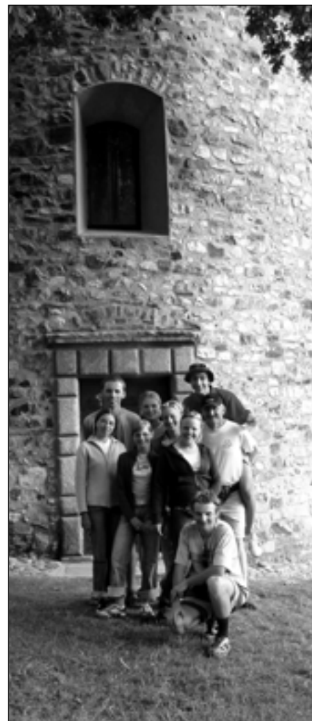
Mladí Poláci budou mít za sebou 1704 km z Polska napříč ČR do Německa a zpět.