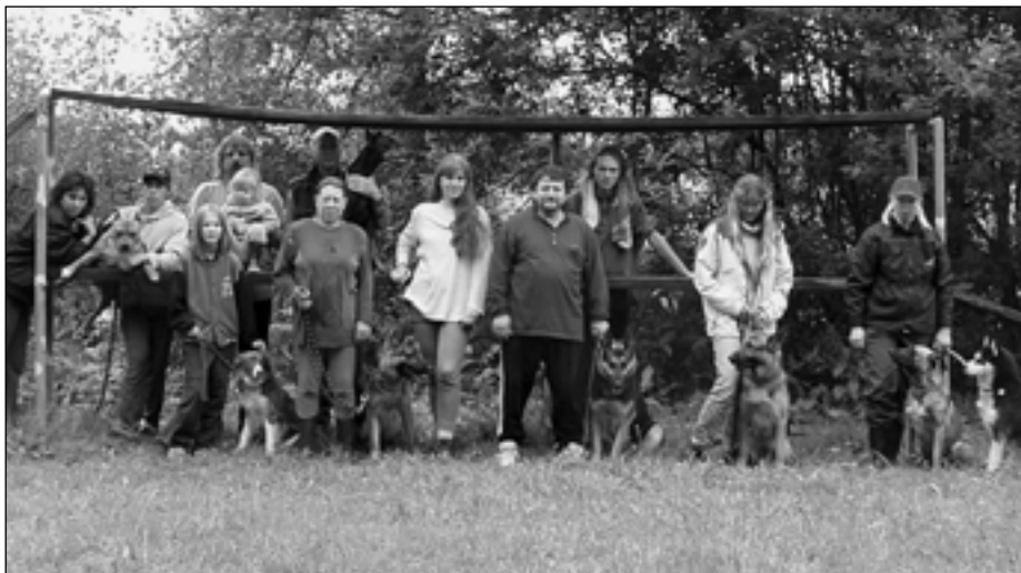
Účastníci tábora se svými psy.