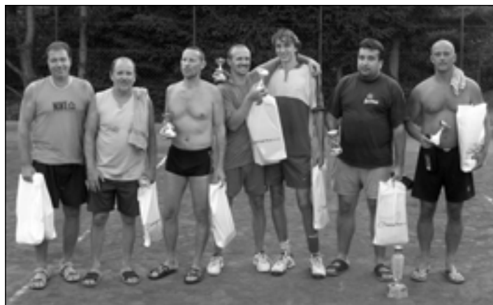
Vítězná dvojice je zcela vpravo.