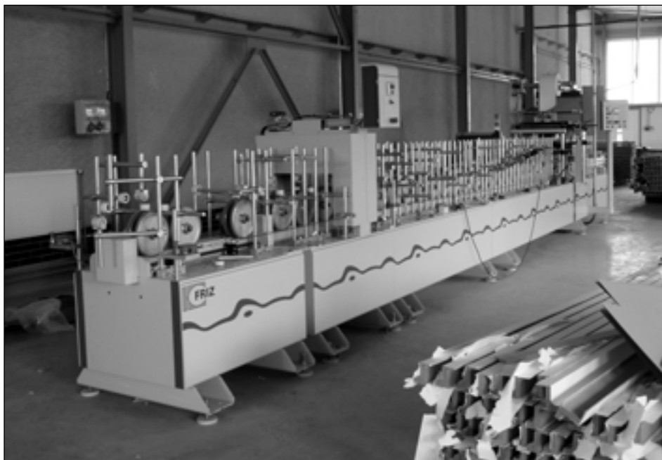
Montáž nové linky započala v srpnu.

„Již přes jeden a půl roku máme navázanou spolupráci se švýcarskou firmou a dosavadní obalovačka tuto kooperaci omezovala“, říká dále ředitel Sokol. „Nová linka navíc pracuje s daleko vyšší produktivitou, čímž zvyšujeme přidanou hodnotu i konkurenceschopnost našich výrobků“, pokračuje. „Rozkládáme obchodní riziko i do dalších oborů: začínali jsme se zásuvkami, obalovanými profily a sesaz-