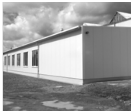
Společnost rozšířila výrobní prostory o dalších 540 m 2 .

Číslo účtu veřejné sbírky na hrad Radyni 30015-725643329/0800 Stav konta 97.960,- Kč