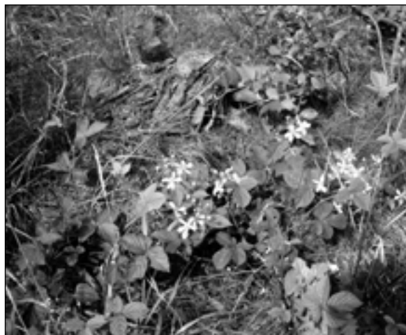
V borovicovém mlázi najdeme maliníky, ostružiníky, třtinu rákosovitou a další druhy.

Žijí tu běžné lesní druhy, objevují se druhy kulturní krajiny. Menší