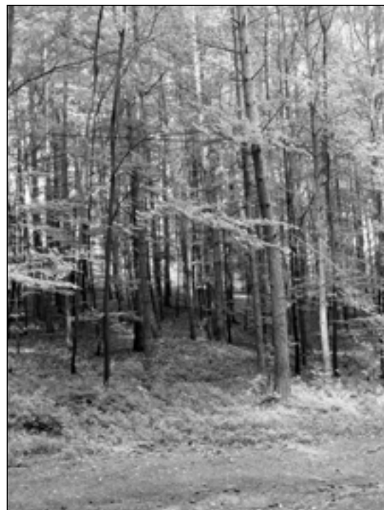
Vystupující balvany prozrazují obtížné zalesňovací podmínky.

ptáci přilétají pít ke kalužím v prohlubních skalek. Z brouků byl nalezen vzácnější nosatec ( Anthonomus conspersus ).