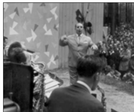
Archivní snímky – z vystoupení Orchestru Karla Vlacha