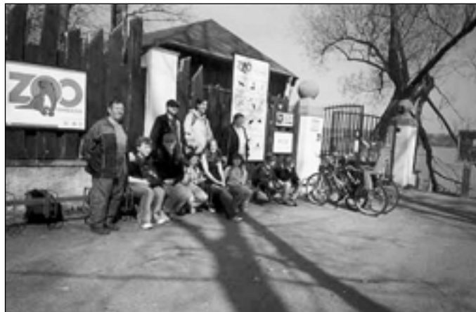
Před vstupem do ZOO Ohrada

Miláčky dětí se staly malé holandské kozy, ke kterým mohly do výběhu, pohladit je a krmit. Vydry mohly pozorovat pouze přes sklo, ale i tak to byla úžasná podívaná a poučení.