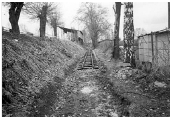
Prodloužení plzeňské trati – archivní snímek z výstavby.