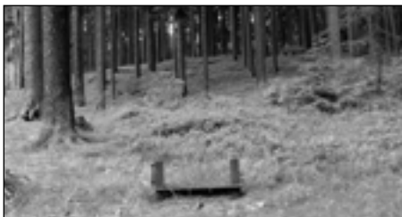
Již několik let na tomto místě chybí tabule zastávky č. 7.

Dnes je jeho hospodářské využívání podřízeno potřebám plnění dalších funkcí, převážně ekonomických. Účelovost, která musí být přednostně zajišťována, je tu ale dána zejména rekreační funkcí zdejších lesů a dále pak mimořádně nepříznivými stanovištními podmínkami místy balvanitého a svažitého terénu.