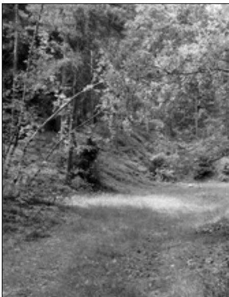
Kotlík – jedna z kruhových maloplošných pasek.

se stavbou hradu Radyně došlo s velkou pravděpodobností k jednoduše výtěžnému způsobu využívání lesů k účelům stavebním, na palivo a v těchto místech možná i obranným. Je pochopitelné, že lesní hospodářství, jako výrobce suroviny, vždy vycházelo a vychází vstřícně požadavkům dobového využití.