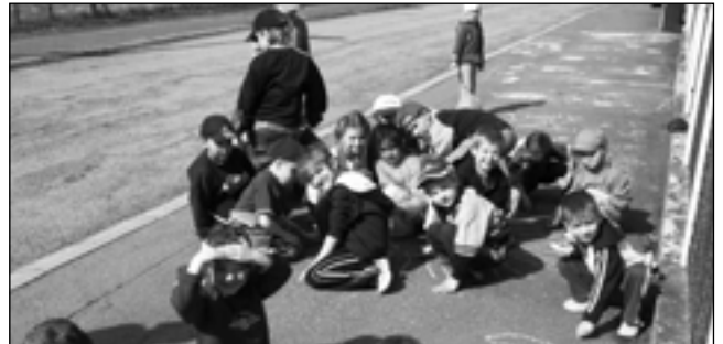
Ke Dni Země děti vymalovaly chodník těmi nejživějšími barvami, a ani déšť, který přišel druhý den, nedokázal smýt tu krásu.