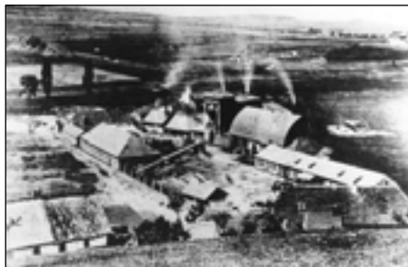
Areal továrny v roce 1870.