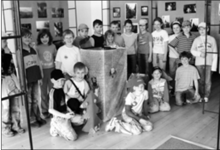
Ve velké školní družině budou netrpělivě čekat na výsledky soutěže „Hurá braši...“