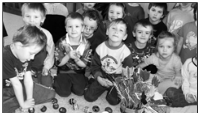
Zdobení velikonočních vajíček bylo nádhernou hrou, každé vajíčko bylo docela jiné, žádné se jinému nepodobovalo.