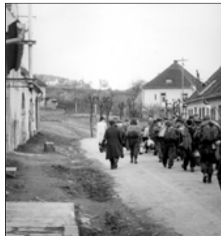
Takto odcházeli v květnu 1945 „národní hosté – Němci“ ze Starého Plzně.