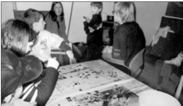
Oddíl Radyňáci se na schůzce v březnu schoval před nepřízní počasí v klubovně. Dlouhou chvíli jim krátilo skládání puzzlí se ZOO tematikou.