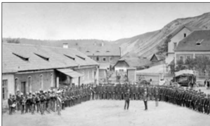
Továrna byla nejen jediným živitelem všech sedleckých občanů, ale na jejím dvoře se odehrávaly i takové události, jakou bylo například rukování branců.

První byla za výtahovou věží, zvanou „kychtou“. Ta stojí i v závodě dodnes a je chráněnou technickou památkou. Druhá pec stála o něco dál. Spojeny byly dřevěným mostem, po němž se dopravoval materiál do výtahové věže. Obě vysoké pece zde byly v provozu až do roku 1878.