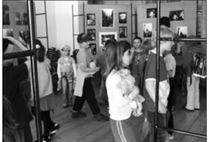
Školáci z 1. stupně ZŠ nezapomenou přijít na žádnou výstavu, která se uskuteční ve Staroplzenecké galerii.