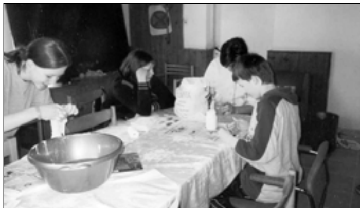
Za kamny v klubovně museli zůstat i v dubnu. Nezaháleli a vyráběli vázičky.