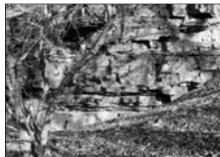
Důkaz toho, že Starý Plzeňec byl kdysi mořským dnem.

Geologický substrát lokality tvoří černošedé jílovité břidlice a slídnaté pískovce středního ordoviku. V západní části vytvářejí pískovce a jílovité břidlice skalky, ve vyšší části jsou ve skalkách zastoupeny pískovce. Toto souvrství obsahuje četné zkameněliny, zvl. v břidlicích. Vyskytují se zde převážně trilobiti, konulárie, ostnokožci, plži a další skupiny.