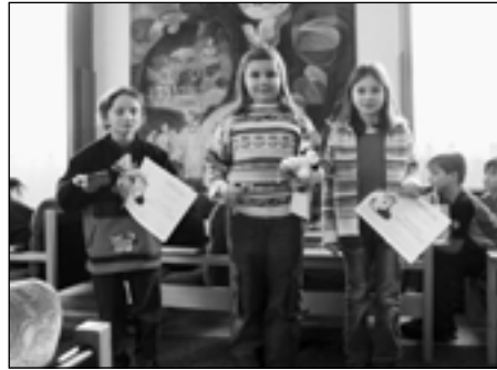
Vítězové II. kategorie.