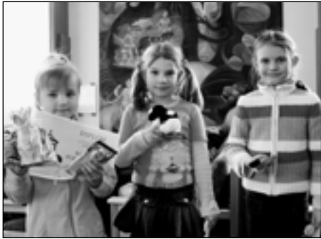
Vítězové I. kategorie.