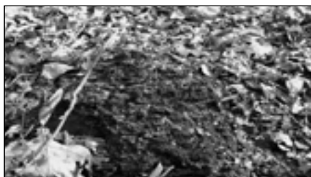
Drobné úlomky břidlice daly stráni jméno.

Geologický substrát lokality tvoří černošedé jílovité břidlice a slídnaté pískovce středního ordoviku. V západní části vytvářejí pískovce a jílovité břidlice skalky, ve vyšší části jsou ve skalkách zastoupeny pískovce. Toto souvrství obsahuje četné zkameněliny, zvl. v břidlicích. Vyskytují se zde převážně trilobiti, konulárie, ostnokožci, plži a další skupiny.