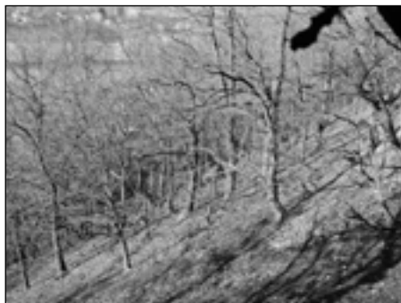
Úhel sklonu svahu Černé stráně způsobuje neustálé drolení a splavování jejího povrchu.

v prostoru středních Čech. Starší prvohory (kambrium a ordovik) překrývají algonkium v protáhlém území elipsovitého tvaru mezi Brandýsem nad Labem a Starým Plzeňcem. Severní okolí Plzeňce je nejzápadnějším územím v Čechách, kde jsou zachovány přírodní odkryvy ordovických vrstev barrandienských starších prvohor. Nejvýznamnějším zdejším přírodním odkryvem je Černá stráň a její okolí, a to jak svojí rozlohou, tak především bohatstvím zkamenělin. S ohledem na jedinečnost a přírodovědeckou hodnotu je proto chráněna podle zákona č. 114/1992 Sb. o ochraně přírody a krajiny, jako přírodní památka Černá stráň.