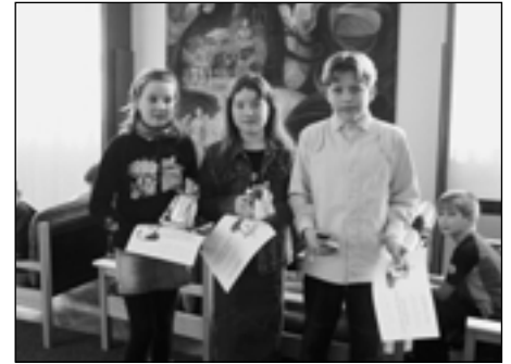
Vítězové III. kategorie.