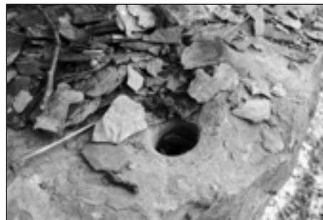
Sběrači zkamenělin přestupují zákon a jejich počínání je trestné!

Zoologickou pozoruhodností území je nález tesáříka Phymatodes rufipes , který se vyskytuje pouze v teplomilných doubravách.