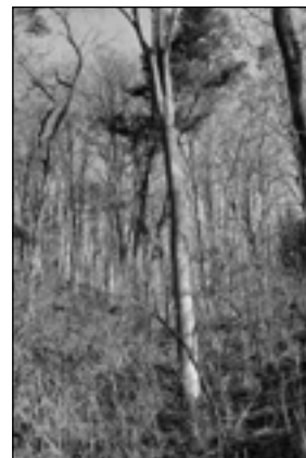
Vedle divoce rostoucích keřů a náletových dřevin zde vegetují stromy, které byly vysazeny ve 20. letech minulého století.

V území se dále usídlilo společenstvo s dominantním a cizím akátem ( Robinia pseudoacacia ). Tento strom, původem ze střední a východní části severní Ameriky, zde dokázal vyhubit téměř veškerou dřívější vegetaci bylinného patra; navíc jeho listový opad nevytváří humus.