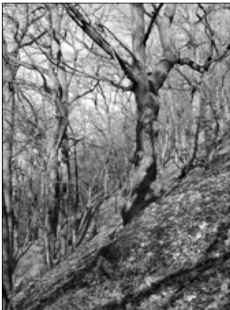
Až neuvěřitelné bizarní kořenové kreace vytváří litité akáty.

V bylinném patře stráně se nacházejí např. zběhovce ženevský ( Ajuga genevensis ),