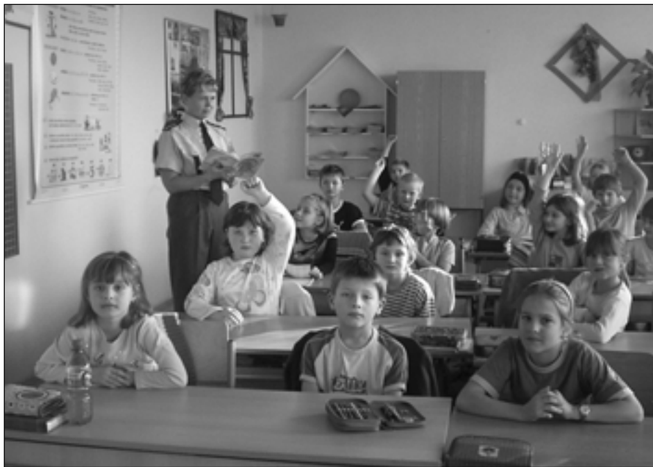
Přednáška ze dne 1. 2. 2006 na ZŠ ve Starém Plzenci.