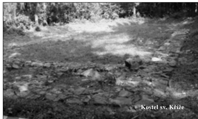
Kostel sv. Kříže

Můžeme se domnívat, že šlo o soukromý tribunový kostel Drslaviců, neboť v letech 1192-1238 byl zde kastelánem Břetislav, jehož otec Děpold tento rod založil.