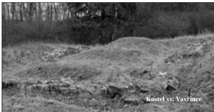
Kostel sv. Vavřince

Při výkopech v letech 1919-20 se našel pouze zbytek podélné lodi pod mladší stavbou gotického kostela ze 13. století a dlaždice z něj s nápisem NERO, stejně jako z kostela sv. Vavřince na Vyšehradě. Neronovi, jako symbolu všech křivd, utrpěných prvními křesťany, bylo nyní alespoň symbolicky opláceno tím, že po jeho obrazu věřící šlapali. Tyto dlaždice se střídaly ve sv. Vavřinci ještě se dvěma dalšími typy. Kostel byl patrně založen knížetem Vratislavem, který přinesl r. 1074 ostatky sv. Vavřince do Čech. Dlažbu mohl dostat později, ještě na konci 11. století, asi současně s dlažbou vyšehradského kostela.