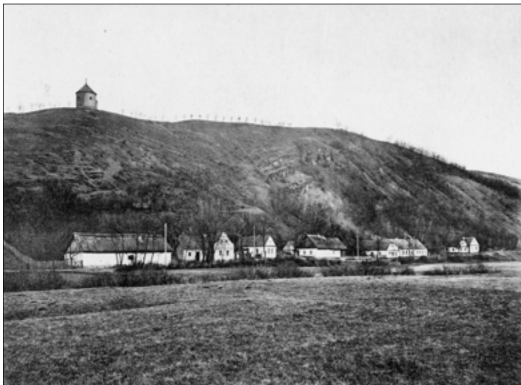
- Mat -