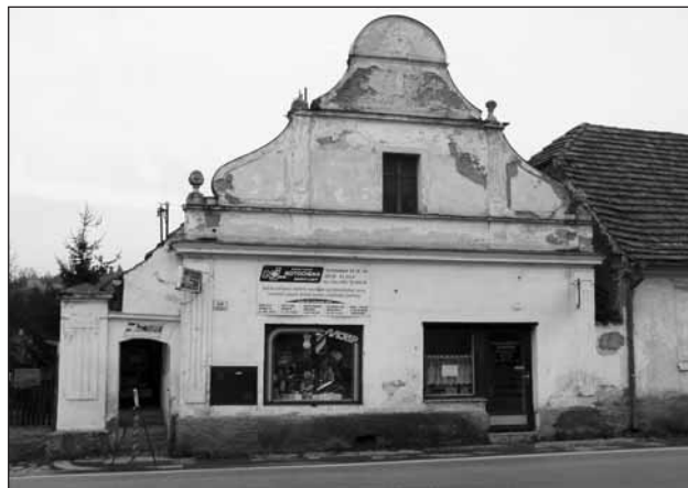
Dům č.p. 68, v současnosti se zde nachází prodejna Motochema.