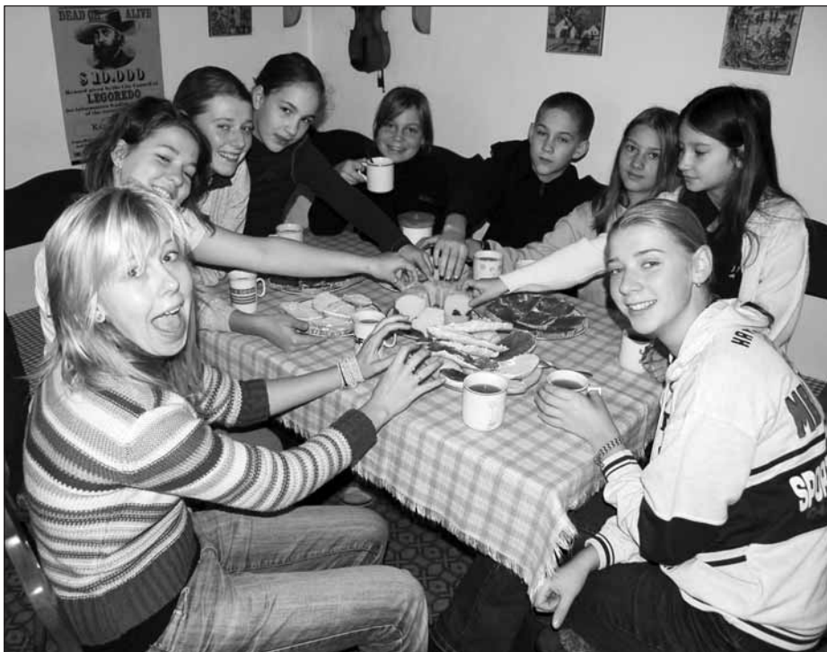
Snídaně ve Spůli.