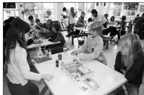
Goada – festival deskových her.