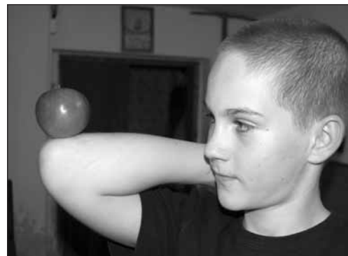
Snad to Matesovi nespadne.