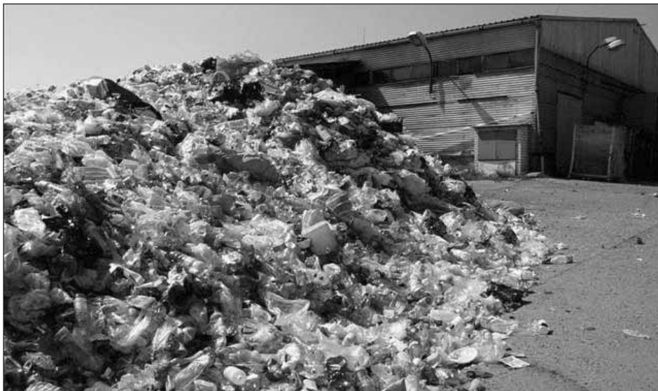
Sběrný dvůr s nahromaděným plastovým odpadem připraveným k dalšímu zpracování.

Helena Šašková, odbor životního prostředí