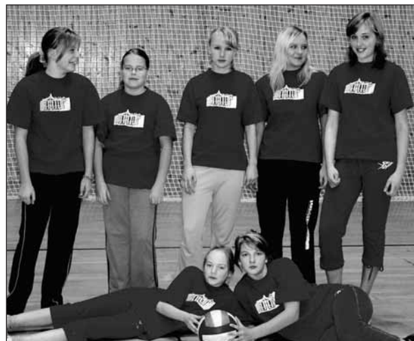
Družstvo žákyň ASPV Starý Plzeň