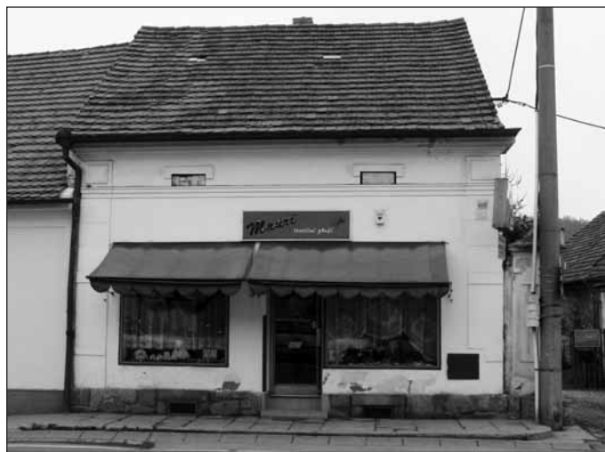
Dům č.p. 210, sídlo obchodu s textilním zbožím Mauri.

Svatopluk Mareš historická sekce OSHR