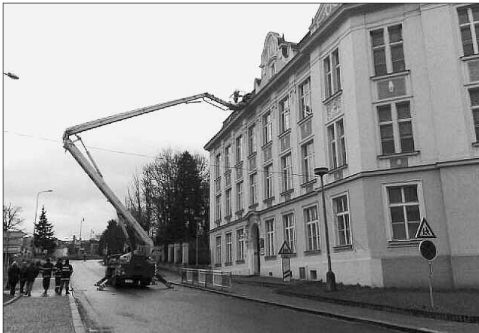
Plzeňští hasiči při čištění okapů na budově základní školy.