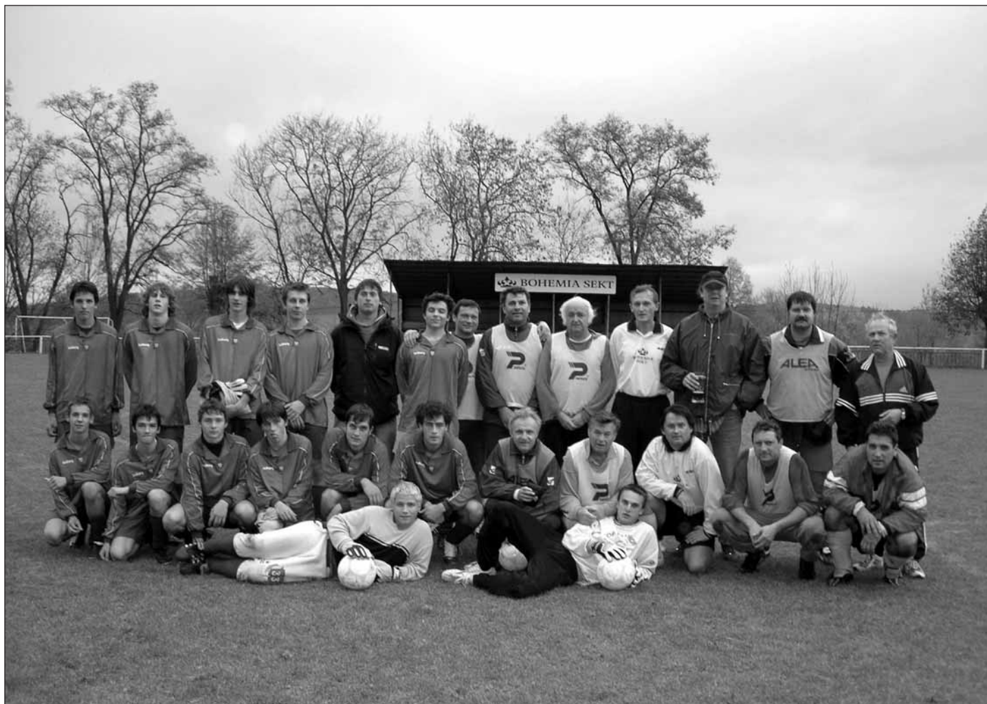
Utkání dorost vs. stará garda.