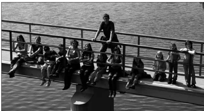
U Boreckého rybníka.