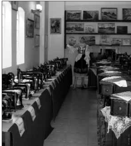
Sbírka starých šicích strojů je k vidění v Hasičském muzeu v Sedlci.