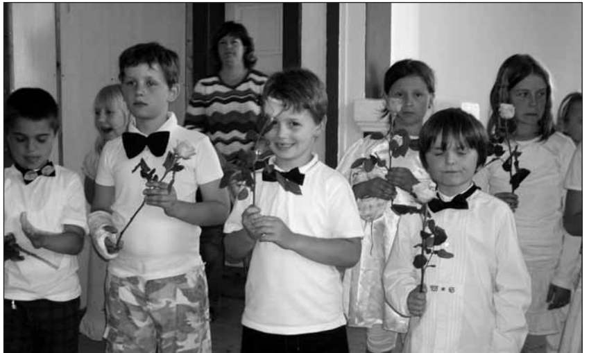
Prvňáčci budou předávat kytičku.