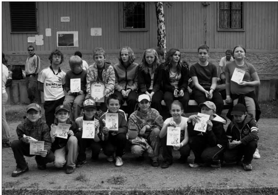
Účastníci Medvědí stezky s diplomy.