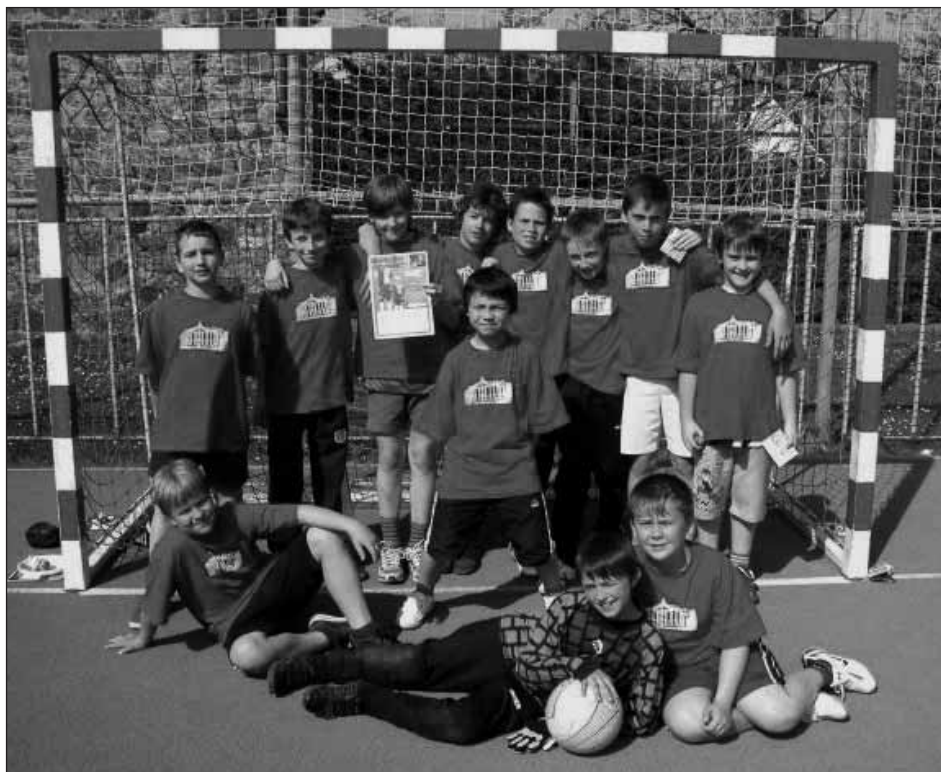
Postupující družstvo ze Starého Plzence (starší kategorie).