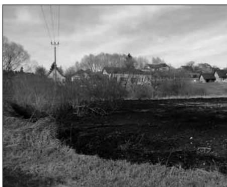
Sedlec, duben 2011.

V odpoledních hodinách naše znavené nožky vystřídaly báječné děti z Úslaváčku, po nich potěšila oči i uši rokycanská Rokytky a pak (pokračování na str. 14)