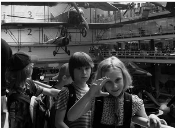
Děti obdivují exponáty.