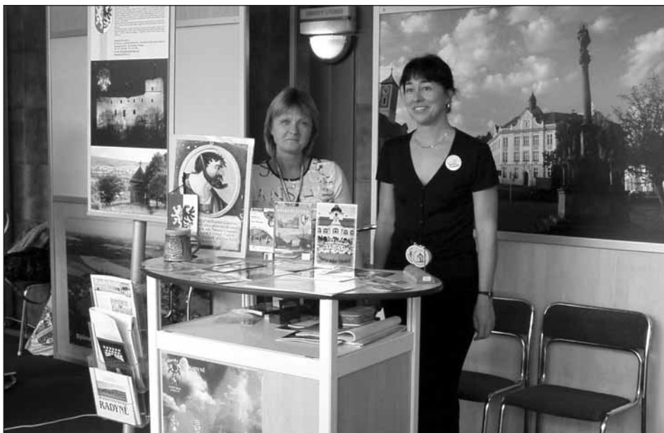
Výstavní stánek Starého Plzeňce byl k dispozici všem návštěvníkům po celou dobu trvání veletrhu.