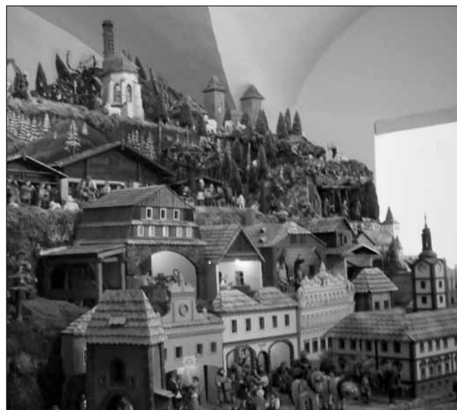
Lidový Betlém v Muzeu Šumavy v Sušici.