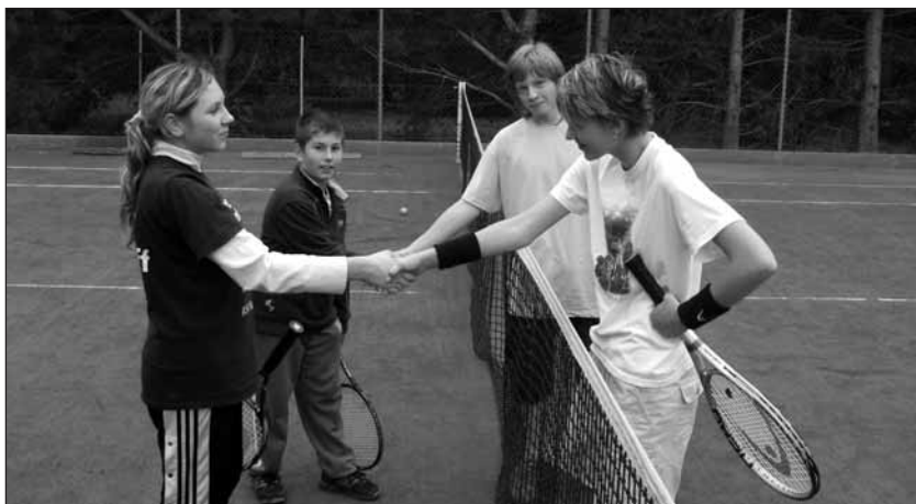
Po zápase smíšené čtyřhry mládeže.