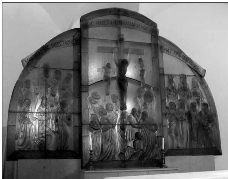
Skleněný oltář v Dobré Vodě.