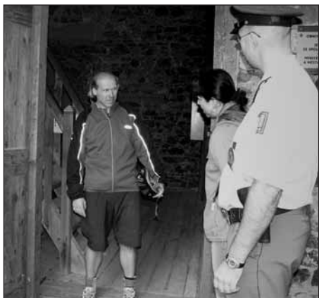
Záchranu Radyňského „vězně“ pro vás zachytila reportérka Plzeňského deníku Miroslava Vejvodová.