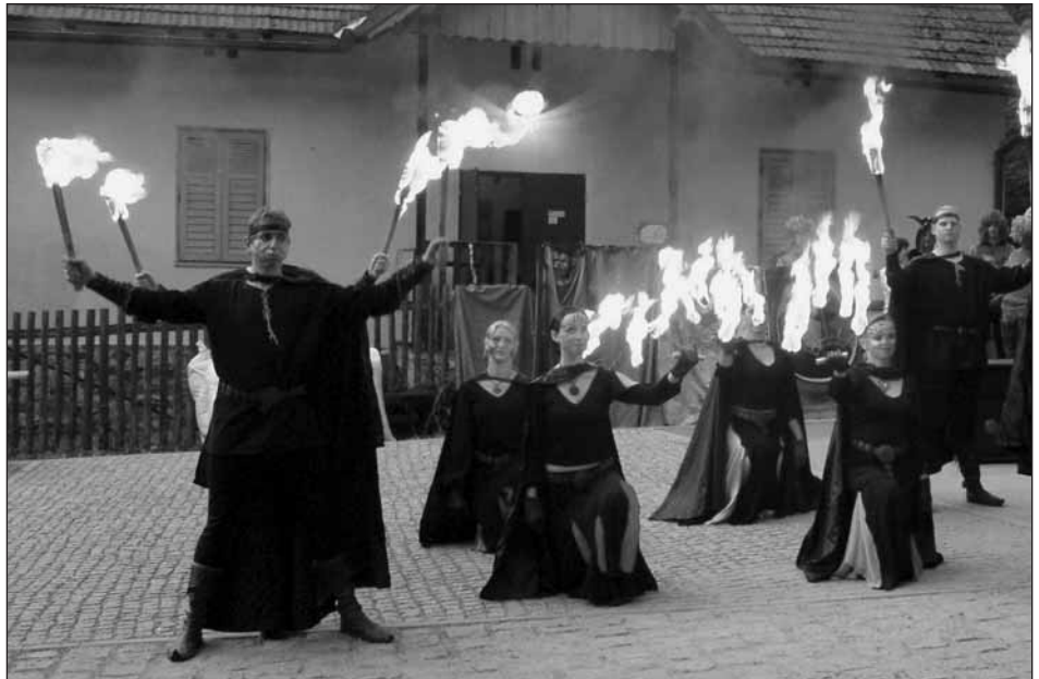
Tanec s ohněm v podání skupiny Octavius navodil tajuplnou atmosféru šeřícího se dne.

V průběhu celého odpoledne neměl opravdu nikdo z návštěvníků čas se nudit, jelikož byl v prostoru podhradí před hospodou U Radouše připraven bohatý doprovodný program, ve kterém se představila skupina historického šermu Lorika s pohádkou Rytíři a drak, dospělé jistě pobavil folklórní soubor Radost, malé i velké vtáhla do děje skupina historické-