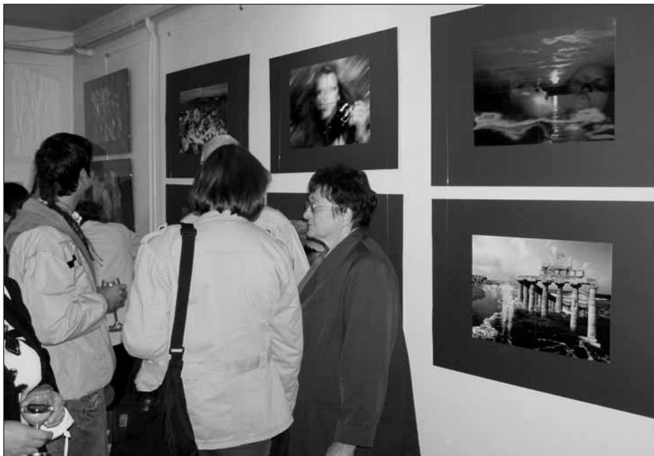
Bezespornu zajímavé a originální fotomontáže zaujaly spoustu návštěvníků vernisáže.