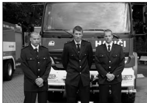
Naši v Litoměřicích