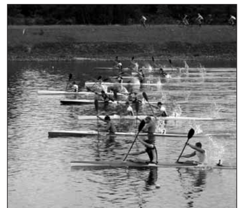
Pepa s Nobikem,

Pokud shrnu celou přípravu na tomto soustředění, musím konstatovat, že jsme se připravili více než dobře.