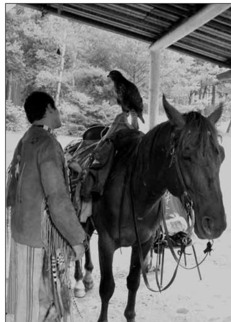
Návštěva indiánského bojovníka v našem táboře.