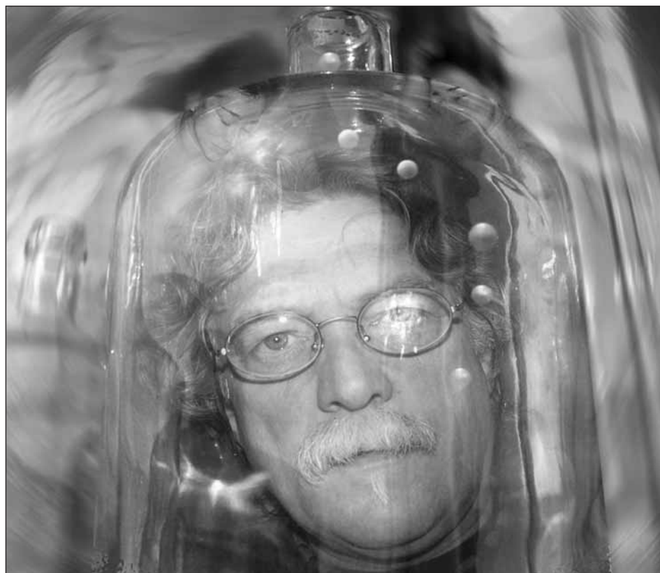
Uvězněn v láhvi, to je název jedné z mnoha originálních koláží, které jsou k vidění ve Staroplzenecké galerii až do 18. 10. 2007.