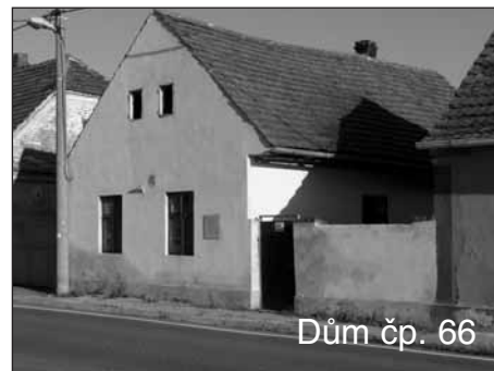
Dům čp. 66