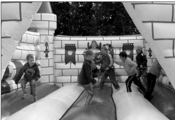
Děti si skutečně naplno užívaly skákacího hradu, který byl pro ně zdarma k dispozici po celé odpoledne.