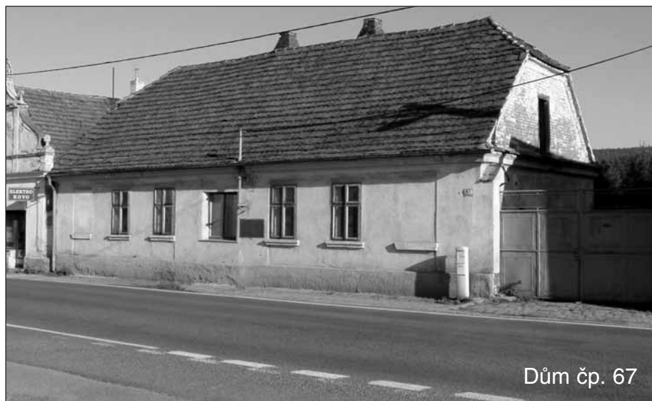
Dům čp. 67

Rod Fáberů se zde vytrvale držel, což potvrzuje i o sto let starší první zápis v pozemkové knize. Zde se uvádí, že