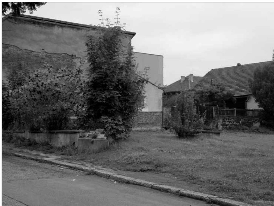
Místo, kde stával dům č. p. 117.

O dům měl zájem i Staropluženský pivovar. Ve smlouvě z 19. května 1903