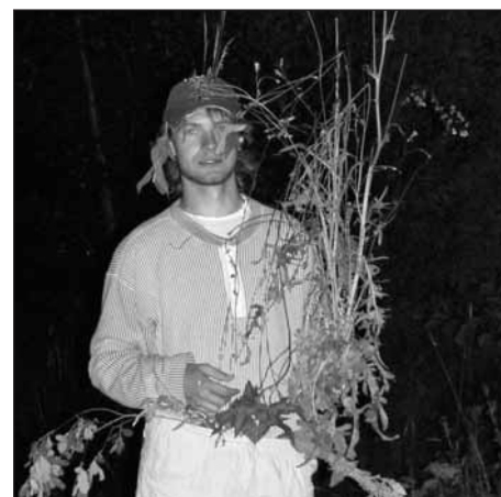
Šaman noční hry.