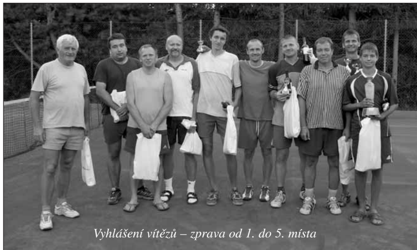
Vyhlášení vítězů – zprava od 1. do 5. místa