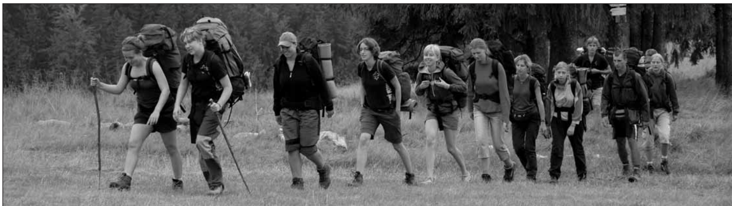
Naše výprava po Slovenském rudohoří.