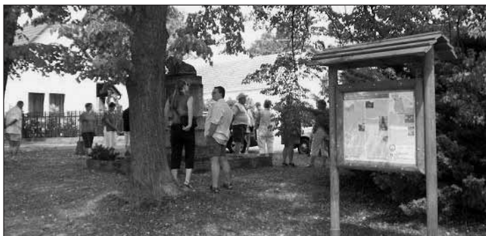
Lidé se scházejí na návsi u jedné ze zastávek nové naučné stezky Pod Zelenou Horou. Přijíždějí auty převážně ze Starého Plzně a Plzně.