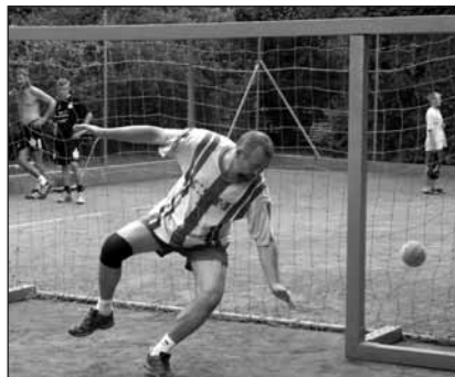
Zase to tam padlo.