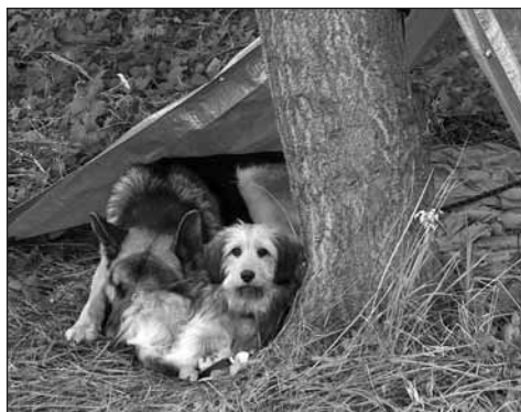
Některým miláčkům se v odkládacích boxech nelíbilo.