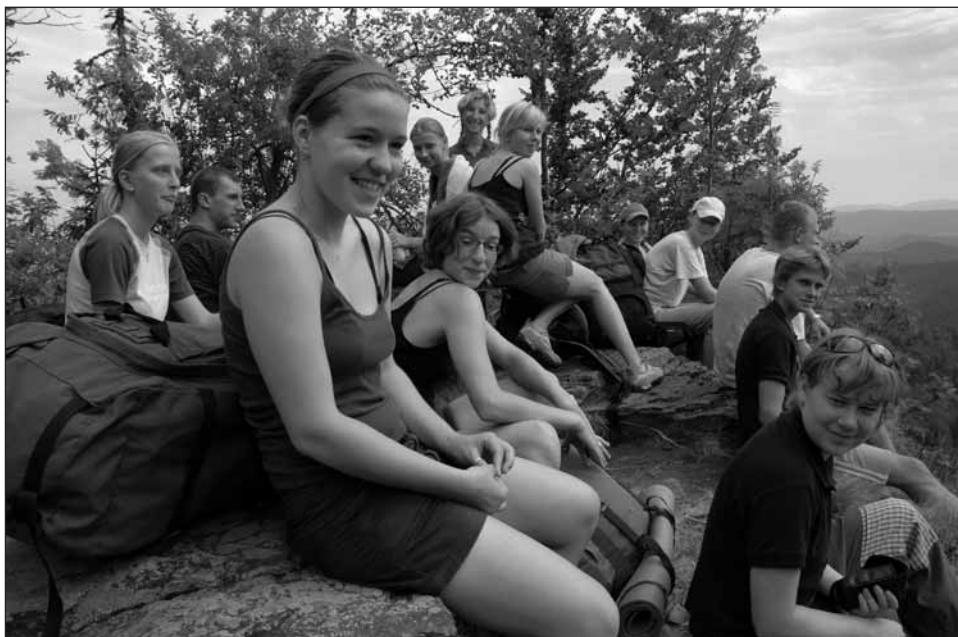
Na vrcholu Veporu.