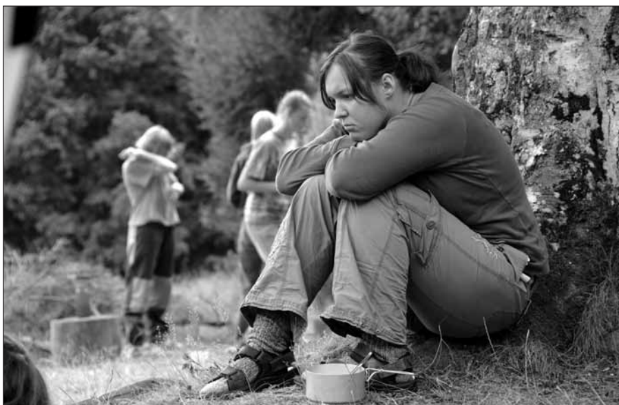
Večer, po jednoduché ale dobré večeři, jsme nabírali síly na další den. Byly to chvíle pohody i k zamyšlení.