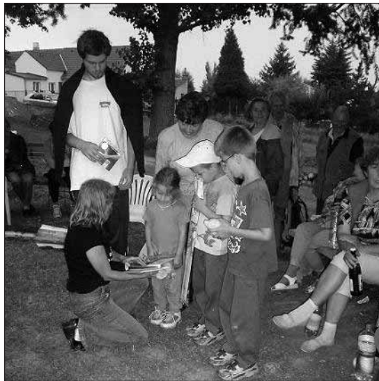
Předávání cen - každá soutěž je po zásluze vyhodnocena.