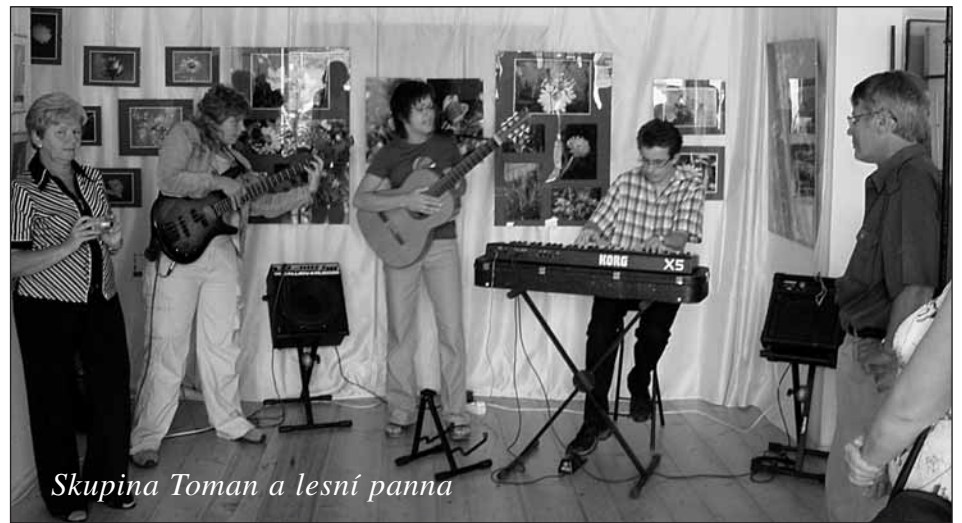
Skupina Toman a lesní panna