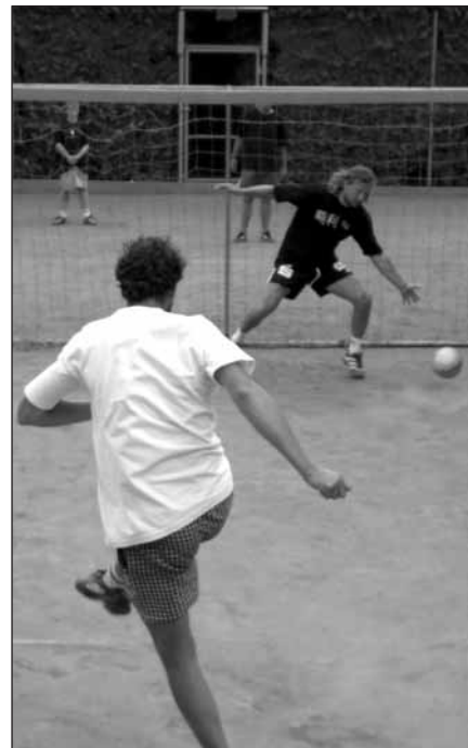
To už bude asi gól.