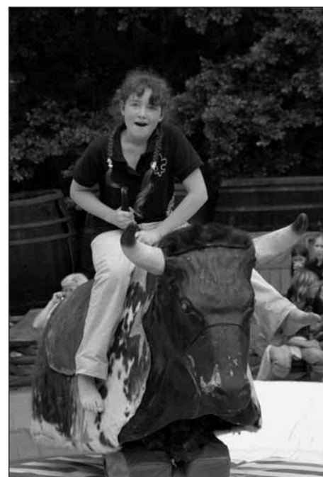
▲ Krocení elektrického býka.