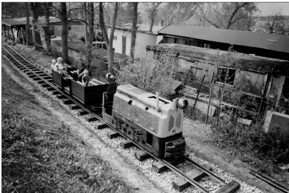
Nový úsek PŽ.

Nejnovejší lokomotivou PŽ je BN 15 R. Do Starého Plzně byla dovezena ze Skanzen Solvavy Lomy 10. 8. 2005.