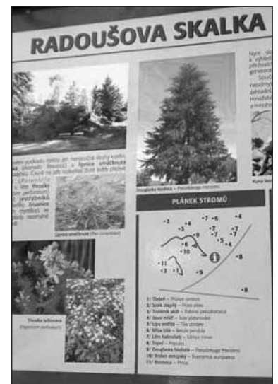
Radoušova skalka pod hradem Radyň - nové zastavení na naučné stezce.