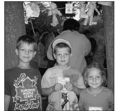
Nejmladší účastníci soutěže - dětem se u ohýnku moc líbilo a s chutí se zapojily do pečení, poslouchání pohádek, kreslení.