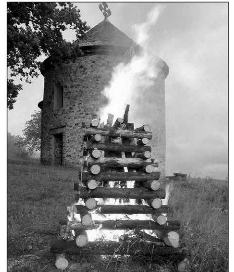
Vatra k uctění památky mistra Jana Husa vzplála u rotundy sv. Petra a Pavla.