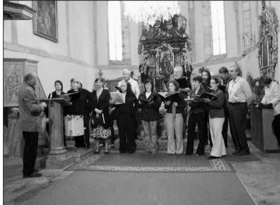
Pěvecký sbor Česká píseň navodil příjemnou atmosféru svým vystoupením v kostele sv. Jana Křtitele.