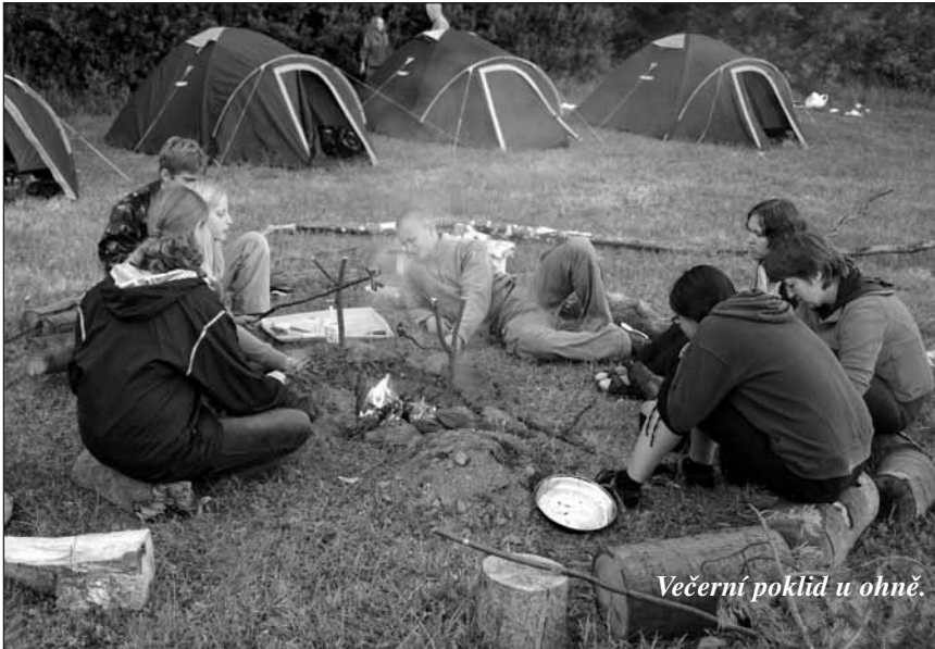
Večerní poklid u ohně.