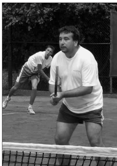
Záběr z finálové čtyřhry.