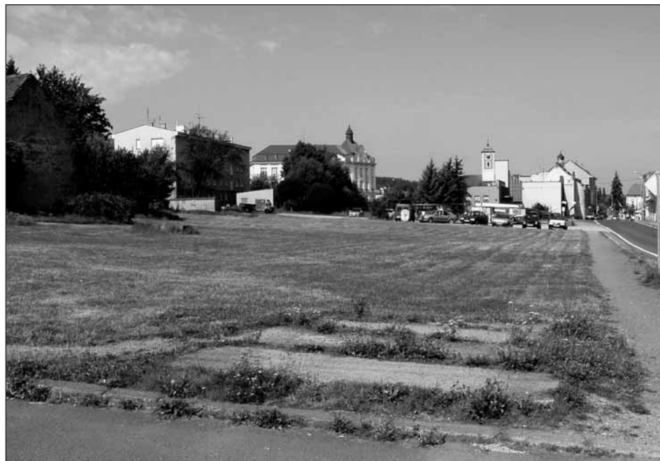
Holá pláň ve Smetanově ulici - toť současnost. V minulosti zde stával dům č.p. 114. A co bude na tomto místě vybudováno v budoucnu, je velkým otazníkem.

Bohužel nebyl v archivu k dispozici snímek, který by zachycoval zmiňovaný dům.