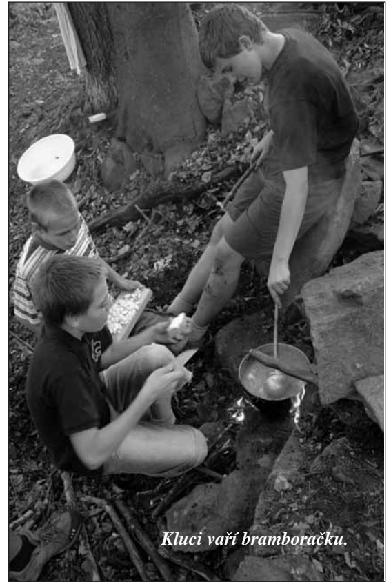
Kluci vaří bramboračku.