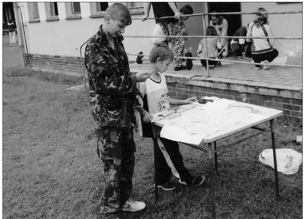
Plzenečtí při soutěži v Plasích.