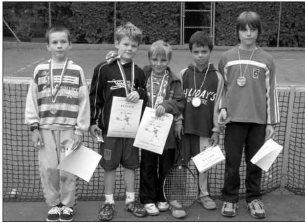
Vyhlášení vítězů kategorie mladší žáci.

Informace a přihlášky na adrese: p. Doležel, Herejkova 1031, Starý Plzenec, tel.: 605987754, 377965213.