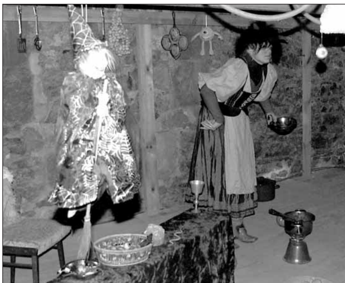
V čertovské kuchyňce připravila sličná čertice k ochutnávce pravý „čertovský guláš“ – jen pro ty nejodvážnější labužníky.