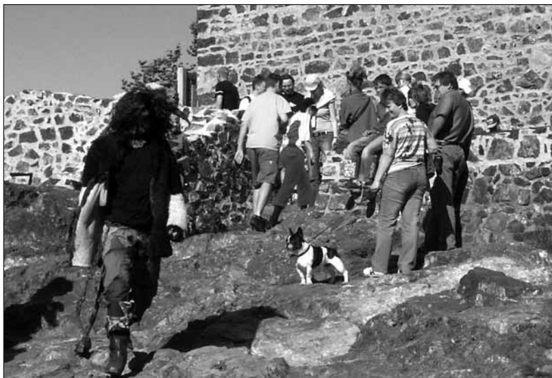
Davy pocestných proudily na čertovský hrad Radyni.