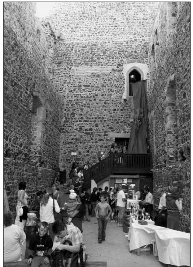
Pekelnický prapor vyvěšený nad vchodem do hradní věže dával na vědomí všem příchozím, že jsou tu čerti, a „s čerty nejsou žerty.“