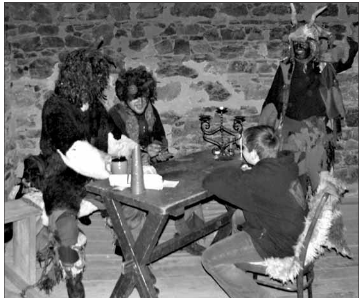
Ve věži hráli čerti s malými hřištníky pekelnický mariáš.