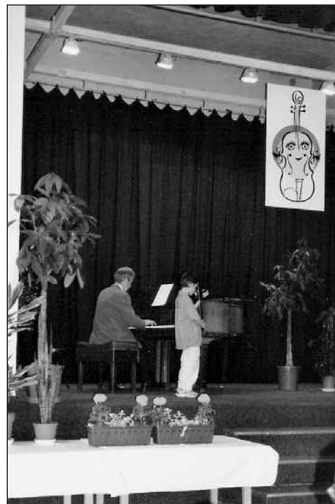
Ilustrační záběr ze soutěže.