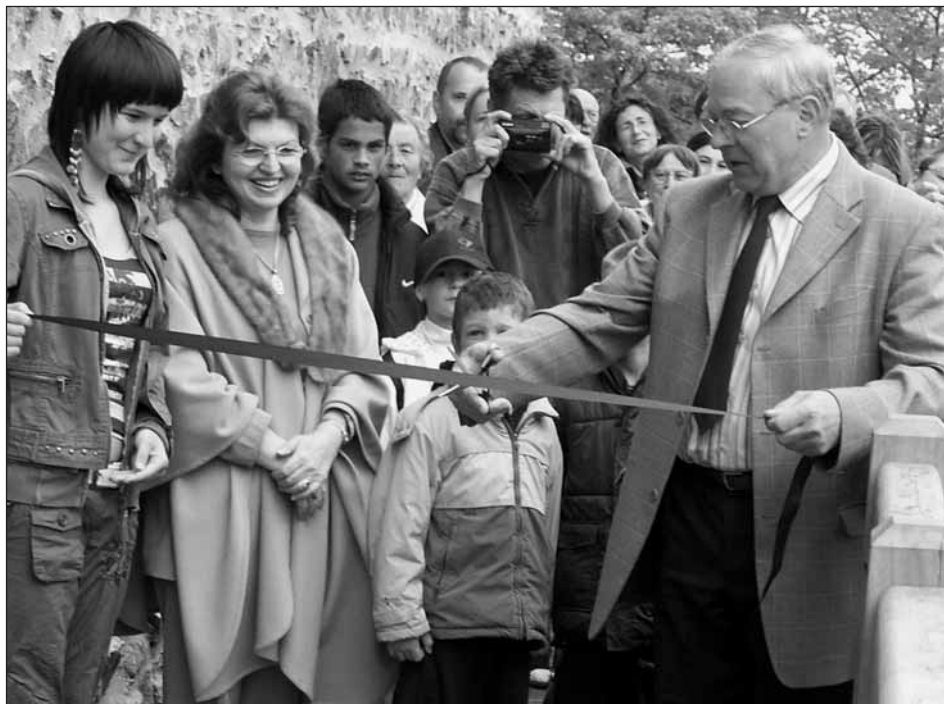
Oficiálním přestřižením pásky byl pro veřejnost otevřen nový hradní můstek.