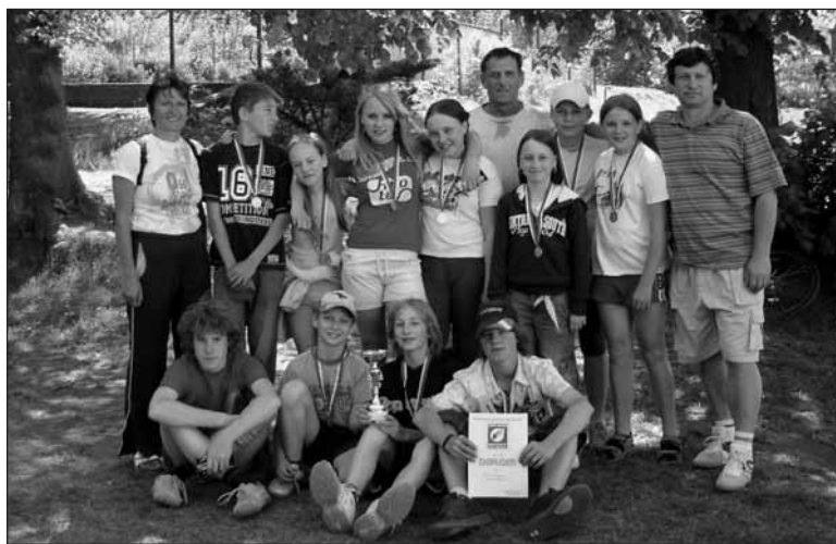
Republikoví finalisté v brännballu (pálkovací hře).