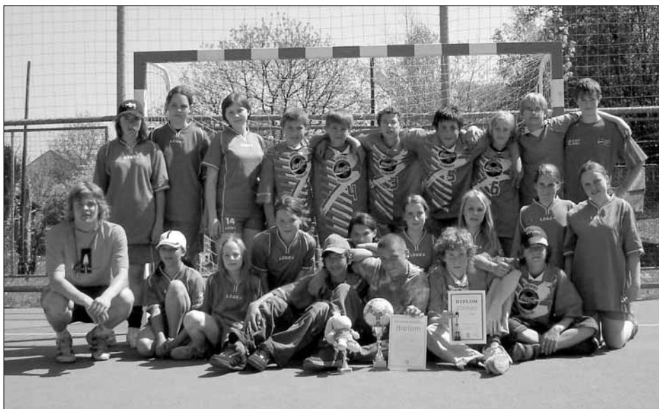
Vítězné okresního kola Novinářského kalamáře v házené.