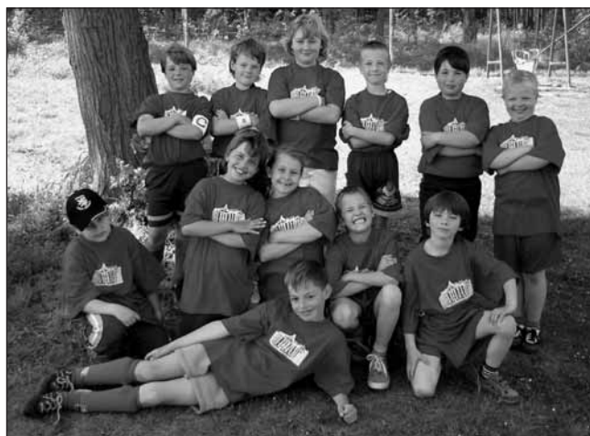
Vítězný tým okresního kola fotbalového zápasu MC DONALD CUP.