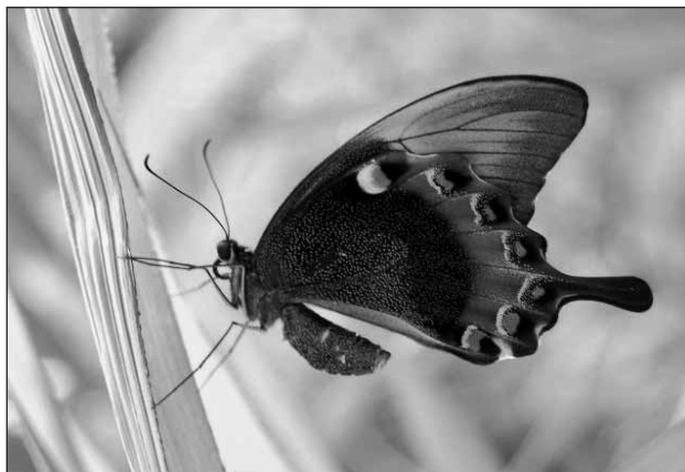
V botanické zahradě zrovna probíhala expozice cizokrajných motýlů.