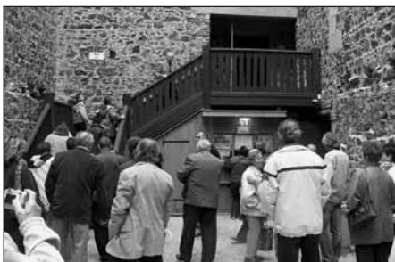
Na nádvoří Radyň se shromáždili návštěvníci a čekali na její letošní slavnostní otevření.