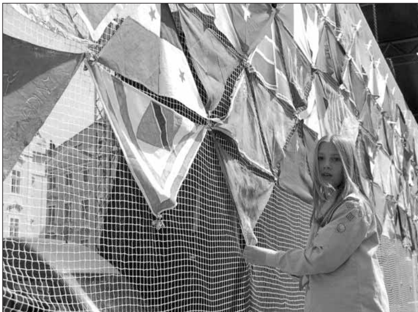
Pokusili jsme se sestavit největší skautský šátek na světě.