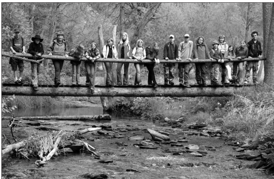
Účastníci výpravy na hrad Gutštejn.