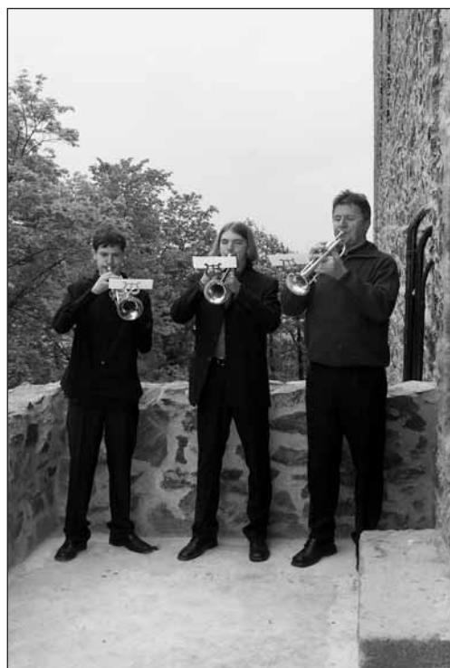
Slavnostní zahajovací fanfáry.