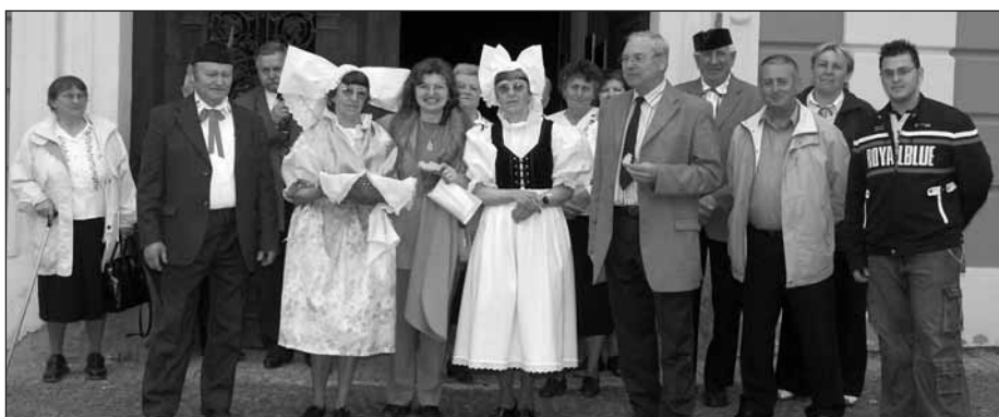
Baráčníci přivítali návštěvu z Albánie tradičně po staročesku – chlebem a solí.