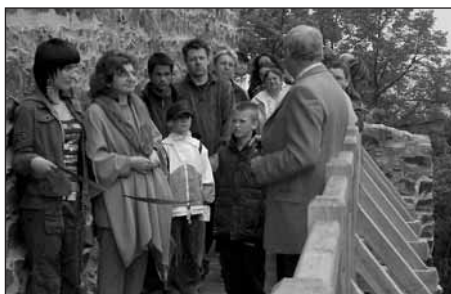
Na novém hradním můstku se tlačilo mnoho návštěvníků a čekali na jeho slavnostní otevření.