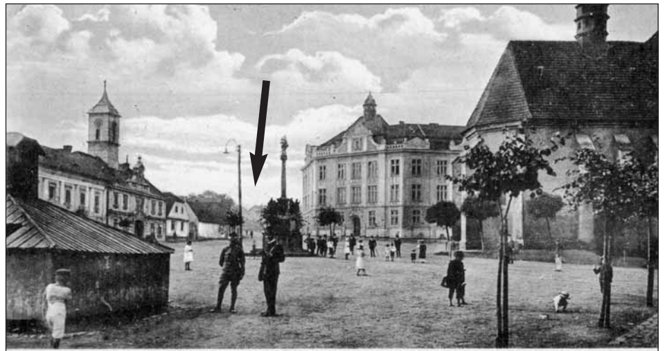
Plzeňec (Stará Plzeň), Hořejší část Náměstí s radnicí, měšť. školou a kostelem sv. Jana