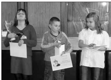
Vítězové III. kategorie.