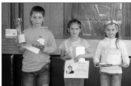
Vítězové II. kategorie.