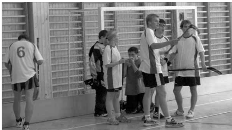
„Týmová porada během utkání s SK Snipers Elite Nezvěstice“

Bližší informace na www.stary-plzenec.cz/spartaksedlec