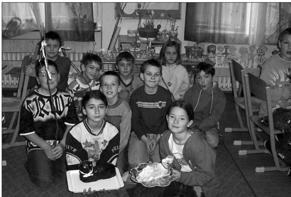
Jako každý rok i letos proběhl na naší škole PROJEKT VELIKONOCE, který děti velmi baví.