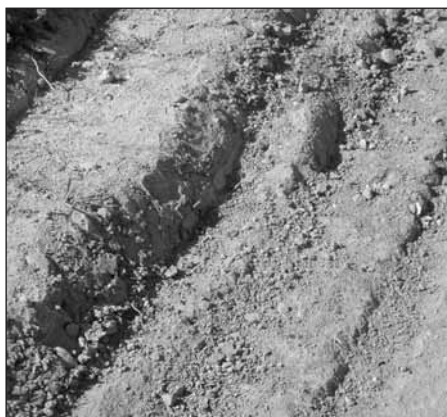
I takto vypadají některé komunikace, o kterých se miňuje náš článek.

Sládkovu), 7. Nerudova. Kritická situace je také v ul. Luční , která je zatížena provozem fekálních vozů do čističky (zatím však v ní chybí kanalizace), a posledním úsekem ul. Kap. Jaroše , která je zatížena provozem osobních automobilů na fotbalové hřiště a bude moci být vyasfaltována po zastavění louky nad touto ulicí. Při tomto výběru nezapomínáme na další prašné ulice ani na městské části Sedlec (Malá Strana. Po dokončení další etapy budování kanalizace v těchto částech města bude navržený seznam revidován. Do té doby nezbyvá než apelovat na ohleduplnost řidičů, aby zejména za velkého sucha a s ohledem na obyvatele, kteří v nich bydlí, jezdili prašnými ulicemi sníženou rychlostí. (J. W.)