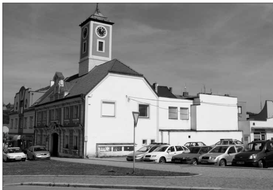
Místo, kde dříve stával dům „U Plechatů“, jak ho můžeme vidět dnes.