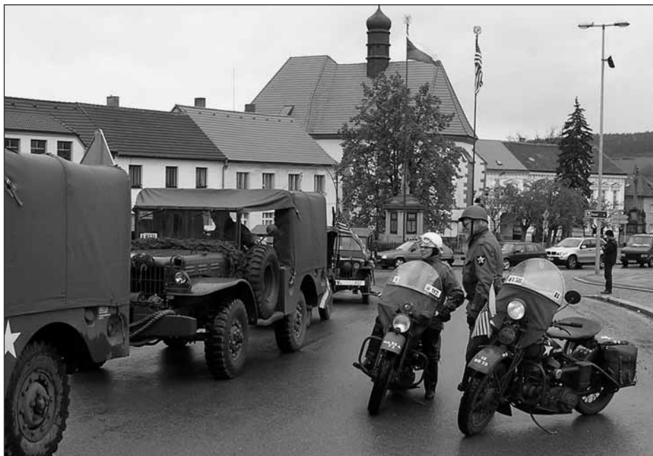
Tradiční průjezd konvoje historických vozidel městem, tak jak jsme ho mohli vidět v minulém roce. Tuto podívanou si nenechal ujít snad žádný z obyvatel. Věříme, že i letos se bude na co koukat.