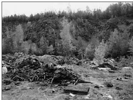
Letkovský lom dřívě.

V lednovém čísle RL jsme psali o letkovském lomu, kde jsme přistihli podnikatele V. Pecha, který tam podniká, jak sype zeminu z terasy do jezera. Řešení tohoto přestupku přísluší Magistrátu města Plzně - Odboru životního prostředí (MmPOŽP), kam jsme předali podnět na zahájení přestupkového řízení. Koncem března nás pan V.P. navštívil a potvrdil, že dostal pokutu 30 000,- Kč, doložil potvrzení MmPOŽP o nezávadnosti svého podnikání v dané lokalitě a současně nás požádal, abychom s ním navštívili letkovský lom, kde již opět vzniká na příjezdu k jezírku černá skládka. Tam jsme se dohodli na opatření, které pan V.P. provede na své náklady, aby tak zabránil dalšímu šíření této nepovolené skládky. Současně jsme si prohlédli stav terasy nad jezírkem, kde pan V. Pech slíbil udržovat pořádek. Na přiložených dvou snímcích je stav části terasy nad jezírkem před úklidem a v současnosti. Věříme, že „válečná sekera“ tak byla mezi námi zakopána a že se nám nyní společně s podnikatelem podaří pořádek v bezprostřední blízkosti jezírka udržet.