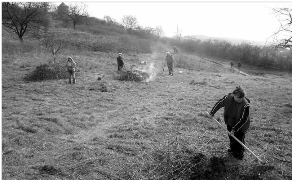
Poděkování patří členům OSHR, že jim není čistota v okolí našeho města lhostejná a že se dobrovolně podílejí na jeho zvelebování.