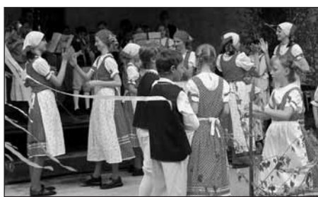
Několika snímky se připomeneme úspěšný loňský ročník slavností.