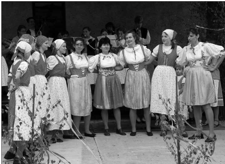
Přítomné návštěvníky svým vysoupením příjemně naladí taneční soubor Úslaváček.

Od uzavření sálu bývalého hotelu „Stadion“ chybí v naší obci vhodný prostor pro pořádání kulturních akcí, a proto jsme se rozhodli slavnost pořádat pod širým nebem v prostoru hasičské zbrojnice. Loňský rok nám skvělou atmosféru narušilo špatné počasí, ale i přesto se k nám přišli pobavit lidé ze širokého okolí. Zhlédli vystoupení folklórního souboru Úslaváček z LŠU ve Starém Plzenci a k tanci a poslechu všem hrála hudební skupina Sedmihorka. Při této příležitosti bylo veřejnosti zpřístupněno hasičské muzeum a pro všechny bylo připraveno dostatek občerstvení. Nejvíce ze všeho zachutnaly domácí koláče. Věříme, že v letošním roce nám bude počasí více nakloněno, ale ani špatné počasí nás