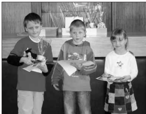
Vítězové I. kategorie.