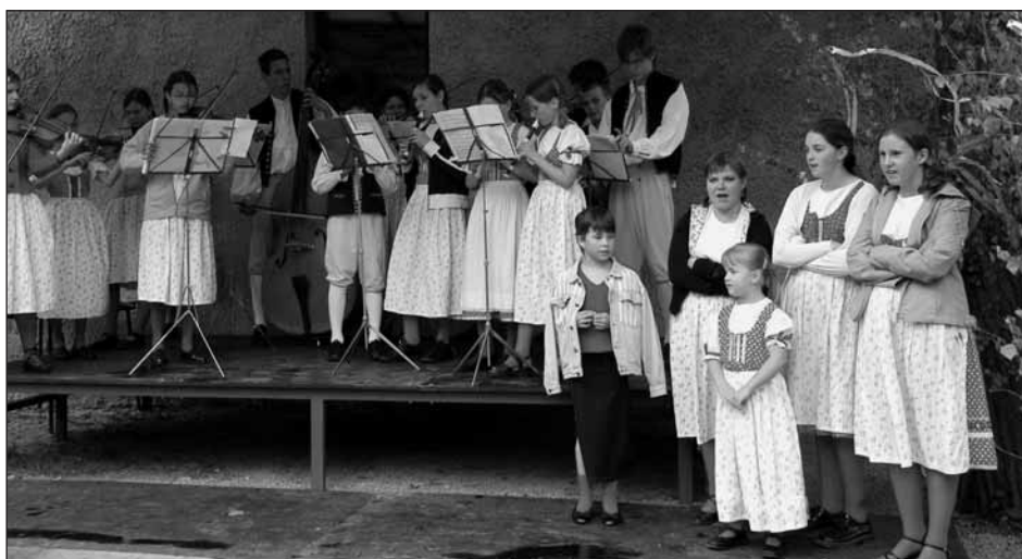
Vystoupení souboru Úslaváček během loňských májových slavností v Sedlci.