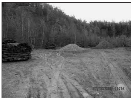
Letkovský lom dnes.