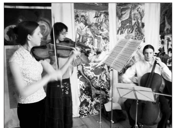
Hudební vystoupení žáků ZUŠ při vernisáži dne 8. 3. 2007 ve Staroplzenecké galerii.

amatérské fotografie 16. 4. - 10. 5. 2007 Staroplzenecká galerie vernisaž výstavy 16. 4. 2007 v 18:00 hodin