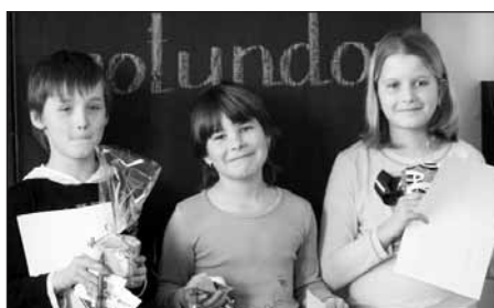
Vítězové III. kategorie.