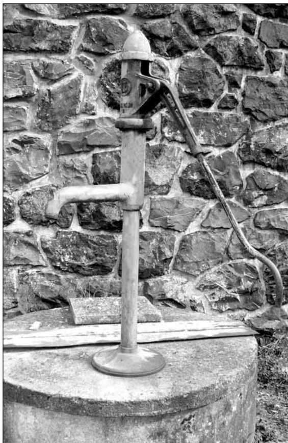
Ilustrační foto –mb–

s odbornou způsobilostí včetně zhodnocení původu vody, možnosti ovlivnění okolních zdrojů podzemních vod - pokud vodoprávní úřad nerozhodne jinak.