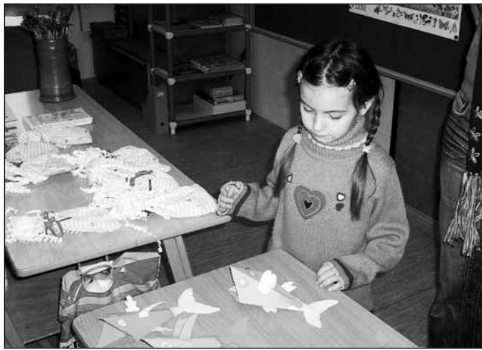
V Sedlci proběhl zápis do ZŠ. Všechny děti si za svůj výkon odnesly vedle dobré nálady i malé překvapení.