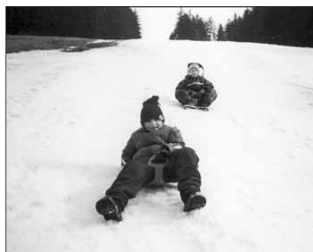
Výlet do Železné Rudy vyfotil František Křížek.