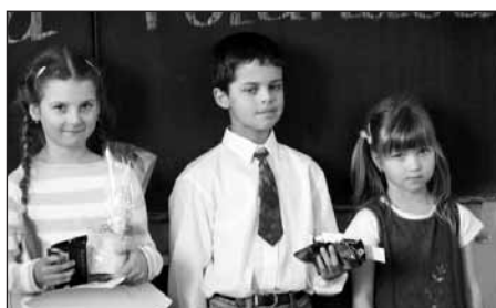
Vítězové I. kategorie.

Kolektiv 1. stupně ZŠ