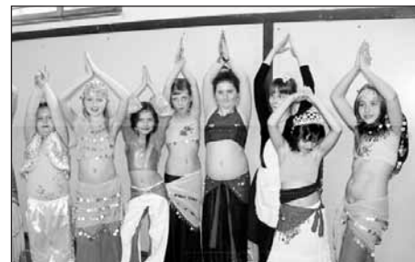
Vystoupení břišních tanečnic.