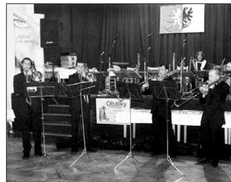
O půlnoci všechny hosty příjemně překvapilo trombónové kvarteto CUATRO ESTUDIANTES.

Eva Vlachová K-Centrum, městská knihovna