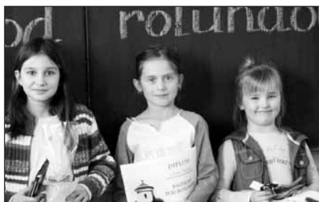
Vítězové II. kategorie.