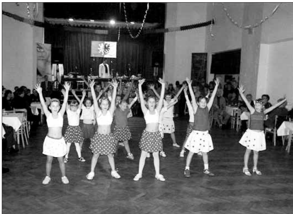
Ples začal působivým předtančením žáků školy.