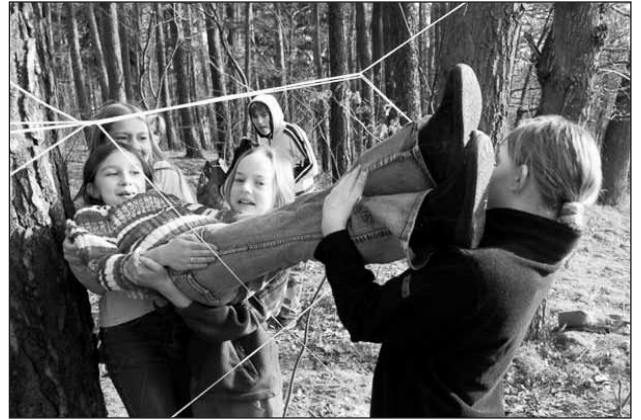
Protahování se pavučinou nebylo vůbec snadné

Medúza ztratila bačkora, nejprve hledala u stolu, Na stole ale ležela paní Fotka, která byla pana Krtka. Pak šla hledat do jeskyně, kde hrála svou hru paní Purkyně. Hra to byla taková, A ona byla taková potvora, že se u ní našla i ta ztracená bačkora, kterou hledala medúza Anděla.