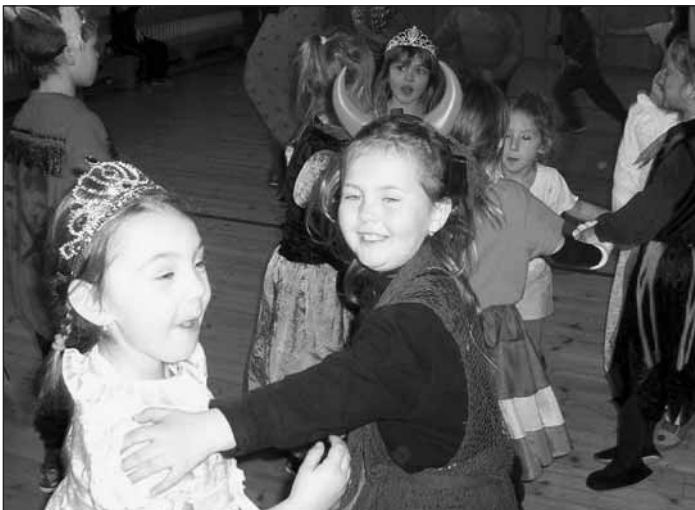
Malé děti – karneval MŠ Sedlec. Čerti a princezny z MŠ ve víru tance.