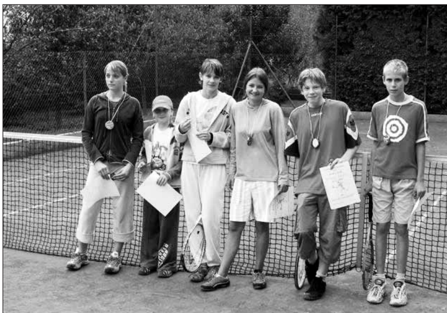
Vzpomínka na loňský rok.