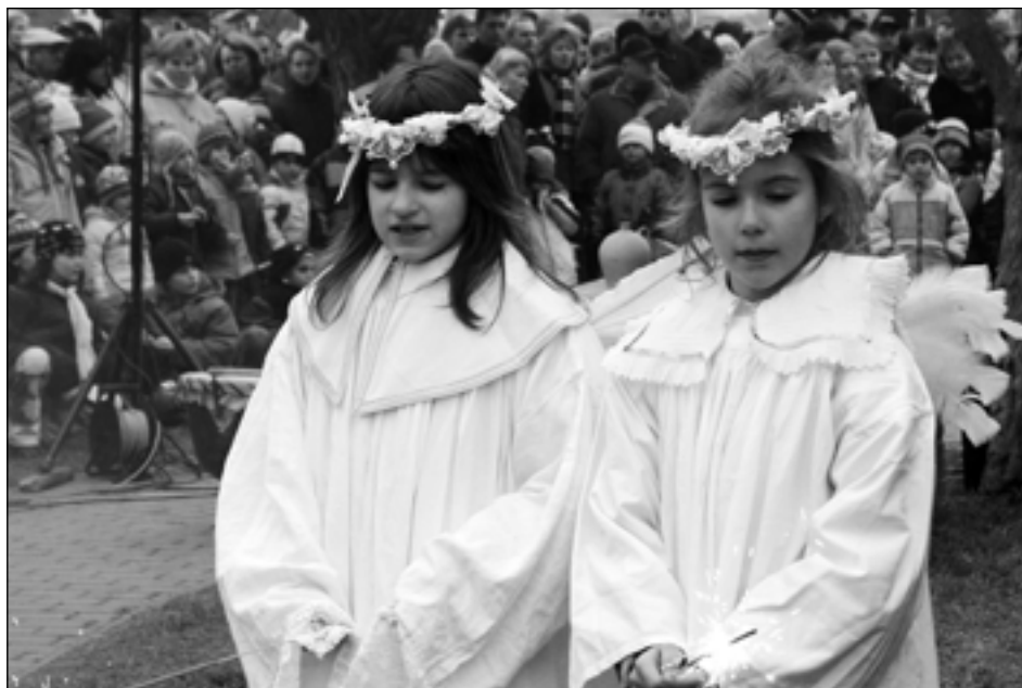
Tak jako každoročně si mají i velcí Staroplzenečtí na Štědrý den odpoledne na Masarykově náměstí tradičně připomenout legendu 2006 let starého Betlémského příběhu.

Především musíme dovést ke zdárnému konci započatou první etapu rekonstrukce ZŠ, spočívající v dokončení půdní vestavby, a vytvořit podmínky (především zajištěním finančních prostředků) pro pokračování naplánovaných dalších etap. Jistě není žádným tajemstvím, že počínaje rokem 2011 končí veškeré výjimky povolující odtok splaškových