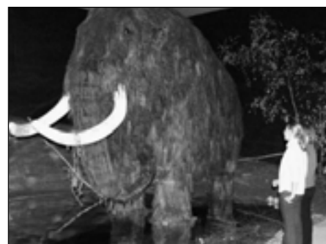
V neděli jsme si pak nenechali ujít výstavu v Národním muzeu o lovcích mamutů.