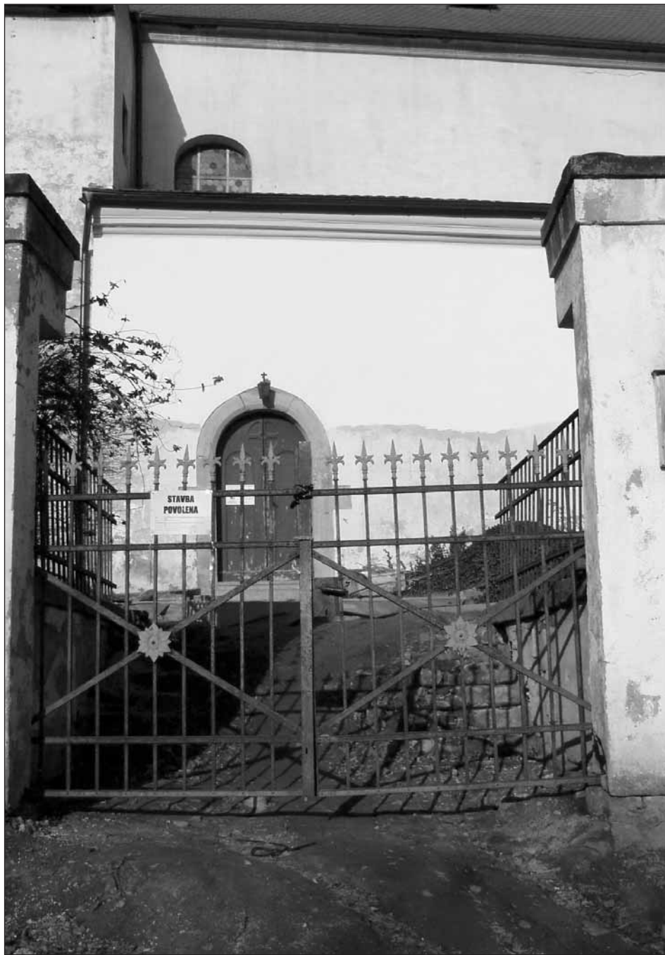
V současnosti probíhají opravné práce vstupního prostoru kostela.