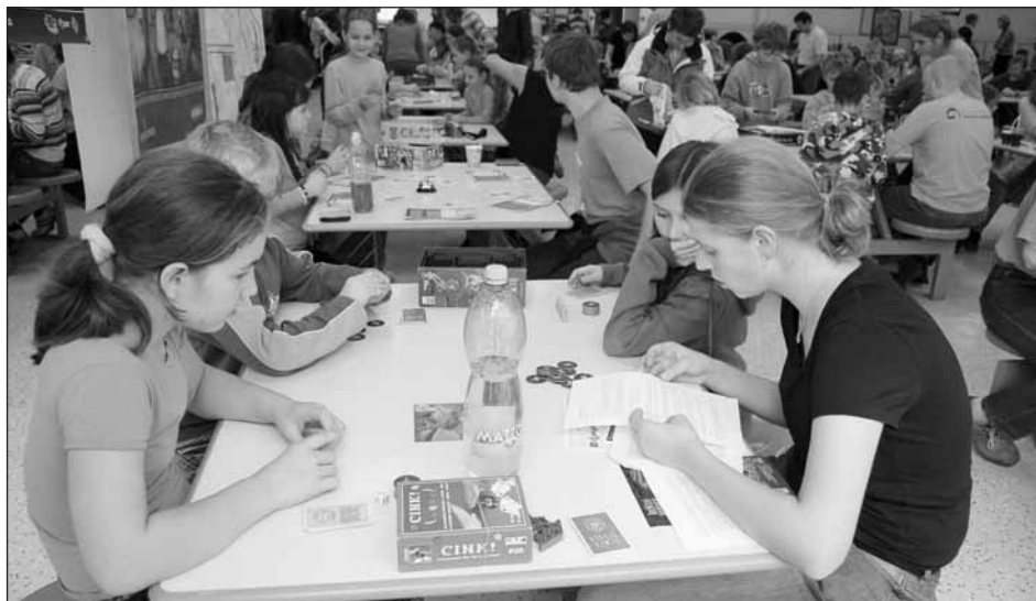
Hrajeme si na Goadě.