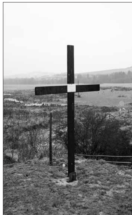
Kříž s pamětním nápisem

Text a foto Pavel Hrouda, www.bradava.cz