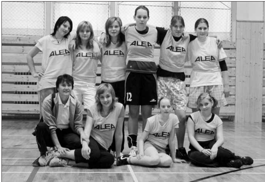
Družstvo žákyní vybojovalo skvělé 2. místo.