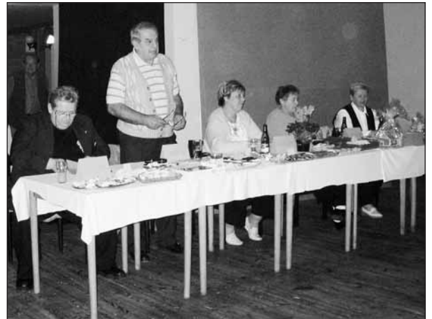
Členové poroty měli těžké rozhodování.