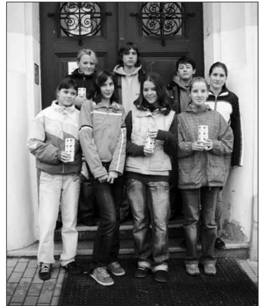
Projekt šance propagovaly děti z 8.A.