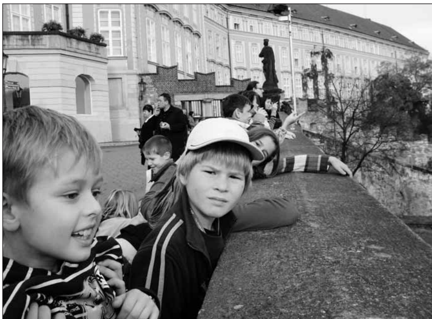
Poznáváme naše hlavní město. Pohled z Pražského hradu dolů na malostranské střechy byl úchvatný.