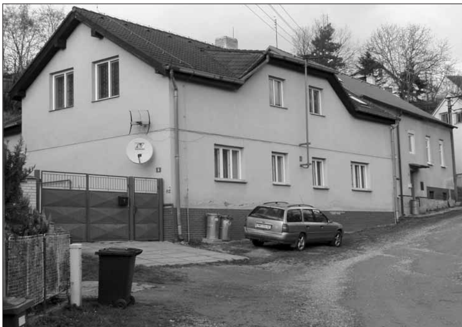
Domy, o jejichž historii pojednává článek. Horní snímek je dům čp. 5, spodní pak čp. 4.