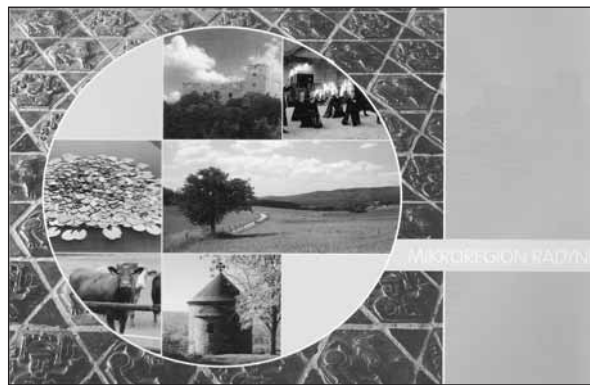
Nová infobrožura Mikroregionu Radyně.