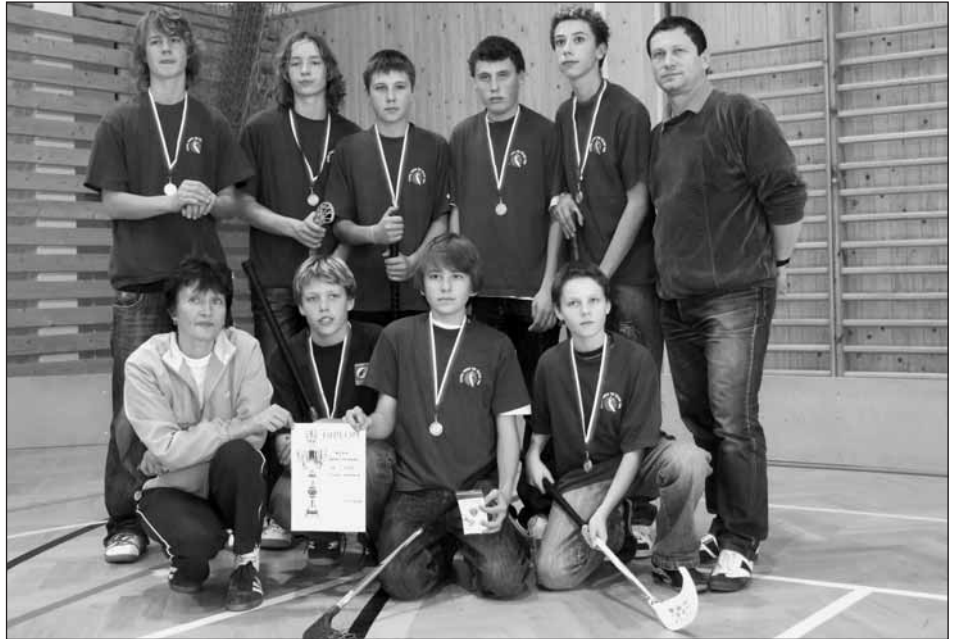
„Stříbrné“ florbalové družstvo.