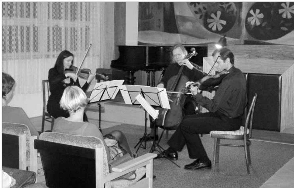
Instrumentální soubor Zanetto trio.