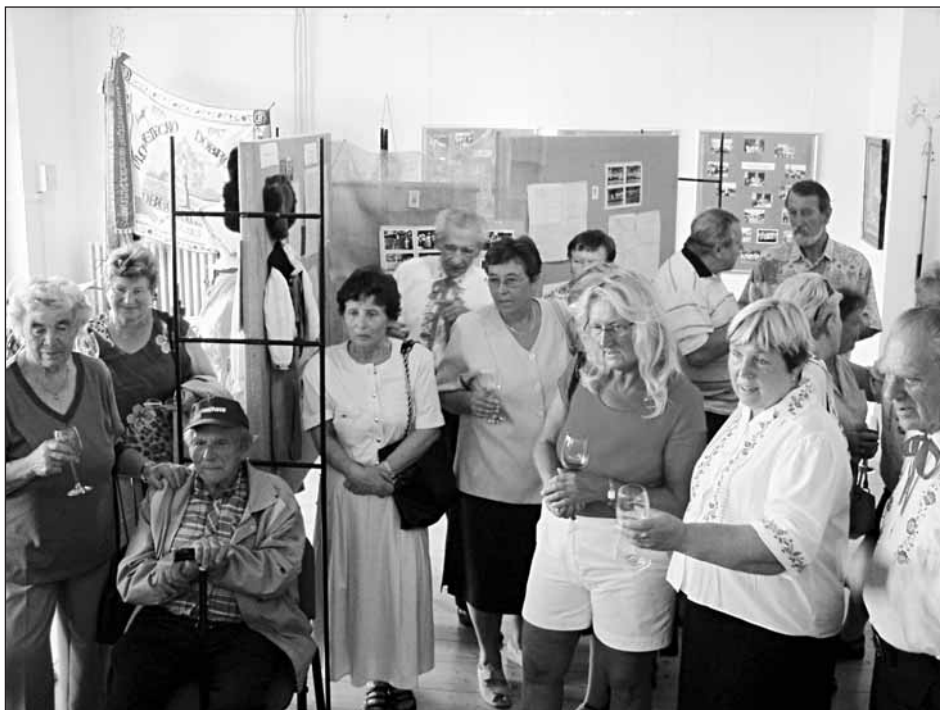
Návštěvníky velmi zaujal filmový dokument o Baráčnících.