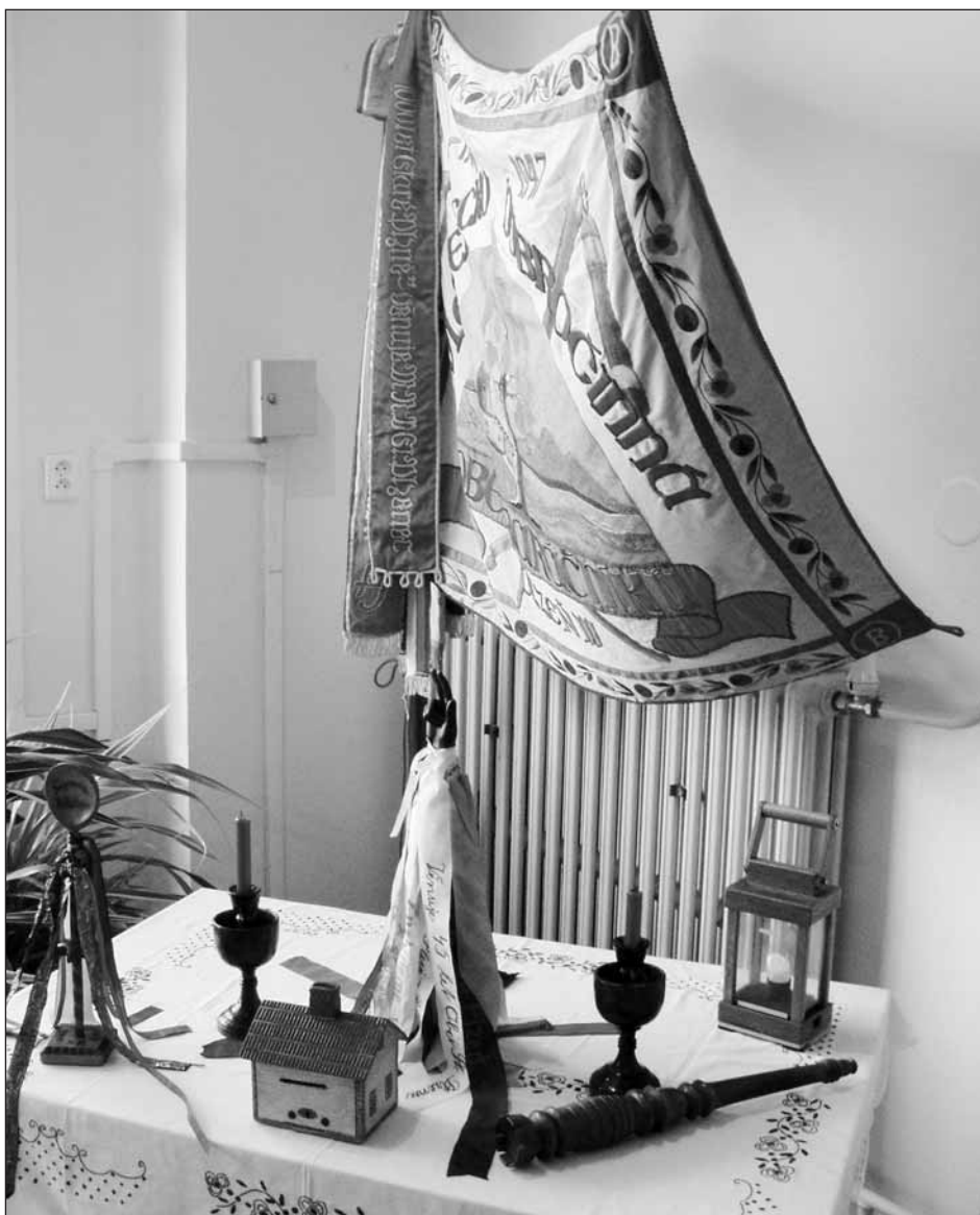
Na výstavě jsou k vidění také různé baráčnické relikvie.

Baráčnická myšlenka vznikla v 70. letech předminulého století v Kolíně, kde se utvořila stolní společnost, jejíž členové rozpracovali myšlenku navázat na nejlepší tradice českého národa, které se nepodařilo vymítnout ani v období útisku a ponížení v habsburském područí.