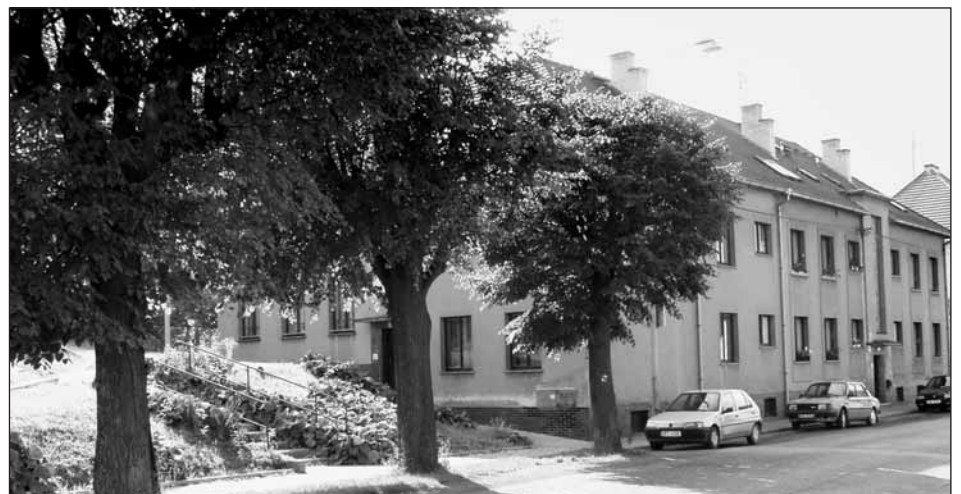
Dům č.p. 49 a 50 v Žižkově ulici, o nichž také pojednává článek.