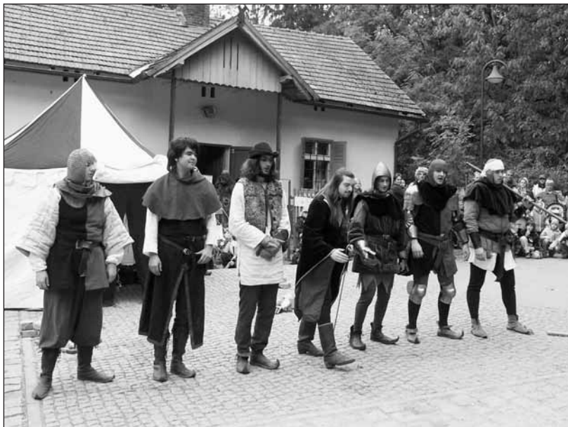
Skupina historického šermu Militis při děkovačce.