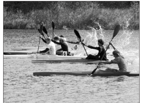
Závodníci starší kategorie.