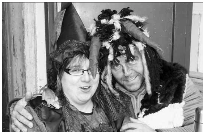
Zápis soutěžících řídili čerti.