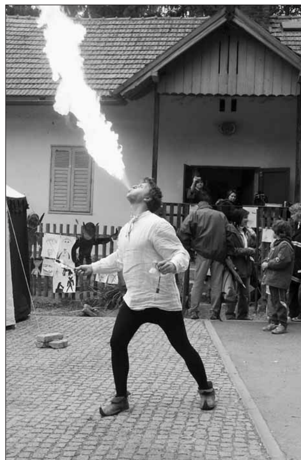
Plivač ohně ze skupiny Militis.