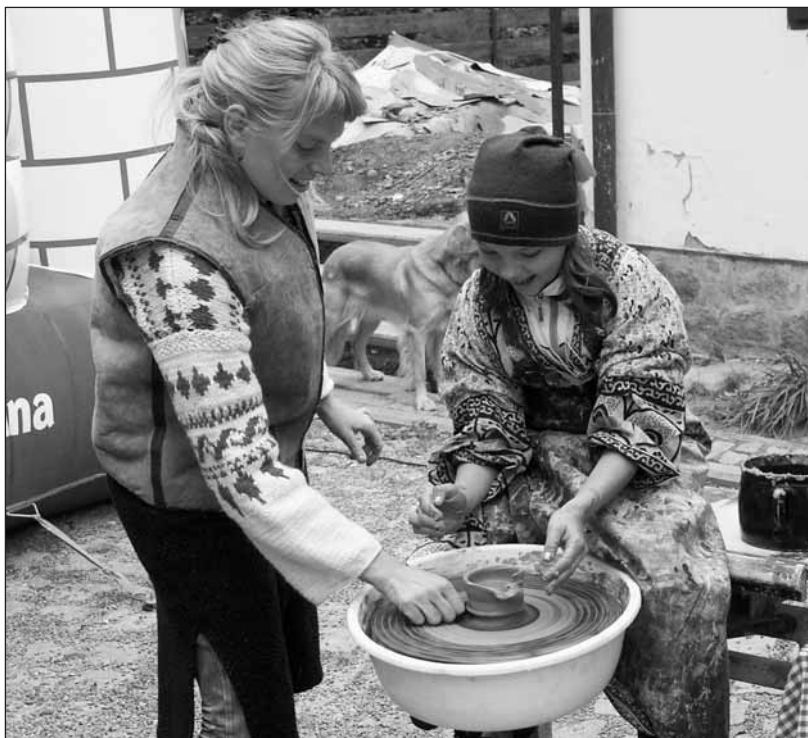
Točit na hrnčířském kruhu je tak snadné!