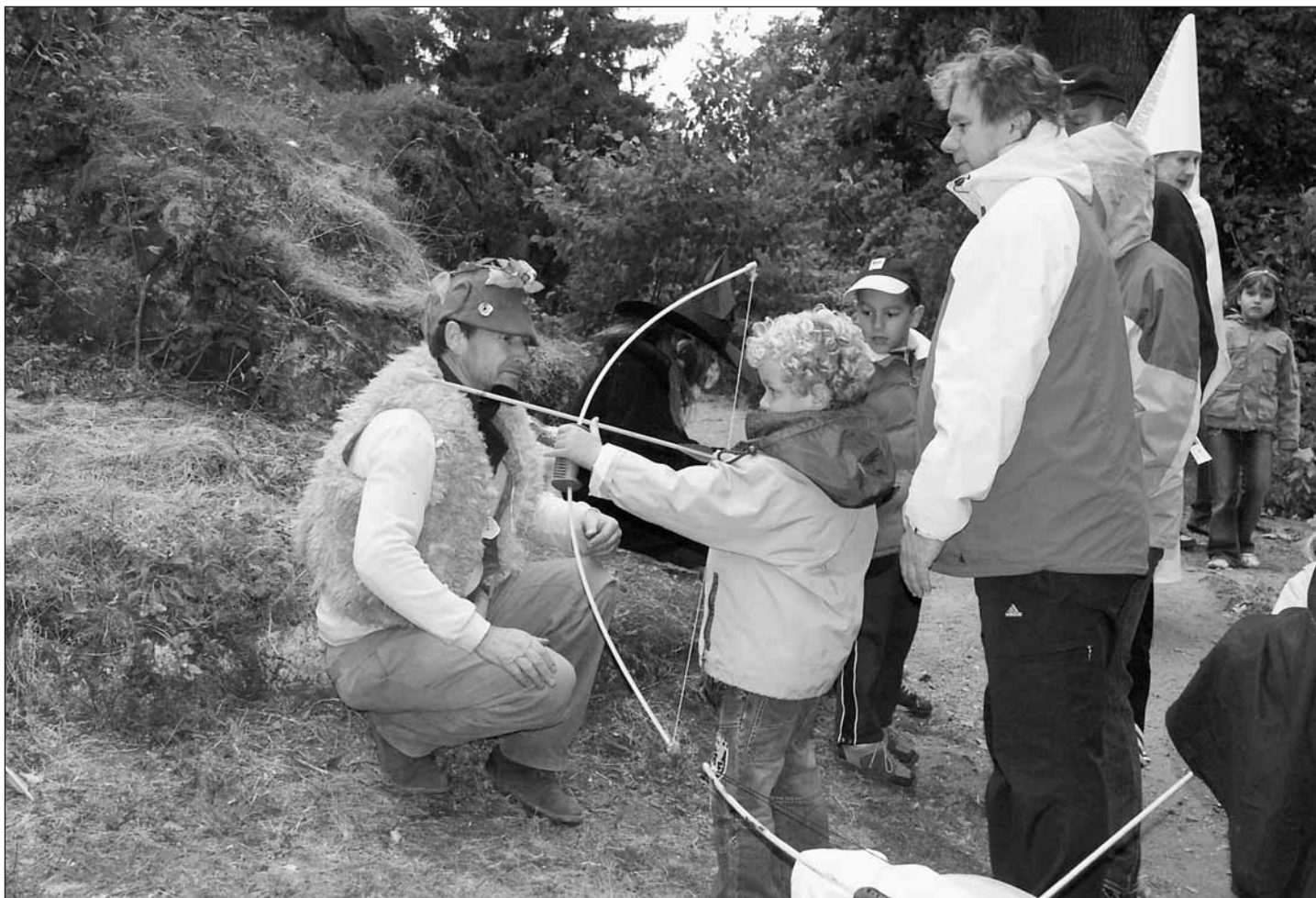
„Střelím lukem přímo na jelena!“