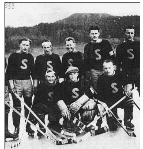
100. výročí založení ledního hokeje v Sedlci – vernisáž výstavy 6. října v 17.00 hodin.

Vstupné: dospělí 60 Kč, děti od 6 do 15 let a studenti 30 Kč (prodej vstupenek na místě před koncertem).