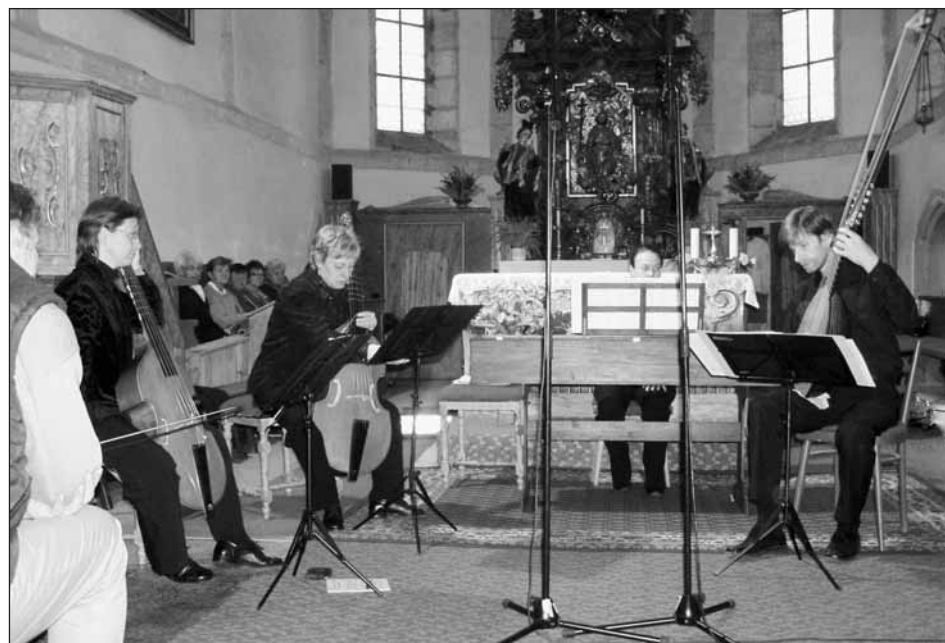
Instrumentální soubor La Gambetta.