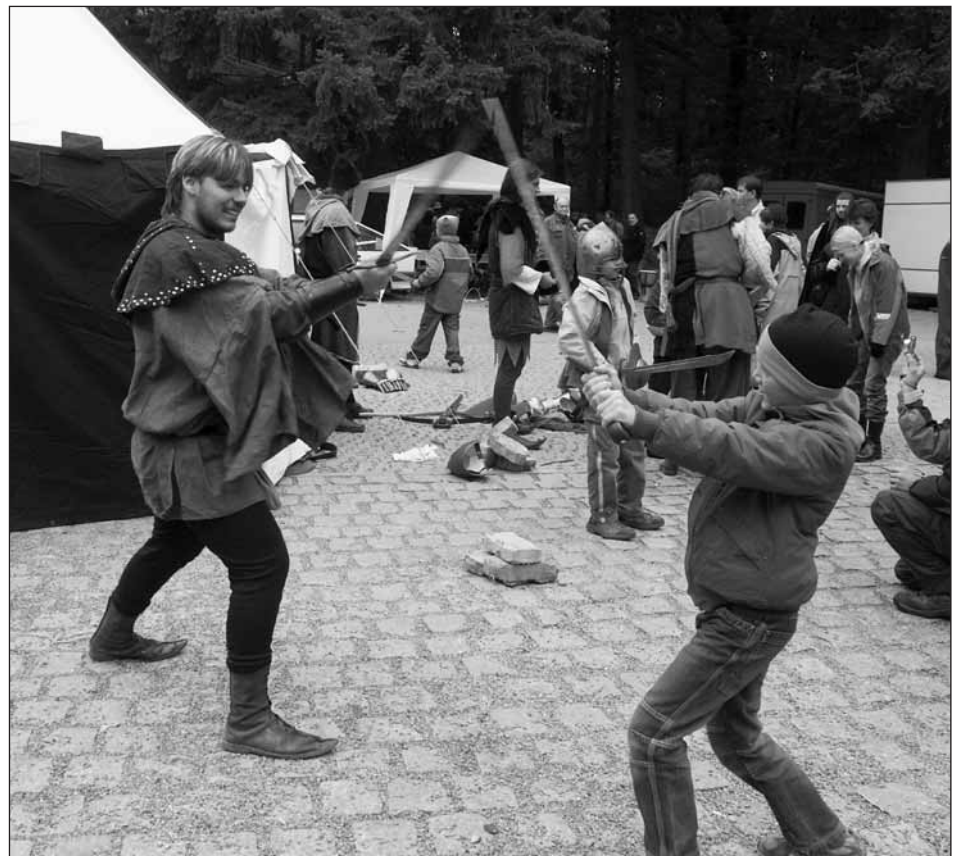
Jsem jako středověký rytíř.