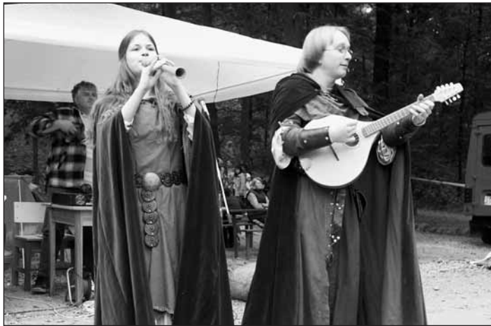
Středověké duo Elthin