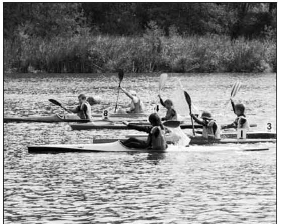
Závodníci mladší kategorie.