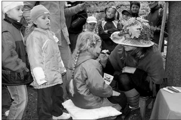
Malování na obličej v režii Rodinného centra Dráček.