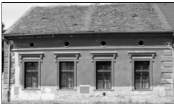
Dům č.p. 40 v Baslově ulici, o jehož historii pojednává článek..