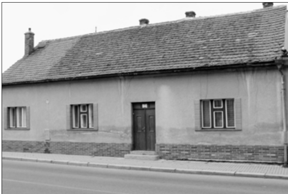
Současný vzhled domu č.p. 45 v Žižkově ulici.

Domek č.p. 44 tam stál již velice dlouho, nejméně od 17. století. V tomto domku žil místní bečvář, měl to příhodně blízko, vlastně naproti do místního pivovaru v č.p. 42 a s pivovarem samozřejmě úzce spolupracoval, zhotovoval a opravoval mu bečky a sudy. Činnost bečvářství pravděpodobně skončila nebo se významně ome-