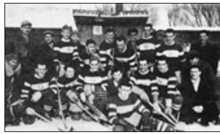
Naši hokejisté na kluzišti v Klatovech – r. 1956.