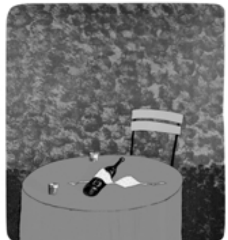
Kresba Tomáše Bíma.

Výstava potrvá do 31.10. 2008. www.bohemiasekt.cz