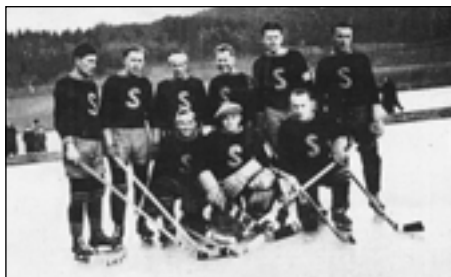
Hokejisté SK Sedlec z r. 1939.