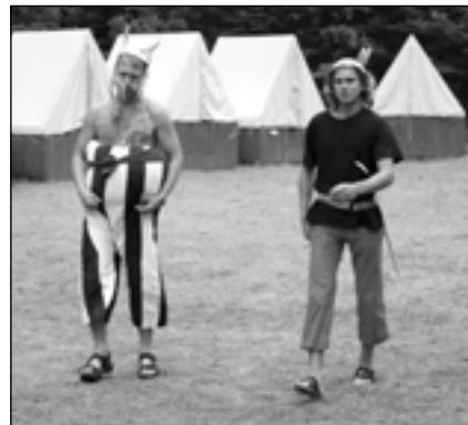
Asterix a Obelix.