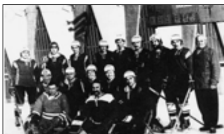
Sedlečtí hokejisté v r. 1975.