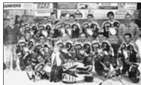
Současné mužstvo Spartak Sedlec – r. 2006.