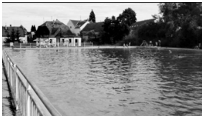
Koupaliště v našem městečku - oáza klidu, pohody, dobré vody a příjemné obsluhy.

Všichni se zachovali tak, jak se projeví přítel a dobrý člověk -