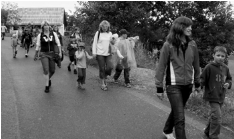
Dobývání hradu Buben.