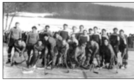
Mužstvo SK Sedlec a AC Sparta Praha na sedleckém rybníku – r. 1949.