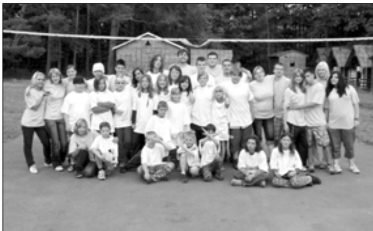
Účastníci letošních her bez hranic.