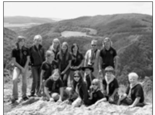
Výlet do Svatého Jana pod Skalou.