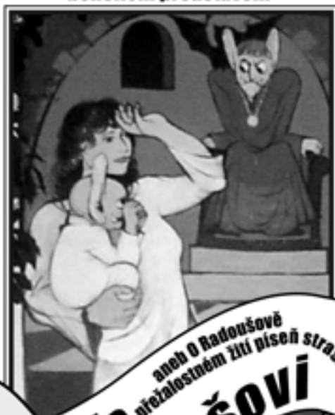
Unikátní kulisy - 12 deskových obrazů akad. malíře Vladimíra Havlice

Město Starý Plzenec, K-Centrum a městská knihovna na vědomost všem dává, že toto benefiční představení