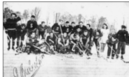
Mistrovské mužstvo LTC Praha a SK Sedlec na rybníku v Sedlci – r. 1946.