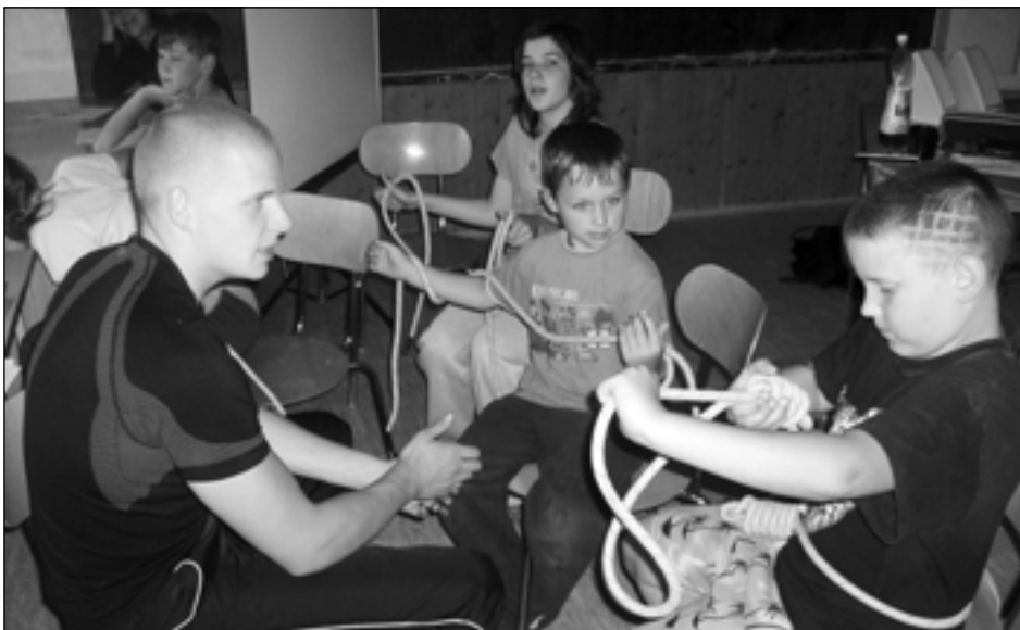
Kluci a uzlování.