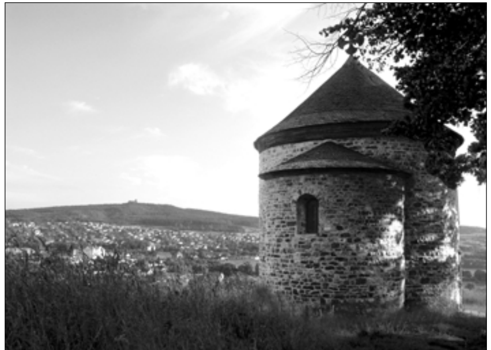
Rotunda sv. Petra a Pavla ve Starém Plzenci.