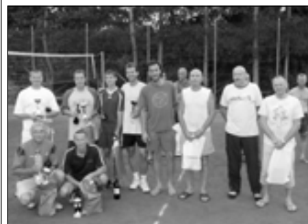
Vyhlášení nejlepších – vítězové v podřepu.