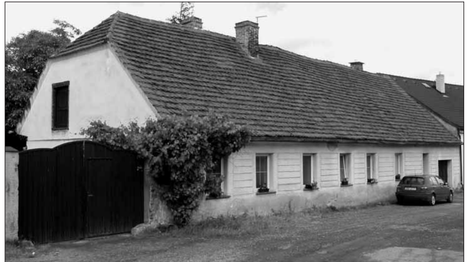
Dům č. p. 42 v Baslově ulici, o jehož historii pojednává článek.