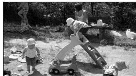
Piknik pod širákem.