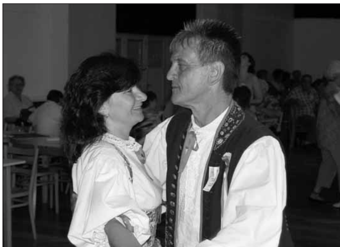
Taneční pár – jak má být.