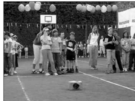
Soustředění před soutěží.