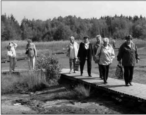
Naučná stezka po rašeliništích SOOS.