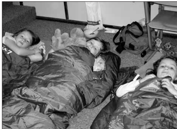
Jak sladké a dobrodružné je spaní ve spacáku.

Sedmnáct odvážných prvňáčků přespalo v pátek 16.5. ve škole. Děti se sešly v 18 hodin na zahradě školy, kde pro ně byla připravena soutěž a také sportovní náčiní