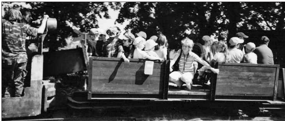
Jízda na úzkorozchodné železnici se líbila všem cestujícím.