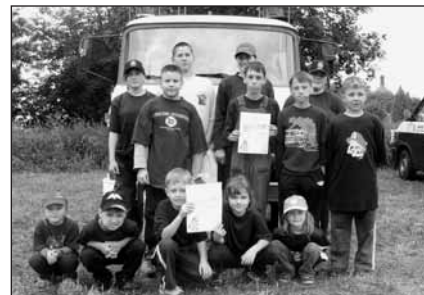
Sedlečský hasičský tým.