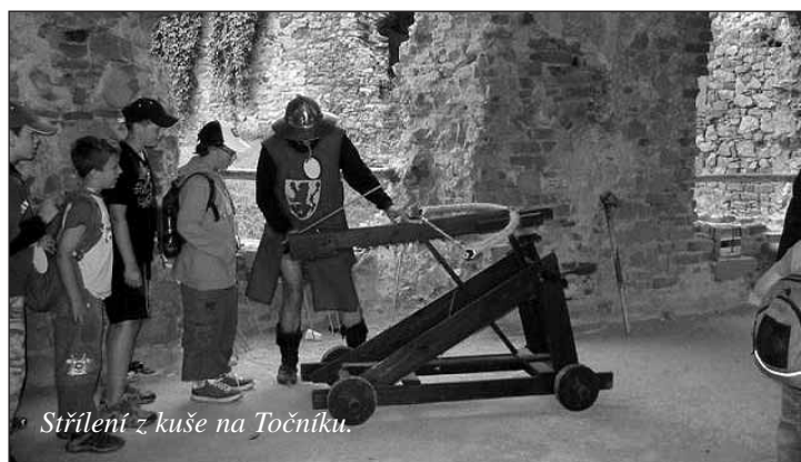
Střelení z kuše na Točnicku.