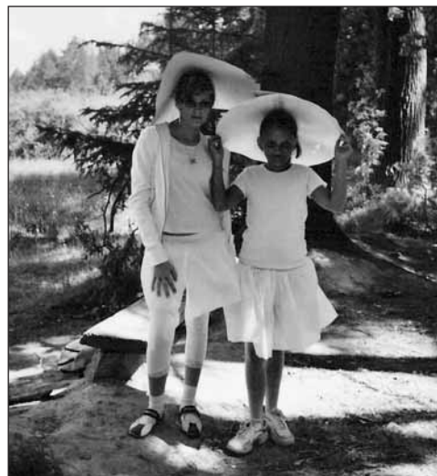
Lesní víly muchomůrky.