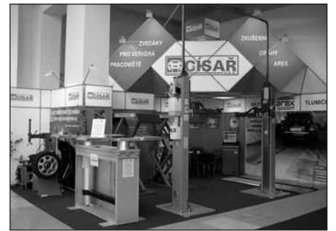
Expozice firmy, v popředí vlevo vítězný exponát.