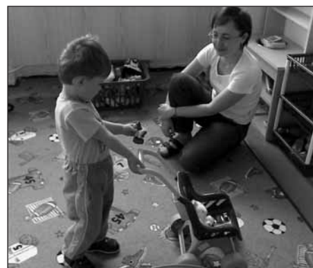
Haničku nejvíce baví v herně kočárek.