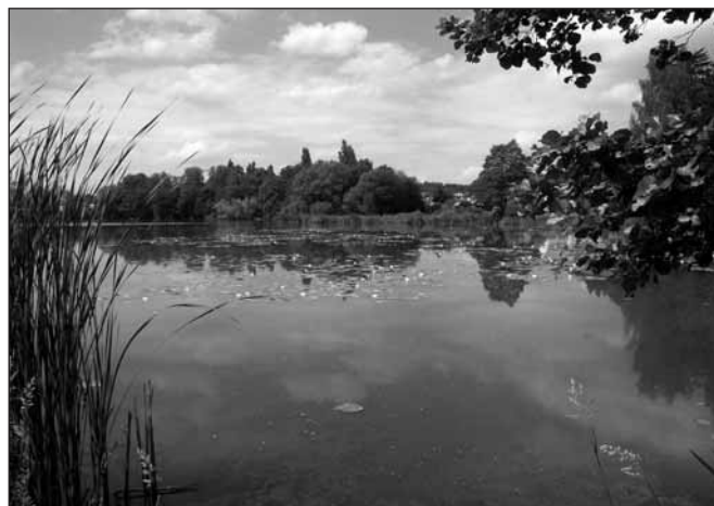
Starý rybník v Sedlci.

populace vodních rostlin závisí na mnoha faktorech počínaje např. historií vývoje území, průhledností, teplotou a pH vody,