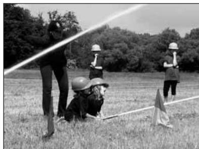
Soptiči v akci.