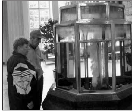
U Glauberova pramenu.