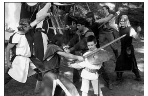
Členové volnočasového klubu Avalon v akci.