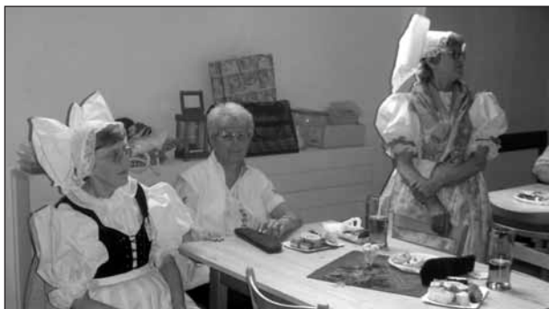
Baráčnice v krojích.