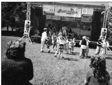
Vystoupení skupiny TK impro.