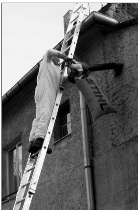
Do naší činnosti patří odchyt a likvidace obtížného a nebezpečného hmyzu.