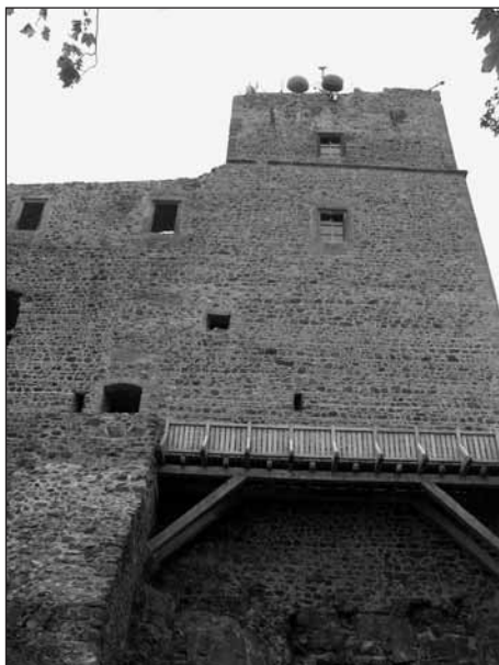
Hrad Radyně – pohled na hranolovou věž s přístupovým můstkem.

Věže měly původně tvar jako gotická věž v Kadani. Zadní věž sloužila jako vězení a hladomorna: odsouzcenci byli dovnitř věže spouštěni po provaze, schodiště tam nebylo. Existenci hladomorny prokázaly výkopy v 19. století. Našly se tam 2 kostry (odsouzence na smrt tam pro-