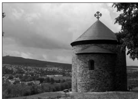
Rotunda sv. Petra a Pavla – v novém.

bylo provedeno ukotvení krovu do obvodové zdi a zpevnění ocelovými táhly. Původní i nové dřevěné konstrukce byly chemicky ošetřeny a okapová římsa opatřena kvalitním nátěrem.