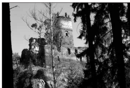
Zřícenina hradu Gutštejn.