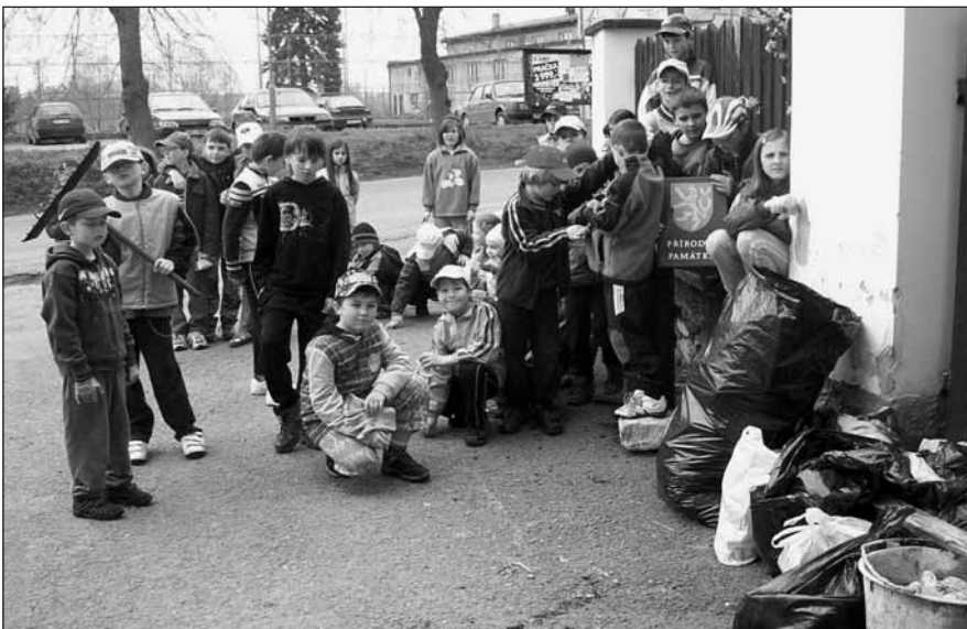
Děti za ZŠ Sedlec a jejich úlovky.