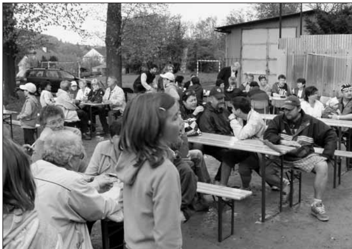
Při dobrém občerstvení a posezení se lidé výborně bavili.