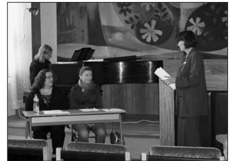
Pořadem o Jaroslavu Ježkovi zakončili posluchači Konzervatoře Plzeň tuto koncertní sezónu.

V jednotlivých číslech Radyňských listů jste měli možnost číst o koncertech zajímavé články a vidět i fotografie účinkujících,