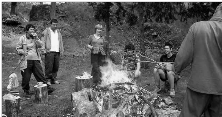
V lese u ohýnku zvlášť dobře chutná a je čas si o mnohém popovídat - více takových příležitostí.