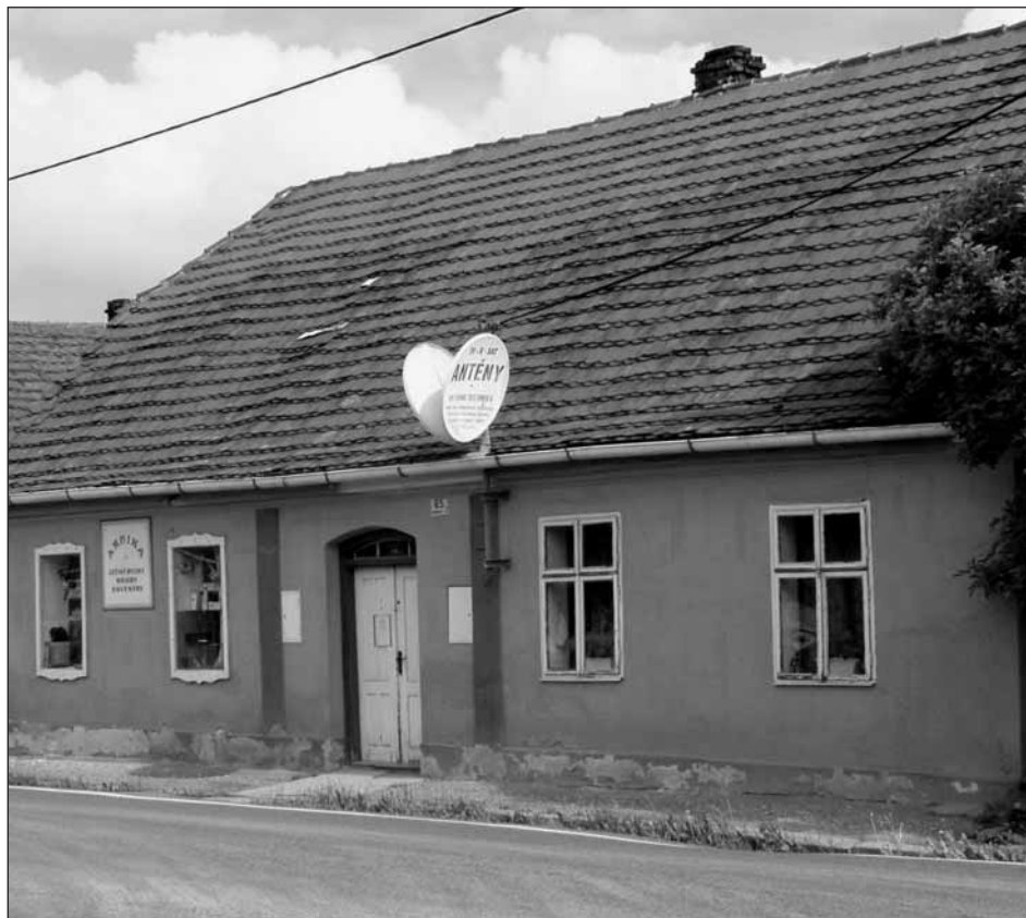
Dům č.p. 65

února 1936 se vkládá právo vlastnické na polovici Růženě Čížkové. Dnes je dům ve vlastnictví města Starého Plzece.