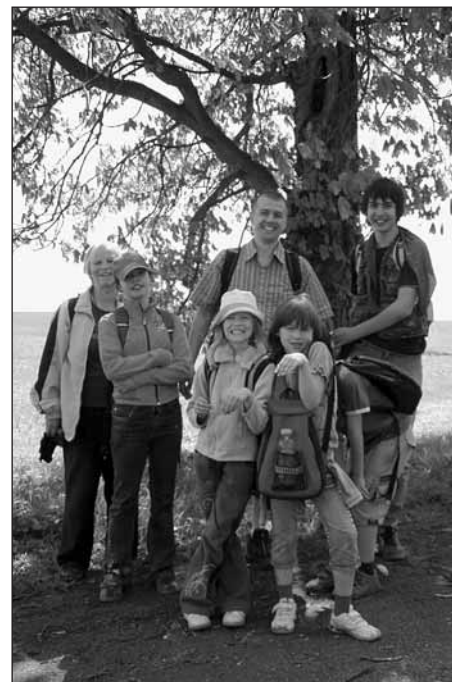
Členové výpravy + fotograf.