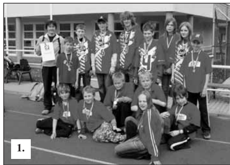
Foto 1: Vítězné družstvo mladšího žactva Foto 2: Vítězné družstvo dorostu Foto 3: Polaři v akci