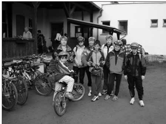
Skupina cyklistů je připravena vyrazit.