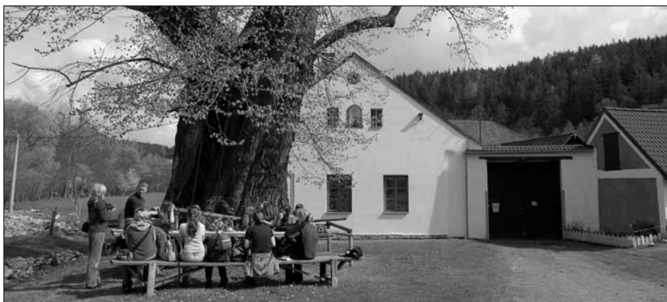
Svačina pod 600 let starou lípou.