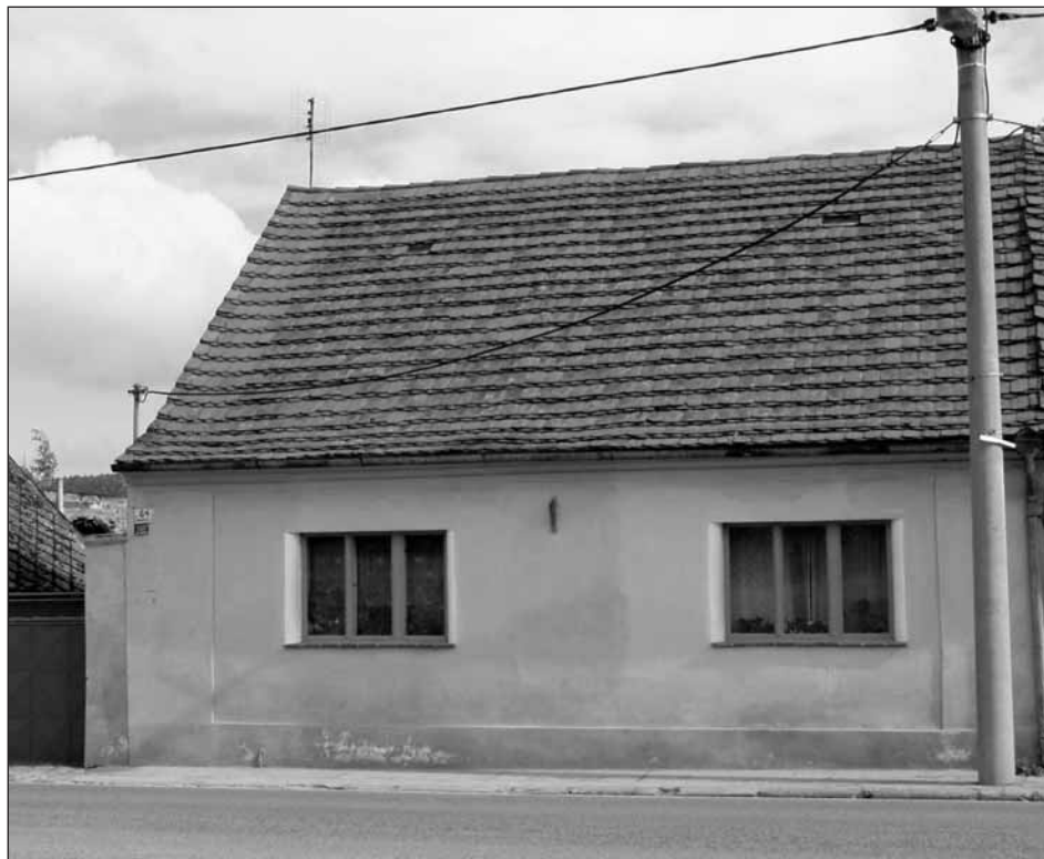
Dům č.p. 64