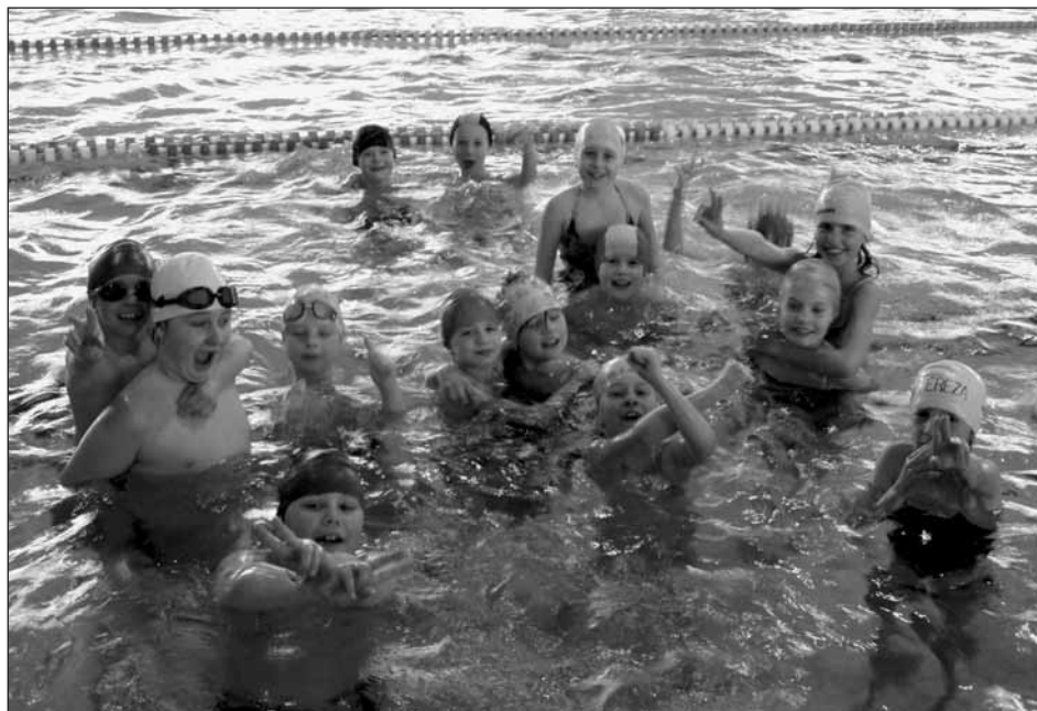
„Voda je náš život!“ (děti ze III.A)