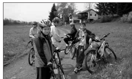
Odpočinek na trati.