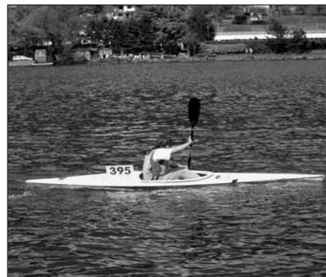
Kryštof bojuje v Ústí.

Fotografie a další články naleznete na www.stary-plzenec.cz .