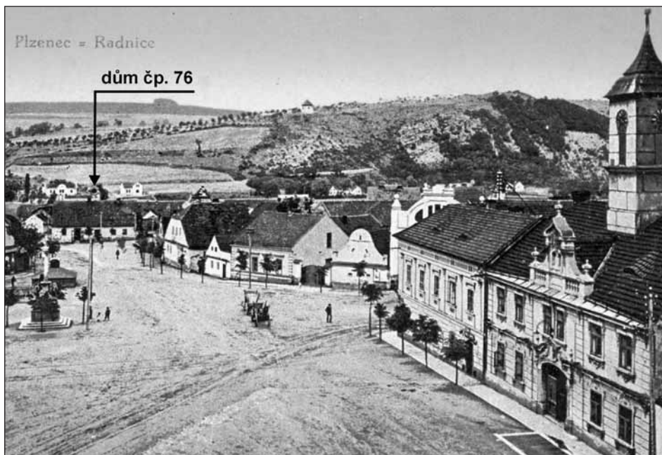
Podoba staroplzeňského náměstí v 1. pol. 20. stol. s domem č.p. 76 v pozadí (viz šipka).