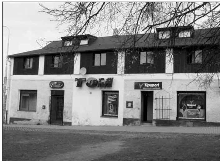
V současnosti slouží dům čp. 76 jako ubytovna a provozovna sázkové kanceláře. V 90. letech minulého století jsme ho znali jako bistro TOM.