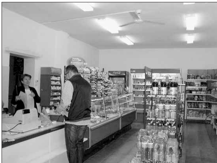
Celkový pohled do prodejny.