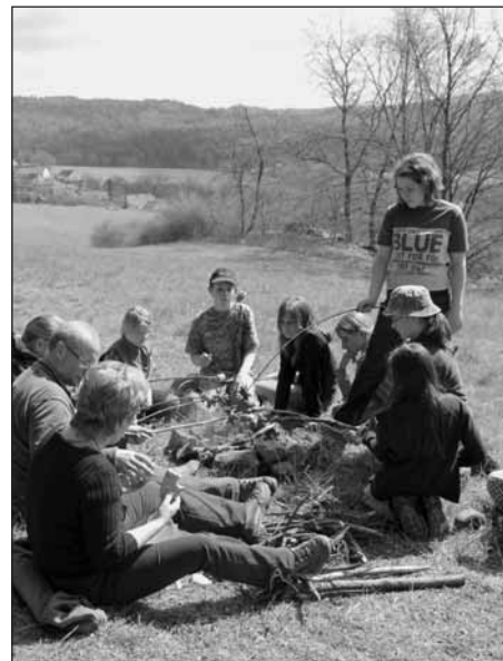
Svačina v trávě.