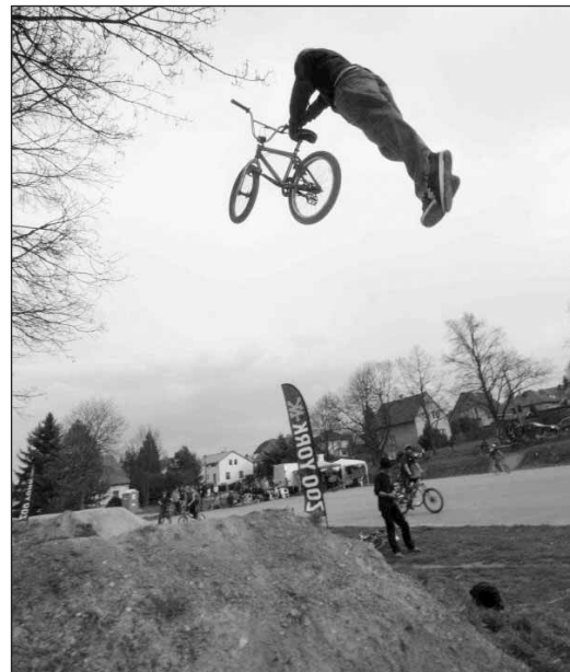
Jeden z účastníků závodu předvádí riskantní trik s názvem „superman seat grab“.