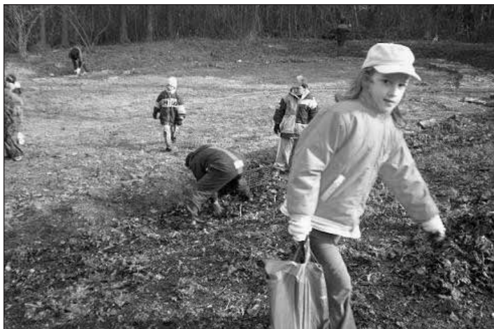
Úklid je zábava.