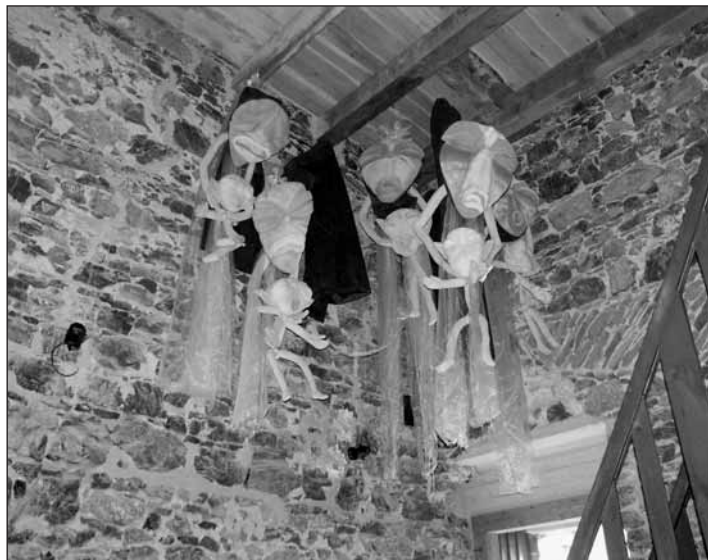
Své místo mají v hradní věži i duchové, kteří stráží přichozí návštěvníky.