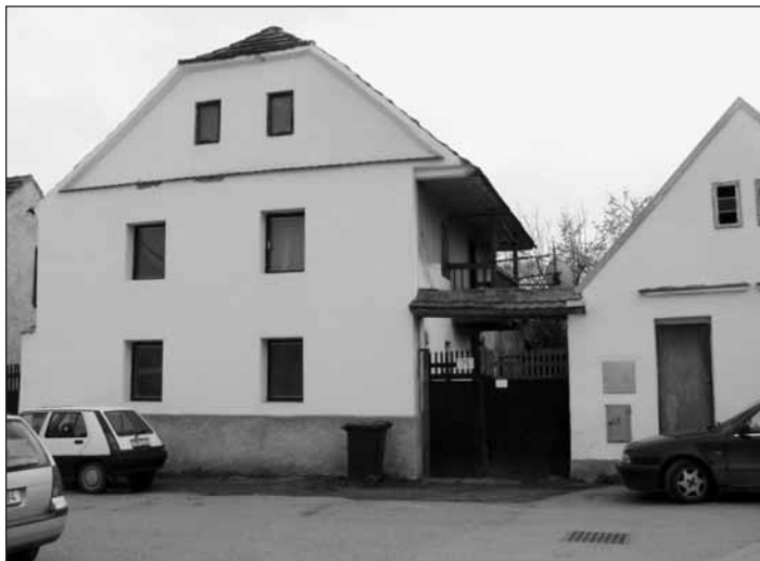
Dům čp. 75 je charakteristický svojí starodávnou pavlačí.