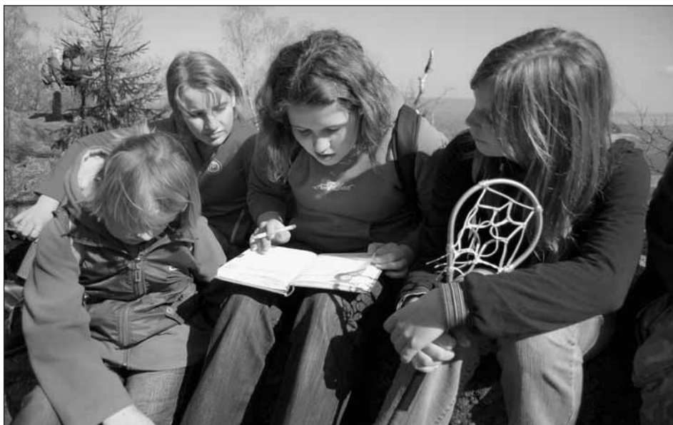
Zápis do vrcholové knihy na Žďáru.