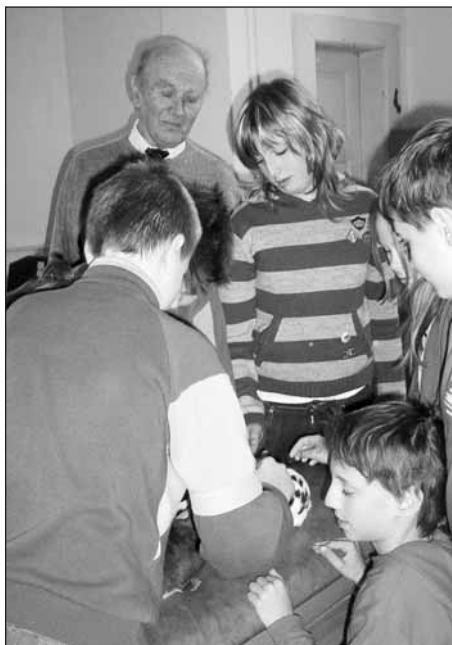
Po pohlázení zvířecího kamaráda zatoužil každý.