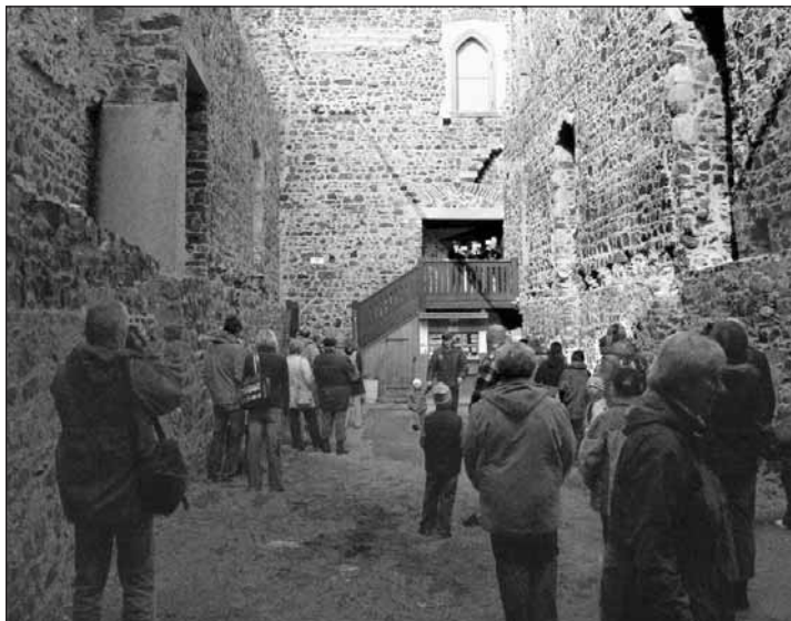
Sluncem zalitá Radyně spolu s fanfárami trubkového tria navodila příjemnou až lehce tajuplnou atmosféru.