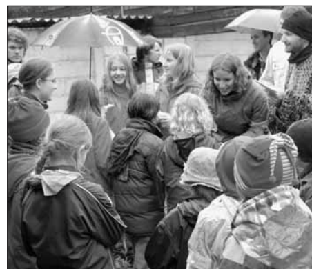
Deštivé vyhlášení závodu.