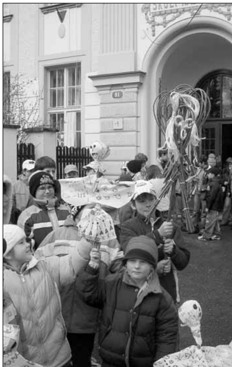
Vynášení Smrtky, jinak Smrtholky, Moreny či Mařeny.