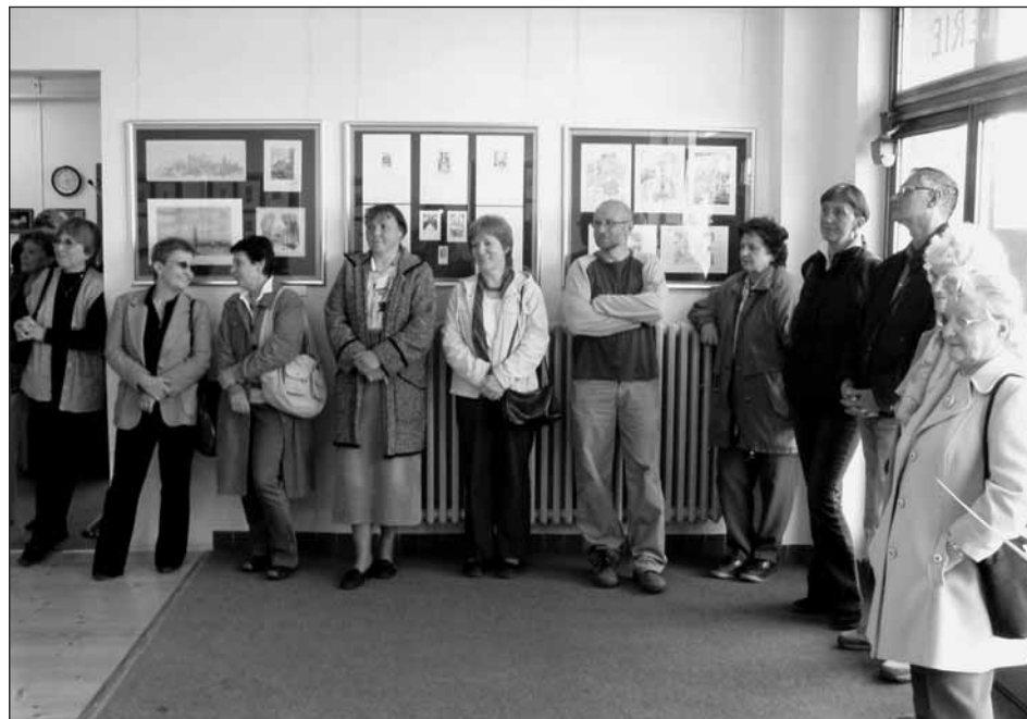
Účastníci vernisáže výstavy Krajina s Radyní si domů odnesli mnoho příjemných zážitků.