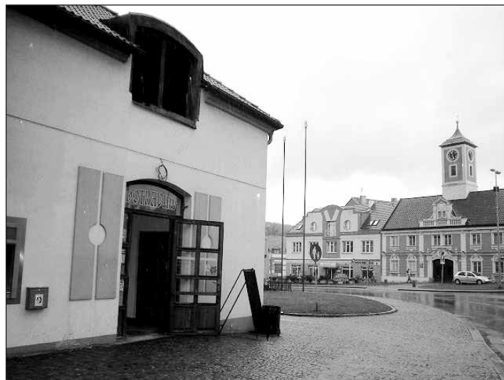
Vchod do prodejny potravin Na Růžku.