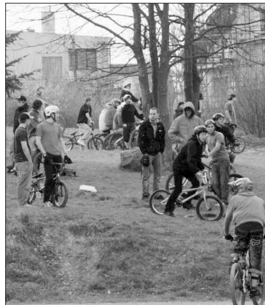
V centru dění závodů se shromáždil hojný počet diváků.